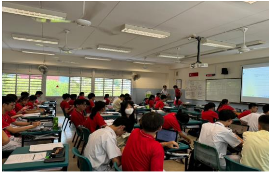
義順中正中學參觀—入班體驗