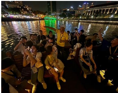
克拉碼頭、水上計程車