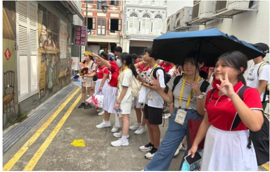
與新加坡學伴實地踏查—牛車水