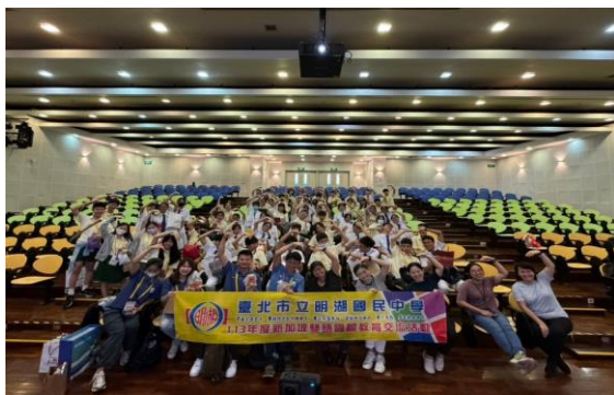
義順中正中學參觀—雙方學生交流簡報