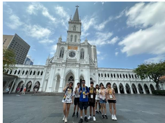
城市探索—讚美館場