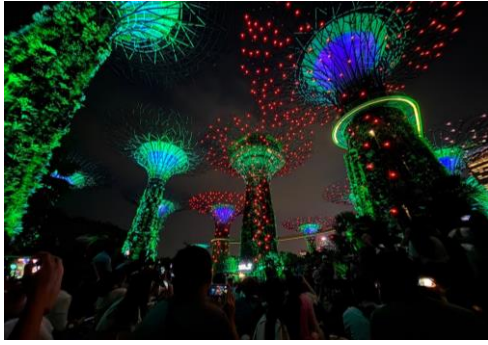
濱海灣花園—城市規劃