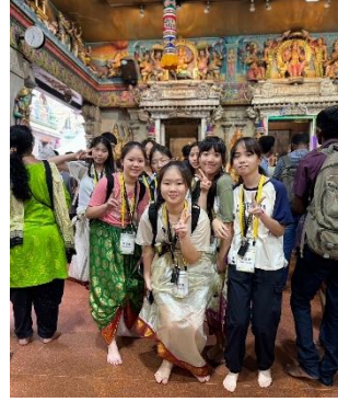
異國文化探索—小印度特區