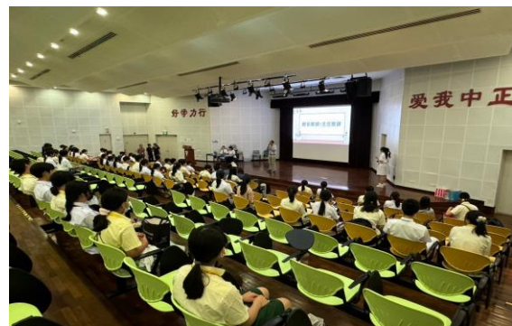
義順中正中學參觀—雙方學生交流簡報