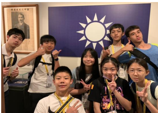
城市探索—歷史博物館