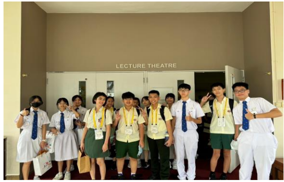
義順中正中學參觀—入班體驗