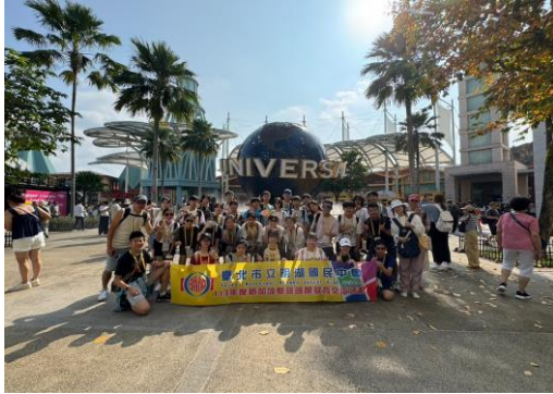
小小記者採訪—環球影城