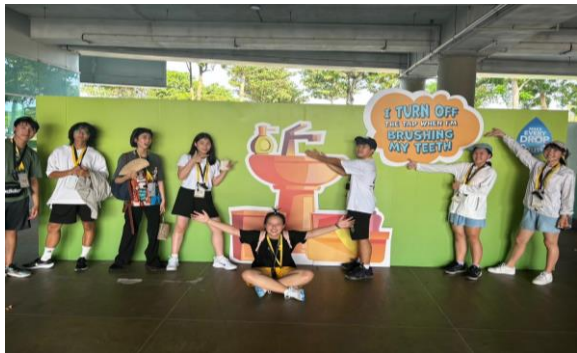
水資源—濱海堤壩展示中心