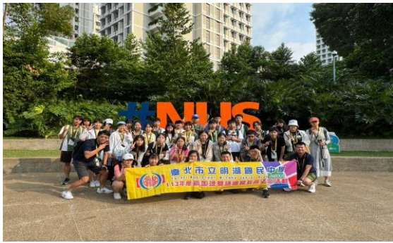
新加坡國立大學參觀