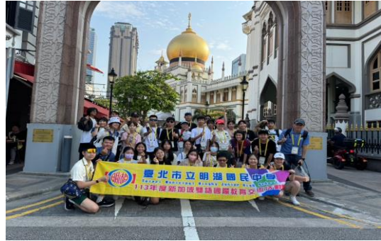
與新加坡學伴實地踏查—甘榜格南