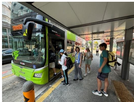
城市探索－體驗雙層巴士