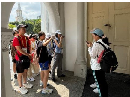
城市探索－小小導遊