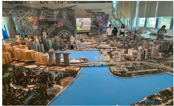
新加坡城市規劃館