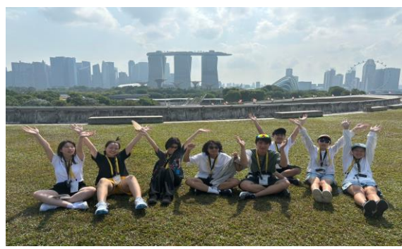
水資源~濱海堤壩展示中心