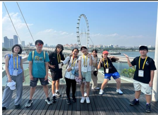
城市探索－金沙酒店