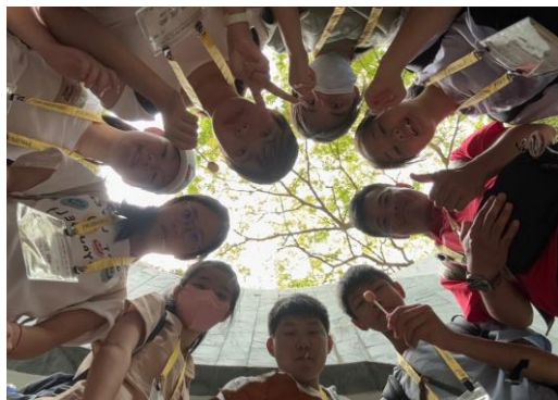
城市探索－福康公園