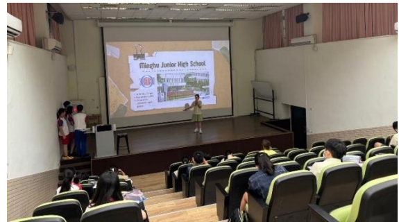
教育訓練－臺北、明湖國中英語介紹