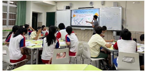
教育訓練－城市探索