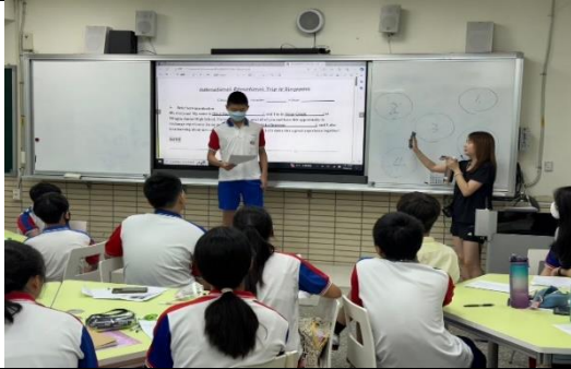
教育訓練－小小記者採訪口語練習