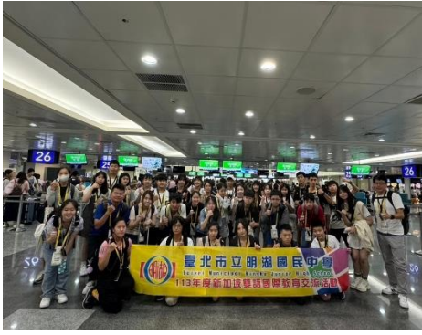
新加坡國際教育旅行出發