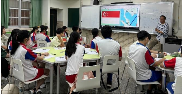
教育訓練－認識新加坡