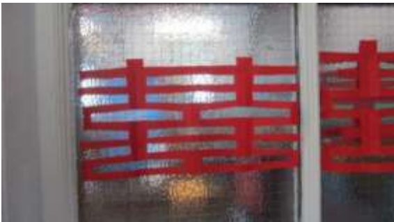
教室佈置有國際元素

該校校長表示，非以英文為母語的移民子女，他們的母語學習應保有第一母語的學習，因為語言是文化的根源，全球化的社會中多元文化的保有及尊重是社會進步的一環，該校在學生第二外語方面，則有中、法二種語言可以提供學生學習，每一個班級的門口都掛有雙語以上的歡迎牌子，教室內則有各種語言的故事讀本，也有介紹猶太教、伊斯蘭教、基督教及天主教的一些書籍，四年級教室的窗戶上裝置了囍字，其實是他們學習幾何圖形的教學材料之一，可見國際元素充分圍繞與融入學生的生活及學習中。