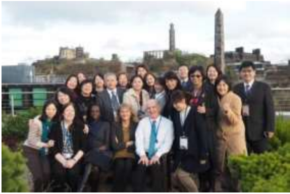
英國文化協會愛丁堡辦公室與國際教育 研習講師及研習者合影