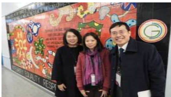
於 Shawlsnds Academy 學生壁畫前與英國文化協會人員及其他研習者留影

教室的佈置除了德語的字卡外，也有張貼德國對世界的影響（German matters in the world）在牆上，並將蘇格蘭的一些時事與德國進行對照，符合教學環境在國際教育的佈置安排。