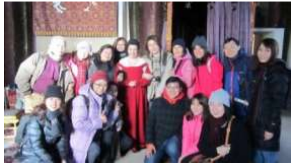
於洛蒙德湖自然步道與其他研習者合影 於史特靈城堡與其他研習者合影