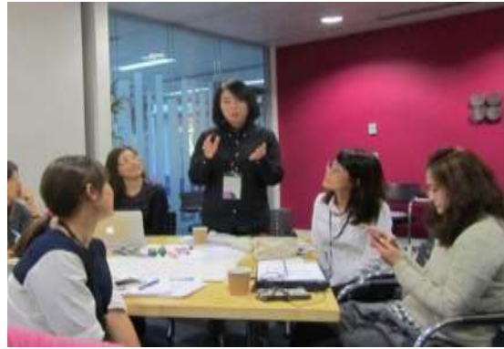
於英國文化協會愛丁堡辦公室參與國 際教育研習時發表