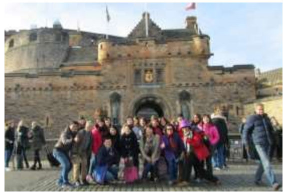
於荷里路德宮前與其他參與研習者合影