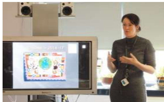
副校長說明學校執行國際教育情形