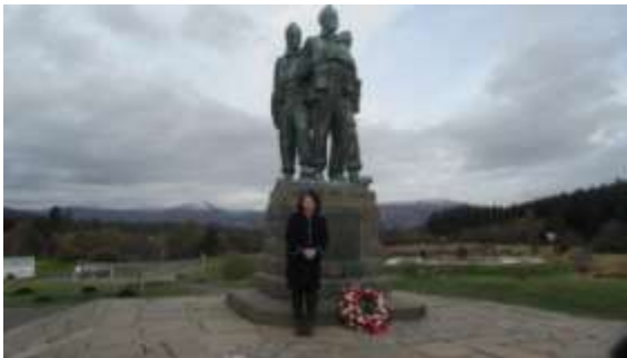
於格倫科峽谷 Glen Coe 留影

奧古斯堡位於最南端尼斯湖上的大峽谷步道，是著名的旅遊地點，奧古斯堡是尼斯湖周邊的壯麗景色，是遊客和單車騎士，最喜愛的散步地點。