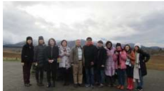
於格倫科峽谷與其他研習者合影