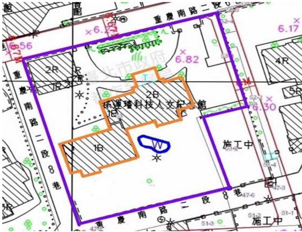
直轄市定古蹟「孫運璿重慶南路寓所」範圍示意圖

古蹟及其所定著土地範圍之面積及地號：古蹟本體為中正區重慶南路 2 段 6 巷 10 號建物本體，建物為中正區南海段五小段 17、2335 建號（17 建號面積 112.05 平方公尺、2335 建號面積 384.45 平方公尺）及其附屬設施為魚池（面積 21.6 平方公尺），建築物坐落土地為中正區南海段五小段 53、53-3 地號（53 地號面積為 2863 平方公尺、53-3 地號面積為 74 平方公尺）。（實際保存面積須以保存範圍實測數據為準）