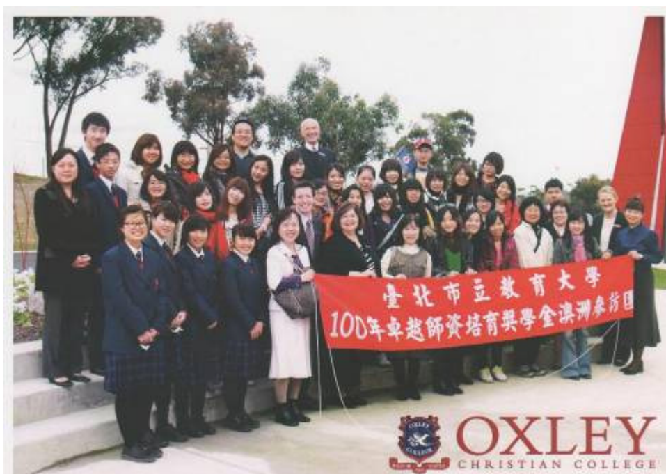
與 Oxley College 教職員及學生共同合照

學生可參加校內音樂活動，或加入樂團、樂隊、合唱團。校內有許多訓練學生領導才能的機會，而且每個年級每年都會舉辦一次校內露營的活動。校方還會舉辦正式的晚宴和培養工作經驗的實習計劃。而除了英語外，並開設有中文、德文及印尼文等 3 種語言課程。並為國際學生開設以英語為第二語言的課程。