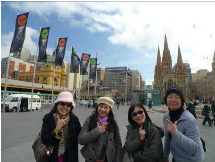
師長們在全世界票選為最適合居住的城市—墨爾本留下輕鬆的一面