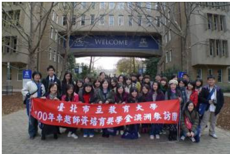
於墨爾本大學校園合影

墨爾本大學不僅是澳洲八大名校，更是 Universitas 21 的成員，在153年的歷程中，墨爾本大學一直在澳大利亞的高等教育及科學研究領域，發揮著重要作用。墨爾本大學有十一個以文、理、工、社科等不同專業為教學科研方向的學院。這些學院是：建築與計劃學院、文學院、經濟及商業學院、教育學院、工學院、土地與食品資源學院、法學院、醫學院、音樂學院、理學院、以及獸醫學院。