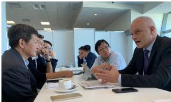
與 SportAccord 總經理會談

舉辦的規則是每年會輪流在不同洲舉辦，有鑑於 2020 將在北京舉辦，臺北想要申辦 2023 年 SportAccord 是可行的