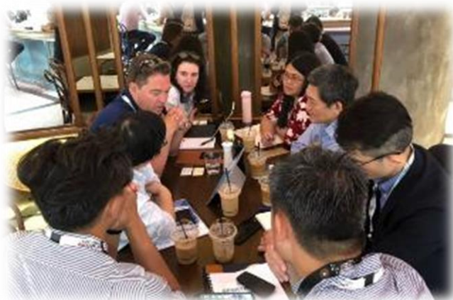
與 IMGA 進行會談

在中國大陸一再打壓臺灣參與國際相關事務的此刻，此賽會政治干預性低，選手並不是報名代表各國或地區參與賽