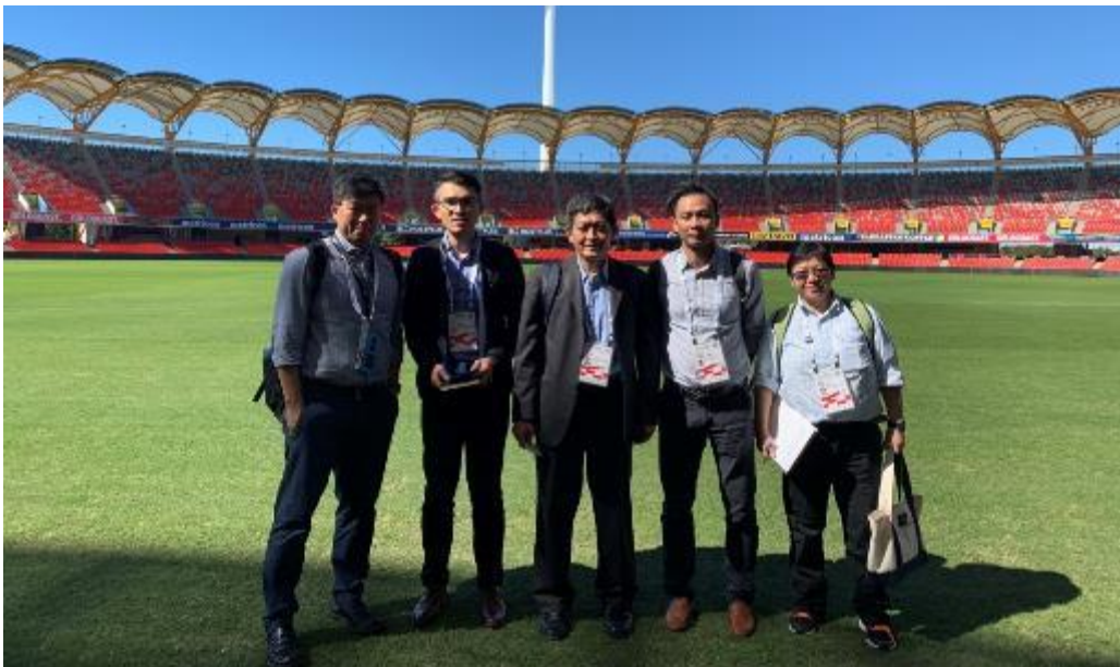
參訪大英國協運賽會場館-英式橄欖球場

澳洲是目前運動觀光產值最大的國家，除了曾舉辦壯年運動會提升其運動觀光市場外(1994 布里斯本、2020 墨爾本、2009 雪梨)，黃金海岸舉辦大英國協運動會後續之場館除了提供一般民眾使用外也導入專業運動課程訓練基層運動員，另將其場館轉型為訓練基地，提供各國代表隊及職業球隊進行移地訓練，提升其場館使用率，也促進其觀光產業發展。