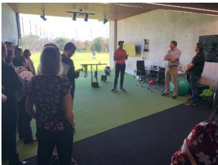
大英國協運動會場館參訪-KDV Sport

5月5日 Sport Accord 大會所安排的 2018 大英國協運動會賽後遺產參訪行程，參訪了黃金海岸運動園區等場館，包含了主場館 Metricon Stadium、黃金海岸休閒與運動中心、KDV Sport、水上中心等，有許多的新建場館。黃金海岸利用辦理此次國際大型綜合性運動賽會的機會，整體性地規劃城市內運動場館及設施的更新，並且非常著重賽後場館的活化與利用，部分場館直接 OT 予民間公司經營，以類似於本市運動中心的方式進行營運，並強調賽事舉辦、參與人次及場館獲利。但其中具有特色及不一樣的是，黃金海岸標榜符合各國際單項運動總會(ISF)的世界級標準競賽場地，並與原 2018 大英國協運動會所興建之選手村做住宿配套，向外國招攬移地訓練，吸引其它國家的國家隊或職業隊付費至黃金海岸進行移訓，這樣的模式非常值得借鏡。