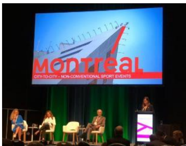
City to city 分享-蒙特婁

蒙特婁由「Sports events Montreal」代表進行分享，首先強調蒙特婁的特色進行城市行銷，它是千禧世代最愛城市排名第二、美洲最好的學生城市、有超過 150 個節慶及賽事活動、科技產業發達、UNESCO 設計城市，並且富具文化多樣性。