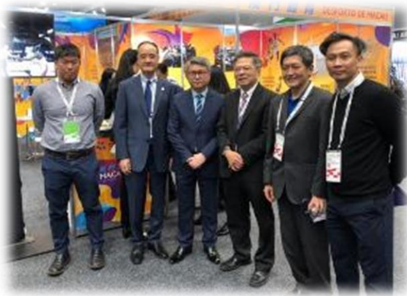
與澳門體育局交流

透過參與 SportAccord 國際體育年會，除了可以了解國際體育發展趨勢做為未來城市體育發展藍圖擬定的方向，另外透過會場上的交流，可將國際賽事引進本市舉辦，儲備本市未來舉辦大型賽會的能量。藉由相關的宣傳活動，提升城市能見度，讓國際社會了解本市大型賽會之能力。其中高雄市每年皆會派員與會，而澳門更是連續 10 年為 SportAccord 贊助商，每年皆於會場設攤行銷其國際賽事，提升城市運動觀光的市場。