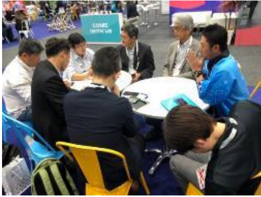
與關西壯年運動會組委會會談