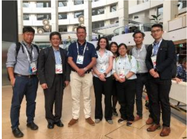
與 IMGGA 執行長及賽事經理會面

2.其競賽項目並沒有固定的必辦項目，完全是主辦單位考量，是否由合適場館及該項運動的普及性。