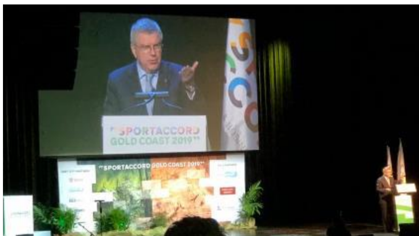
SportAccord 開幕式-國際奧會主席巴赫致詞

若將 SportAccord 引進本市舉辦，加強本市與國際體育界的交流與合作，將可大幅提升本市國際能見度，將本市民眾對於運動的熱情、籌辦賽事的能力，傳達於每一個參與的體育界人士，對於外來本市申辦國際大型體育賽會將有極大的幫助。