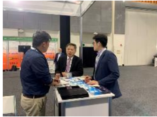
攤位訪客-國際武術聯合會主席

透過攤位的設置，也有部分單位前來交流，如國際德州撲克總會至本攤位討論於本市辦理國際賽事並尋求協助；日本 2021 關西壯年運動會執委會，與本市討論協助宣傳該賽事等……。