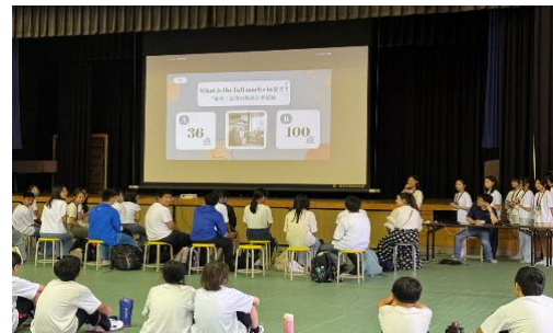
金華學生介紹學校文化