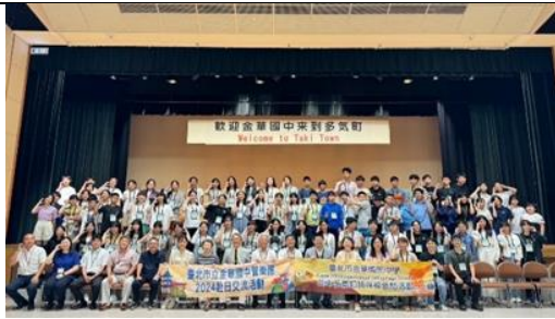
第一天於多氣町教育廳（相見歡）