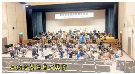
三校合奏曲目有兩首