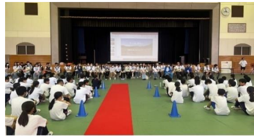
第二天於勢和中學