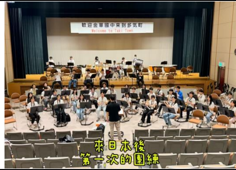
來日本後 第一次的團練