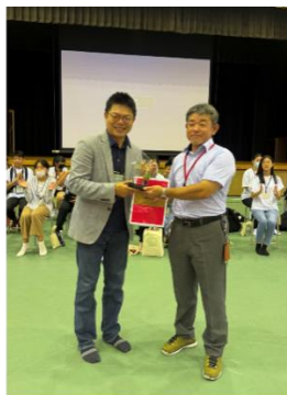
金華教務主任和勢和校長