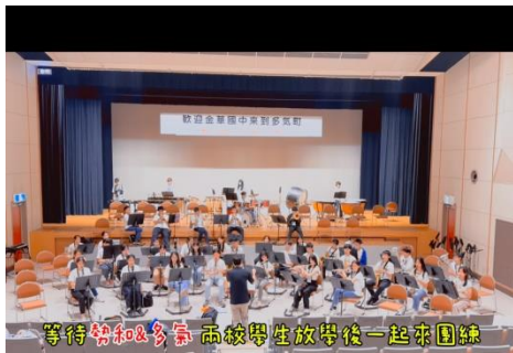
等待樂和氣多兩校學生放學後一起來團練