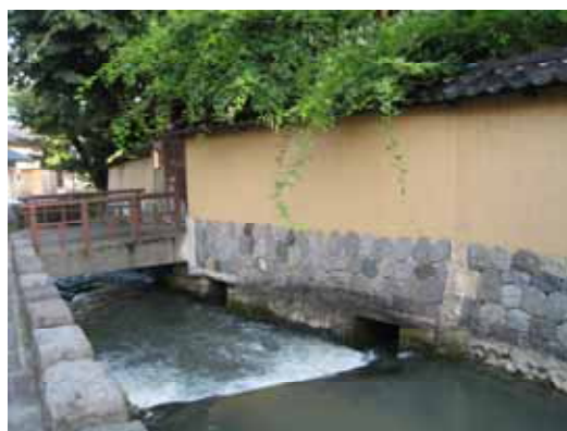
照片：長町武家屋敷具特色的狹窄石板路（左）與金澤最古老的水渠大野庄（右）