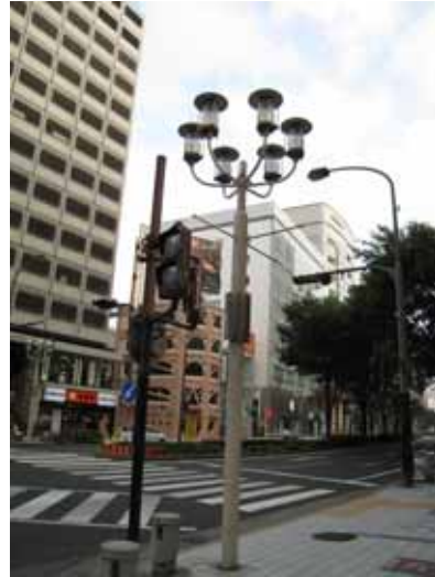
照片：名古屋市區行人街道表情豐富街道家具