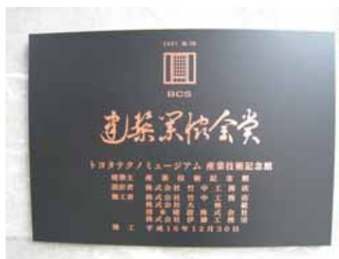
照片：屢獲建築大獎的豐田產業技術館