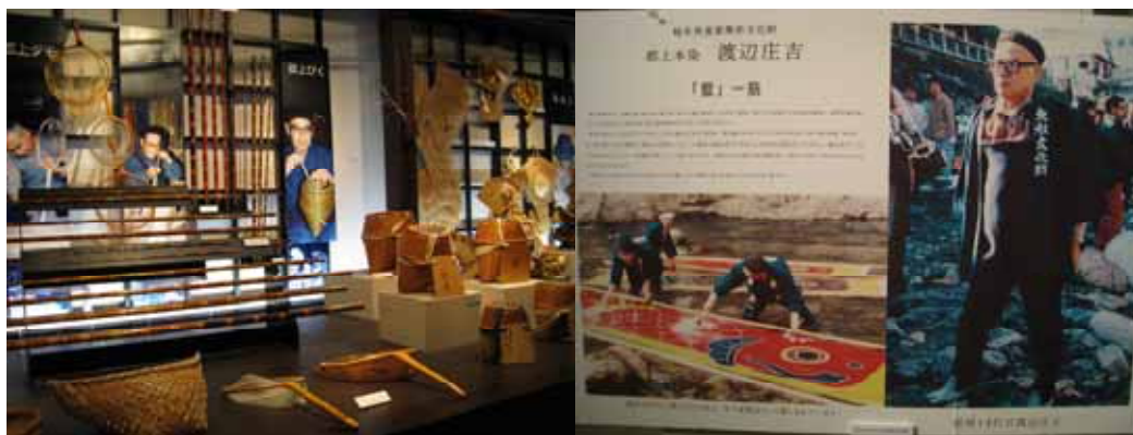
照片：郡上八幡博覽館展示內容

(二) 以科學談水源、歷史上的宗祇水、水舟、戲水、藍染、水的住民憲章。(三) 郡上八幡的歷史脈絡。(四) 因水而生的傳統手工藝及藍染人間國寶。(五) 九百多件文化材的介紹。(六) 郡上踊展示室。透過該博覽館，郡上八幡居民得到自我肯定的管道，進而珍惜守護自己的家鄉。