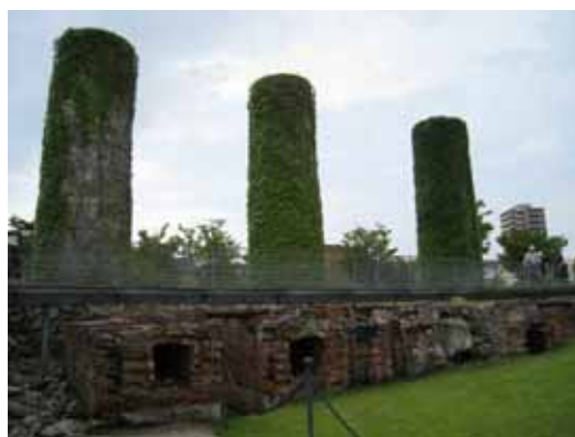
照片：近代產業遺址再利用規劃為都市森林