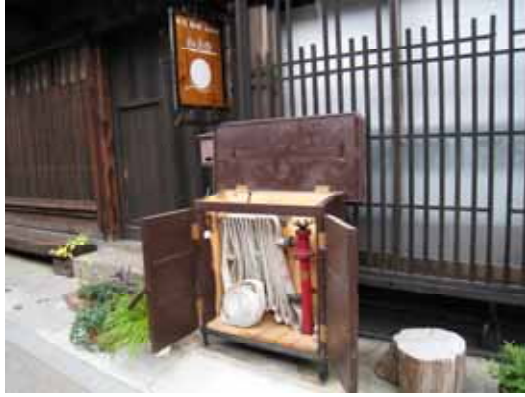
照片：奈良井街道上的消防設施