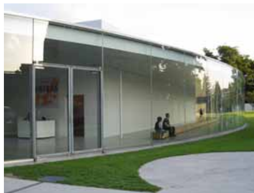
照片：簡潔設計風格的 21 世紀美術館