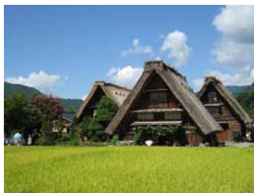
照片：世界文化遺產合掌屋集村