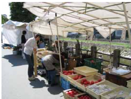
照片：中午時分一到，各農家快速收攤整理

當我們在高山別院下車，走到市集已接近 11 點半，已見部分攤商陸陸續續準備收攤，到 12 點，全面淨空，恢復其原有人車通道空間，此場景，讓人不得不讚嘆住民自律的民族性，相同情境若放在台灣，結果應是大大的不同，我想！