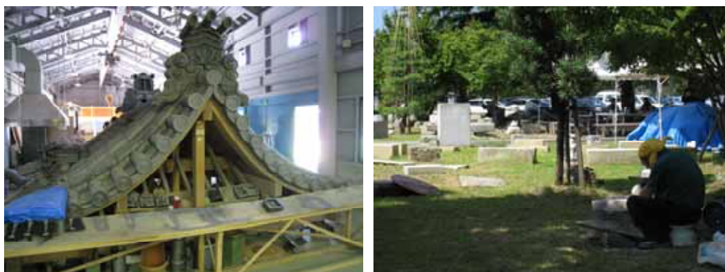
照片：「軟實力」的培訓與傳承－金澤職人學校

因此，一個藝術文化活動中心與保存傳統技術的機構共存於同一場域，成為金澤市文化地標，同時也是市民心中的驕傲。