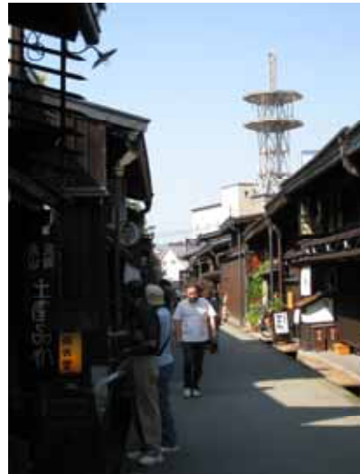
照片：高山三町轉角處新建建物（左）與保存地區街景（右）