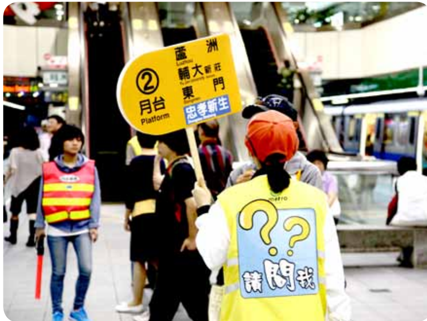
▲ 圖 11 轉乘達人