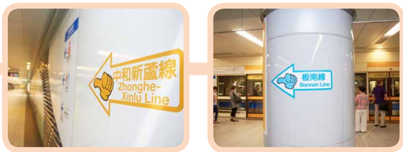
▲ 圖 6 大媽哥指標