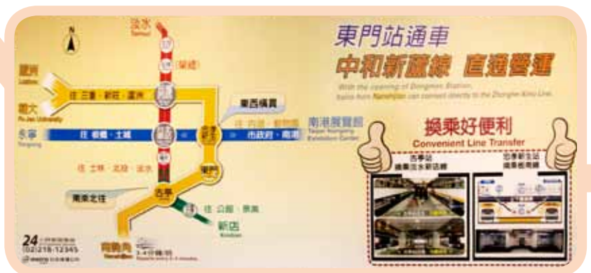
▲ 圖 4 大型看板

內容也設計「南來北往古亭站轉乘」、「東西橫貫忠孝新生站轉乘」的轉乘口號，更加深旅客對於分流轉乘的印象，該款海報於 2012 年 6 月起在全線車站與高運量電聯車車廂上刊，並持續宣導至東門站通車後 1 個月。