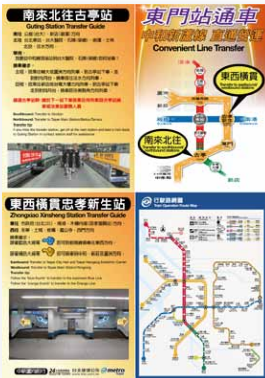
▲ 圖 8 分流隨身卡

除了隨身卡外，針對老弱婦孺、身障旅客製作的「轉乘提醒識別小貼紙」，設計紅、藍 2 款，紅色提醒貼紙印有「請提醒我古亭換車」、藍色提醒貼紙印有「請提醒我忠孝新生換車」，此款創意行銷手法配合市長宣佈通車日的記者會發布，並自東門站通車日起派遣專人於中和線 4 站發放，當轉乘車站服務人員看到旅客貼或持有識別貼紙，會主動引導並協助轉乘，也期盼對於搭乘方式爛熟的同車旅客，發揮助人為樂的精神，能協助提醒其於轉乘車站上下車，轉搭其他路線列車，減少旅客坐過站情形。