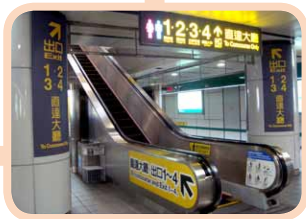
▲ 圖 5 巨幅指標