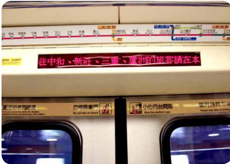
▲ 圖 10 列車旅客資訊顯示轉乘資訊