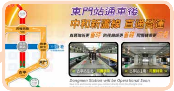
▲ 圖 2 公益廣告燈箱