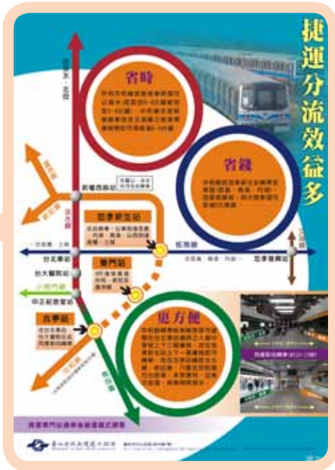
▲ 圖 1 捷運局版—分流宣導海報