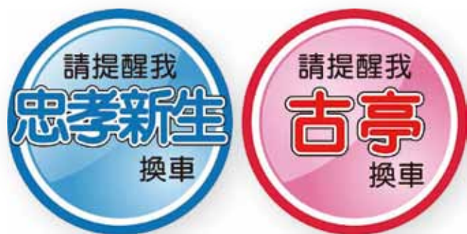
▲ 圖 9 轉乘提醒貼紙