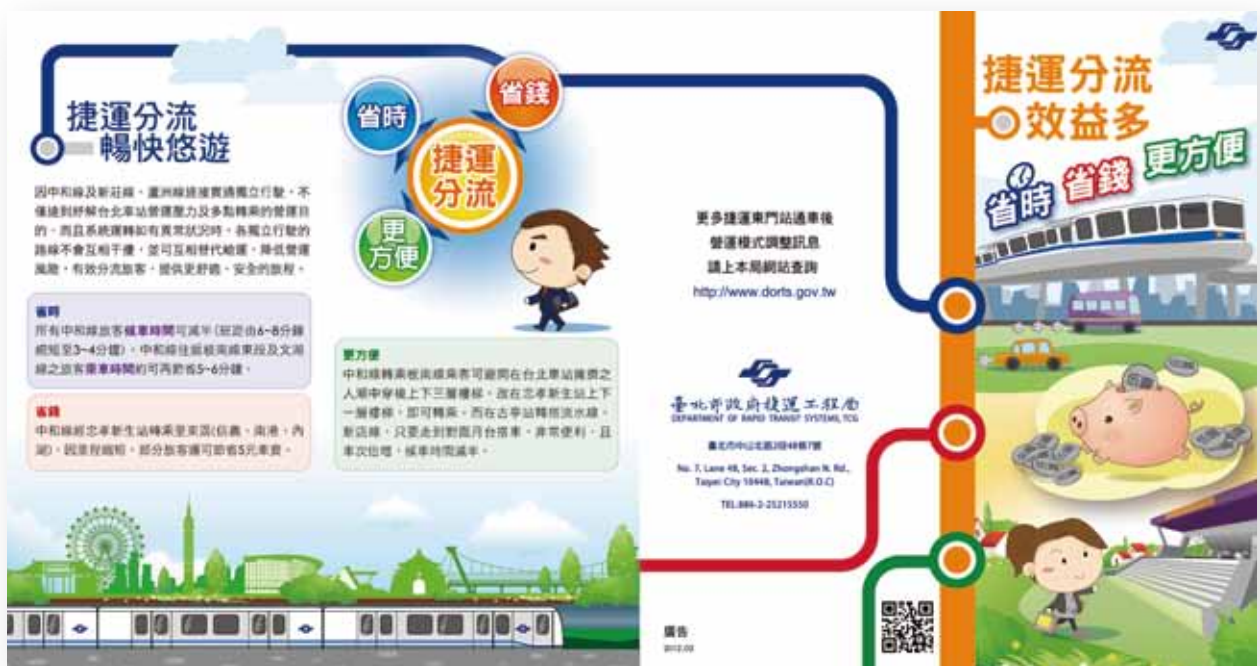
▲ 圖 7 捷運局版摺頁

捷運公司創意發想並精心製作「分流隨身小卡」，將旅客如何搭乘、轉乘的乘車資訊，製作成隨身卡型式可隨身攜帶，並於東門站通車前 3 天即開始派遣專人於特定時段在中和線車站發放分流隨身卡，