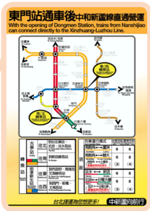
▲ 圖 3 捷運公司一營運宣導海報