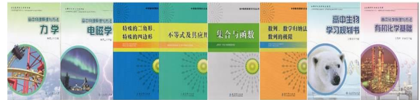
学校公开出版的教材