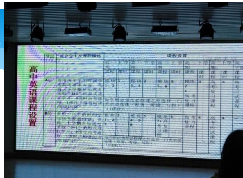
十一學校英語課程設置