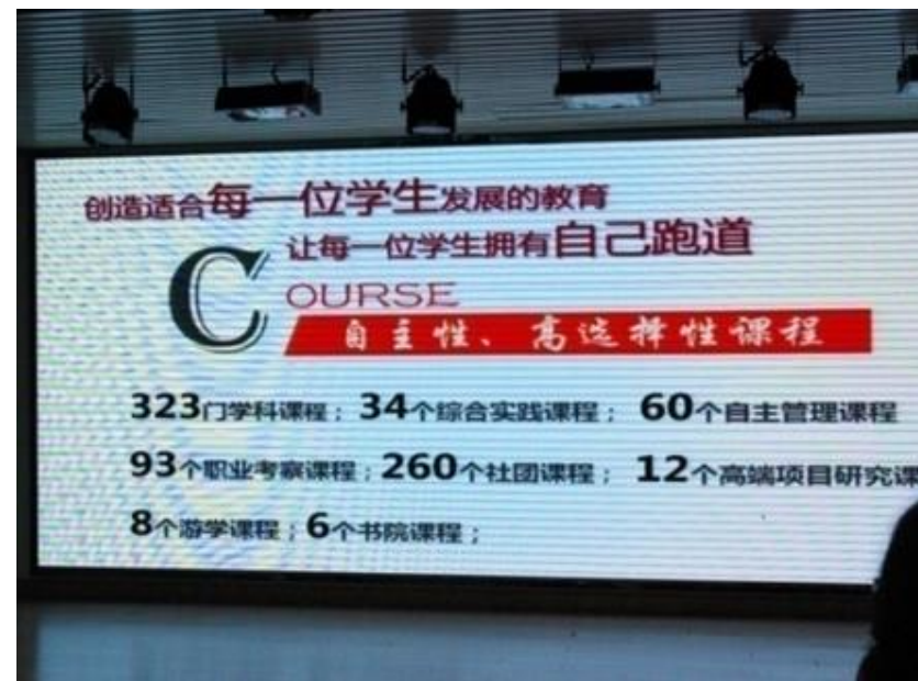
十一學校提供課程類型與總數