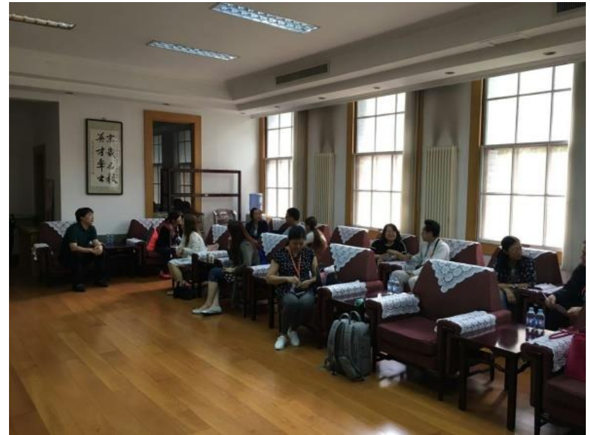
觀課後老師間的交流