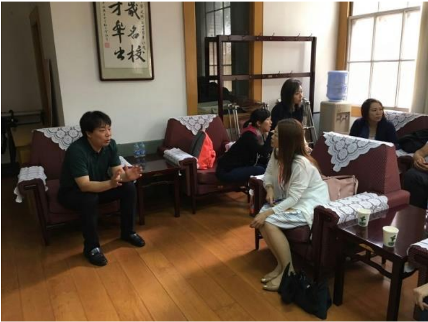
觀課後老師間的交流