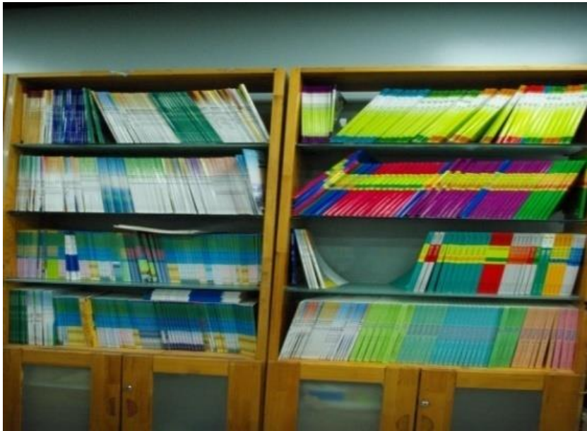
校園書局內販售教師自編課本