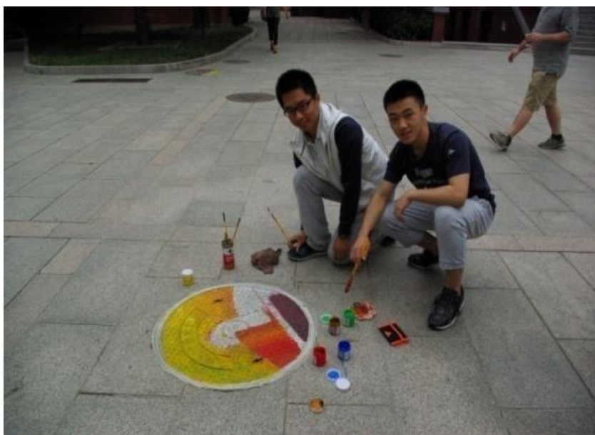
十一學校學生自主為學校彩繪