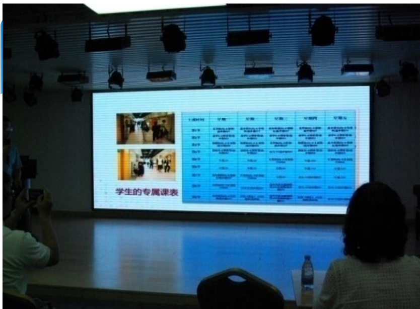
十一學校一生一課表