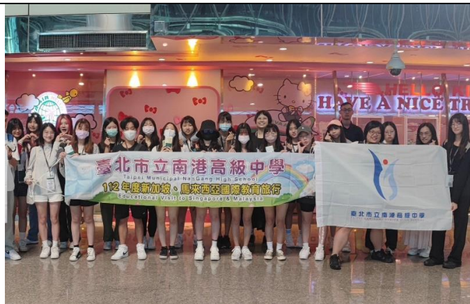
搭乘早班飛機準備前往新加坡

(六) 拜訪新加坡南洋初級學院、馬來西亞寬柔中學，建立互訪、課程交流的形式，維持深度交流之契機。