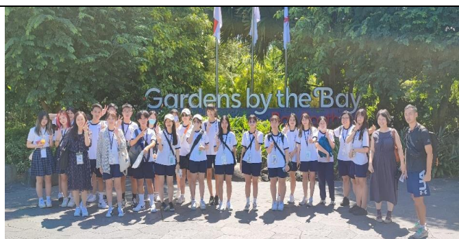
濱海灣花園擁許多種類的植物