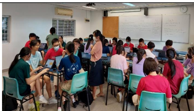
依據文組、理組科目，港中師生分散在不同班級入班全英語上課