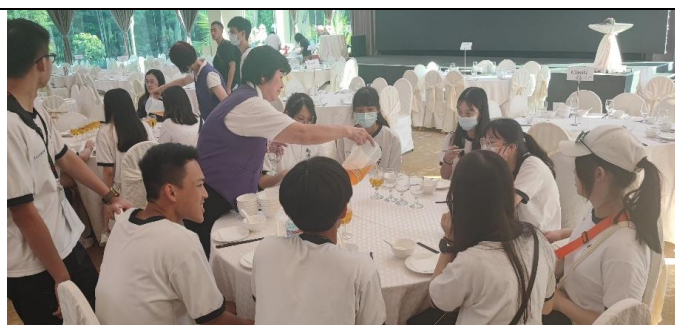
用餐環境明亮潔淨