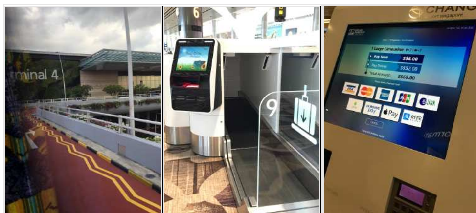
圖 2：新加坡樟宜機場第四航廈的自動化設施（行李托運、叫車系統）。自動化提升效率，樟宜機場以提供旅客順暢的轉機體驗、完善的機場設施為重要服務目標。