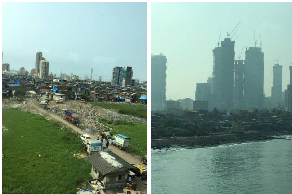
圖5：印度參訪，孟買一隅。北孟買高樓前的貧民區和垃圾場，資源回收是貧民區居民重要的收入來源；南孟買是金融商業中心，街道市容和北孟買的「亂」形成對比。