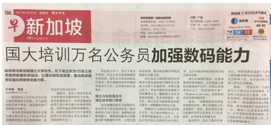
圖6：有關公務員數位學習新聞。

資訊的應用有其專業性，現行做法也傾向委託資訊專業協助，但針對一般員工建立一般性的資訊基礎概念以及理解資訊人員的思維，則有助於業務單位與資訊人員的溝通，打破資訊人與非資訊人的溝通障礙，對於想要透過資訊進行業務流程改造相當有助益。