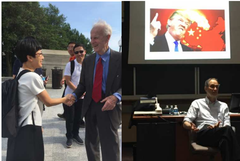
圖4：馬里蘭大學短期進修。前國會議員Dr. Moody帶領同學參訪國會山莊，以及Mark Feldstein講授「媒體在政府中起的作用」一課。

Management)、理解美國治理體系 (Politics, Process, and Stakeholders in the US Government)、美國的公共財政與公共預算 (Public Finance and Public Budgeting in the United States)、美國貿易政策與政治 (U.S. Trade Policy and Politics)、美國媒體對政府的作用 (The Role of the Media in Government )；並參訪美國國務院、國會、馬里蘭州政府、蘭德公司 (RAND Corporation)、馬里蘭州蒙哥馬利郡政府及洛克威爾市等。