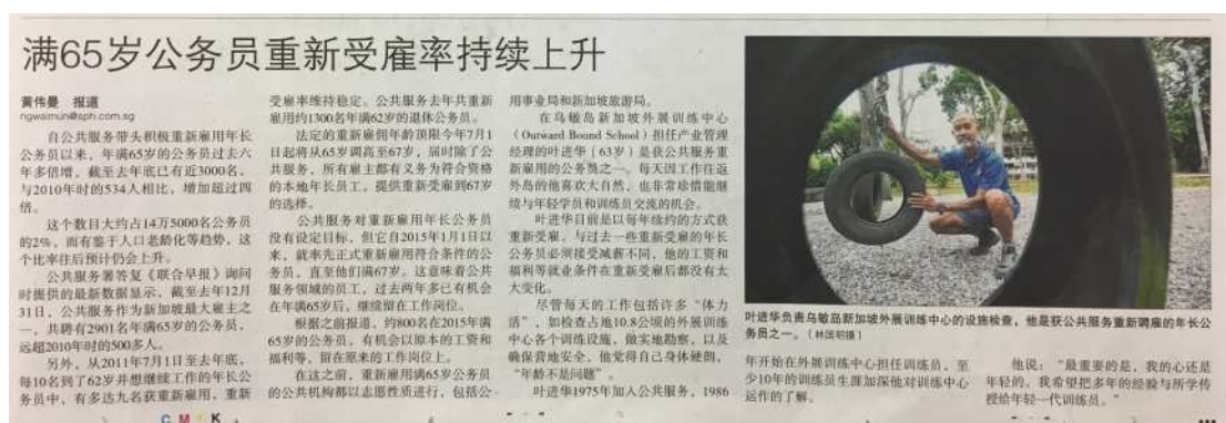
圖8：因應高齡少子化社會的勞動力政策，透過返聘計畫，重新擬定工作合約，讓高齡者仍然可在職場貢獻。

從臺灣的社會福利框架下檢視新加坡的工作福利，縱有值得商議之處，但細究其對於初老人力所設計的職場返聘計畫、延長退休年齡，以及鼓勵職場進用高齡者的種種措施，仍可作為臺灣社會面對高齡社會活躍老化之參考。