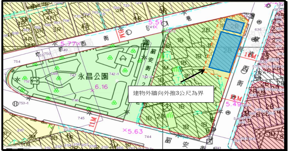
圖例： 歷史建築本體 定著土地範圍

歷史建築本體為寧波西街183、187、189、191、193號建築本體，建物為中正區永昌段三小段14（建物總面積198.34平方公尺）、15（建物總面積45.31平方公尺）建號，建築物坐落土地為中正區永昌段三小段742地號（土地面積383平方公尺，保存範圍臨建築線部分以建築線為界，其他建物外牆向外推3公尺為界）（實際保存面積須以保存範圍實測數據為準）