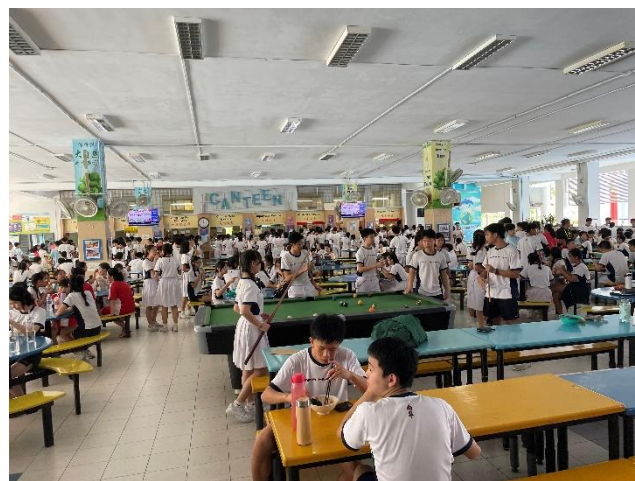
新加坡南華中學-食堂體驗多元飲食文化