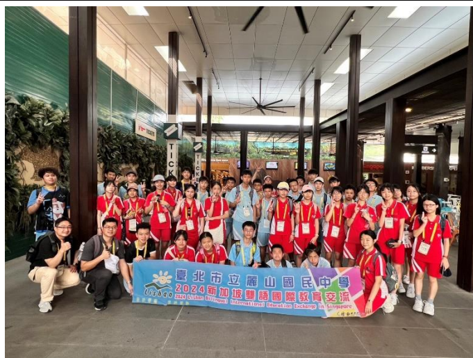
新加坡動物園~生態多樣性