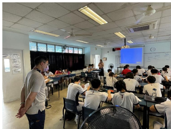
新加坡南華中學入班觀課-體驗全英教學課程