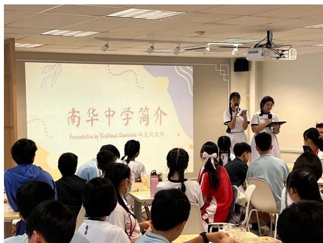
新加坡南華中學參訪校際交流