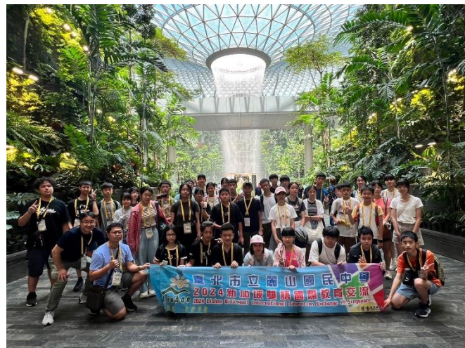
星耀樟宜-節能減碳建築工法