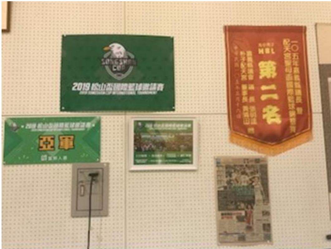
說明：明成高校體育館牆上的松山盃獎狀與松山2018年奪冠報導