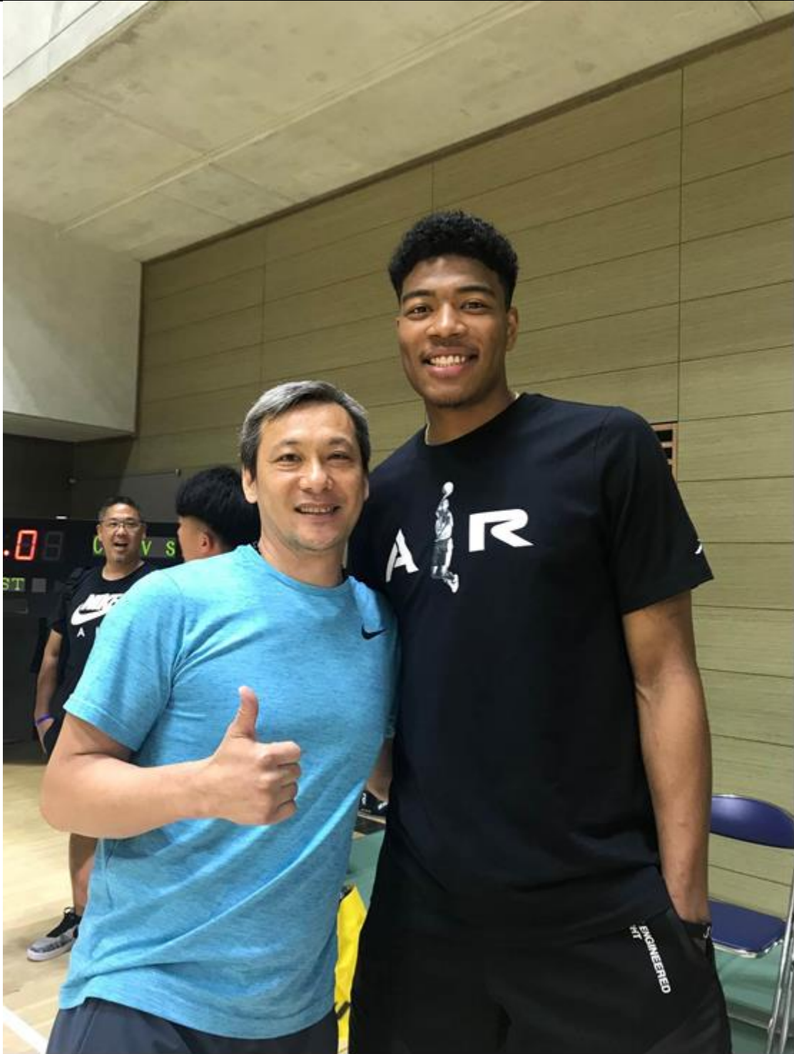
說明：NBA亞洲籃球無疆界訓練營與八村壘合照