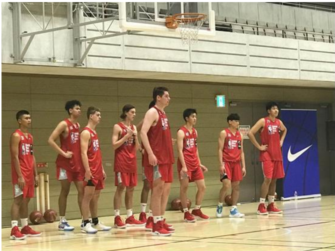
說明：NBA亞洲無疆界裡的澳洲與紐西蘭選手