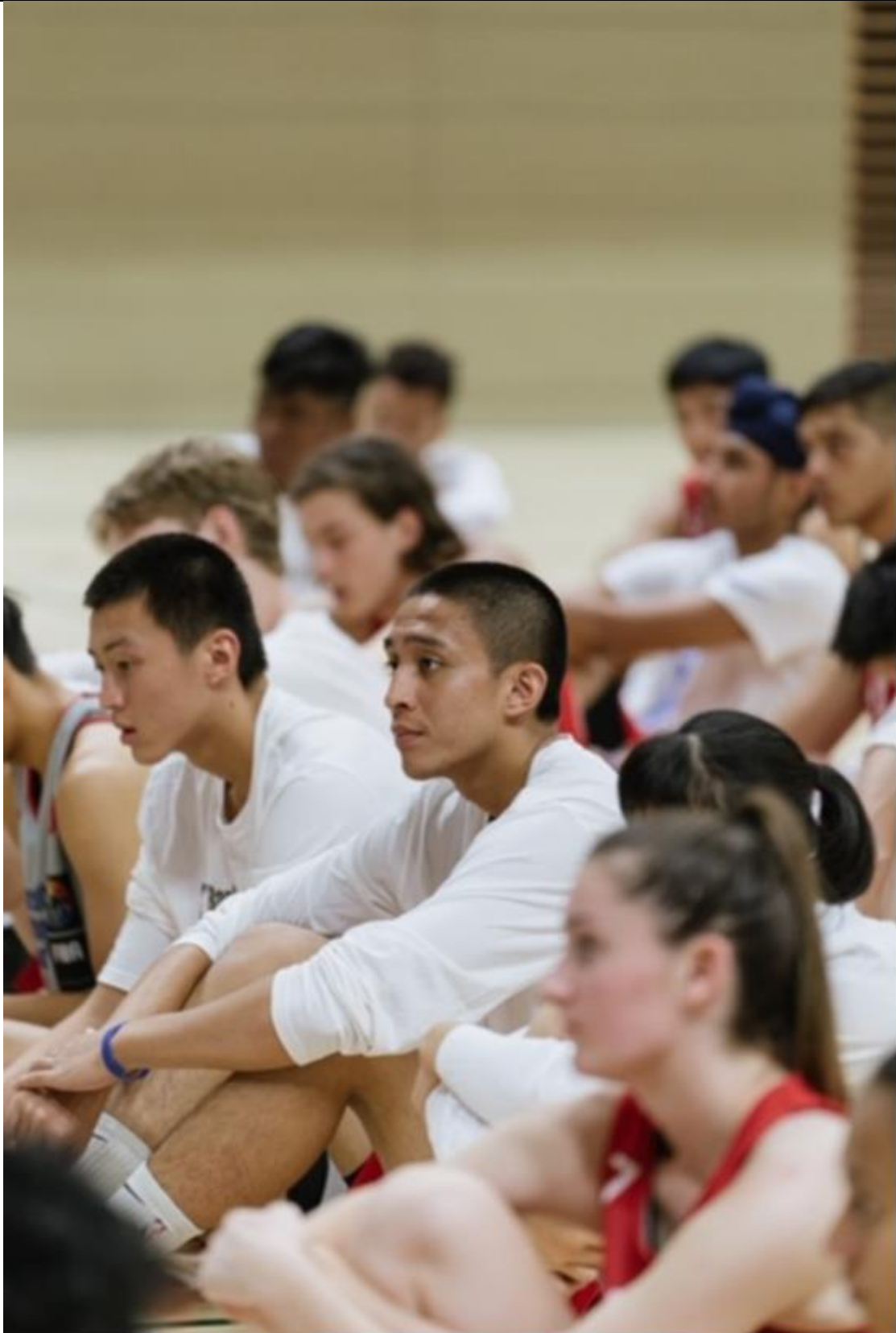
說明：本校球員許O翔（右）與尹O綸（左）獲選東京NBA亞洲籃球務疆界訓練營