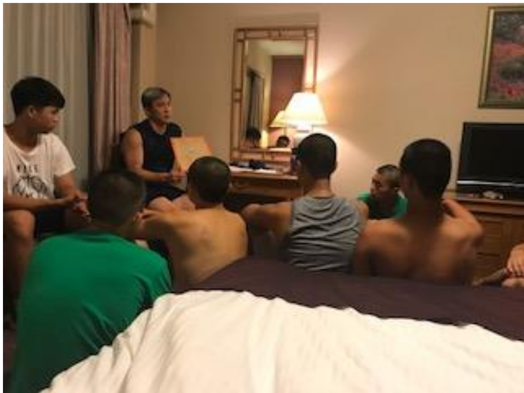
說明：每晚旅館房間內的籃球課程