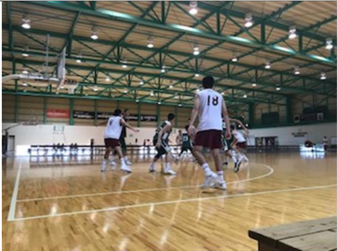
說明：松山高中對戰明成高校