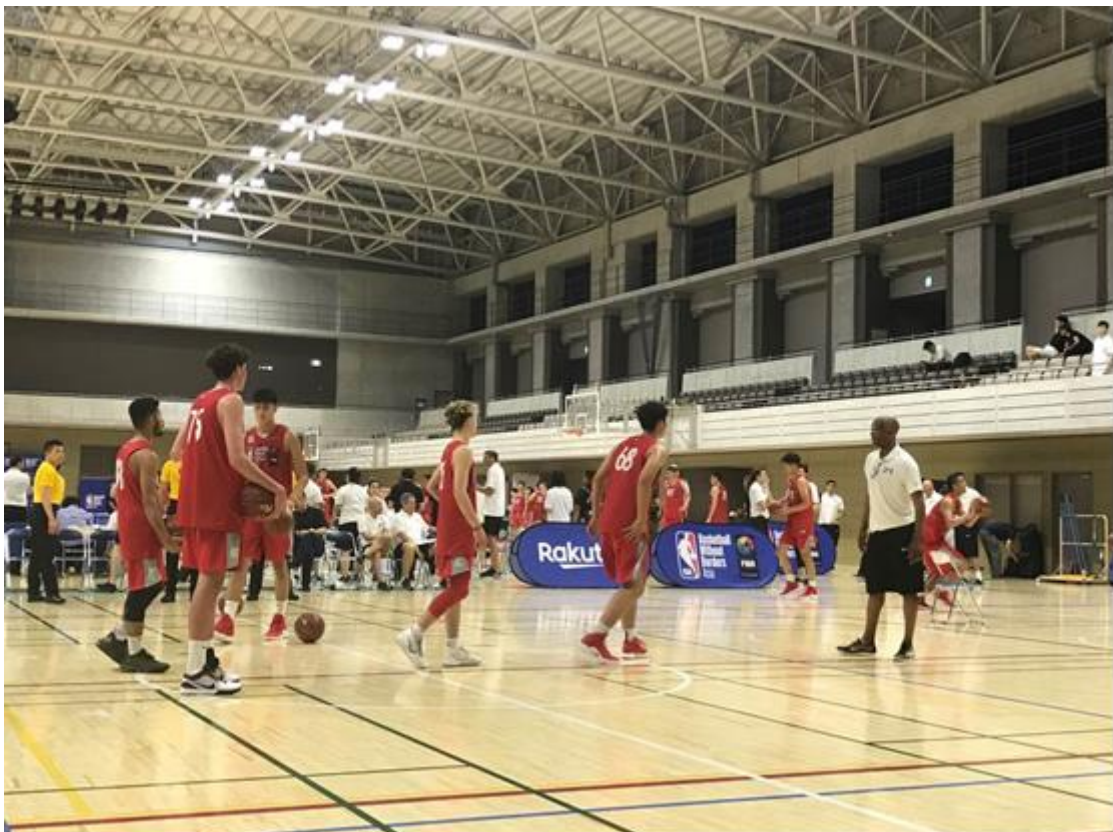
說明：東京NBA亞洲籃球無疆界訓練營