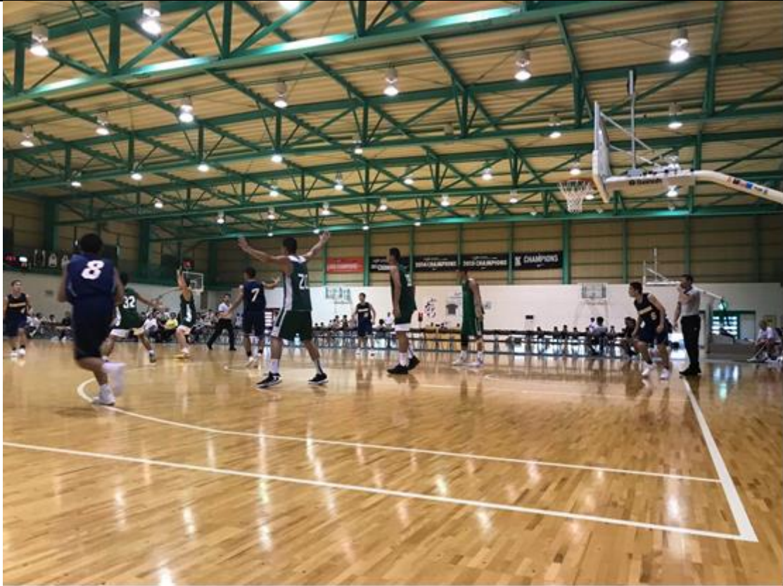
說明：明城高校體育館有兩座木頭地板的球場，設備令人羨慕