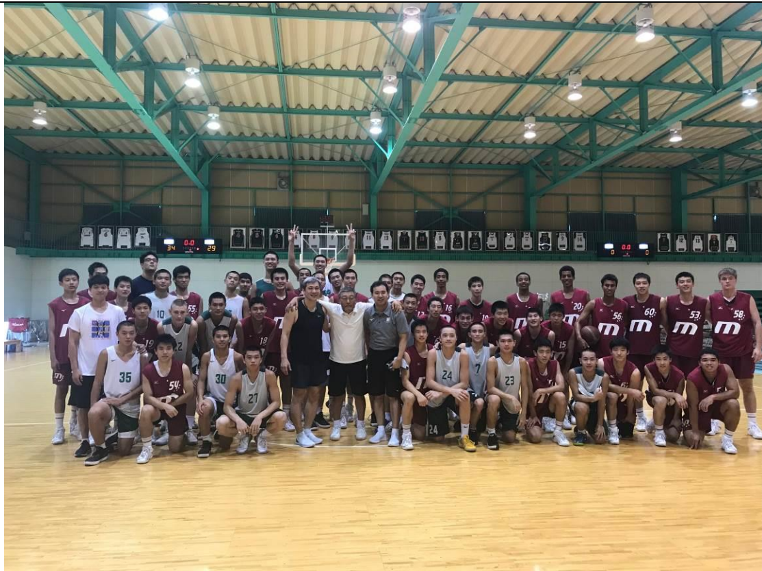
說明：明成高校與松山高中大合照