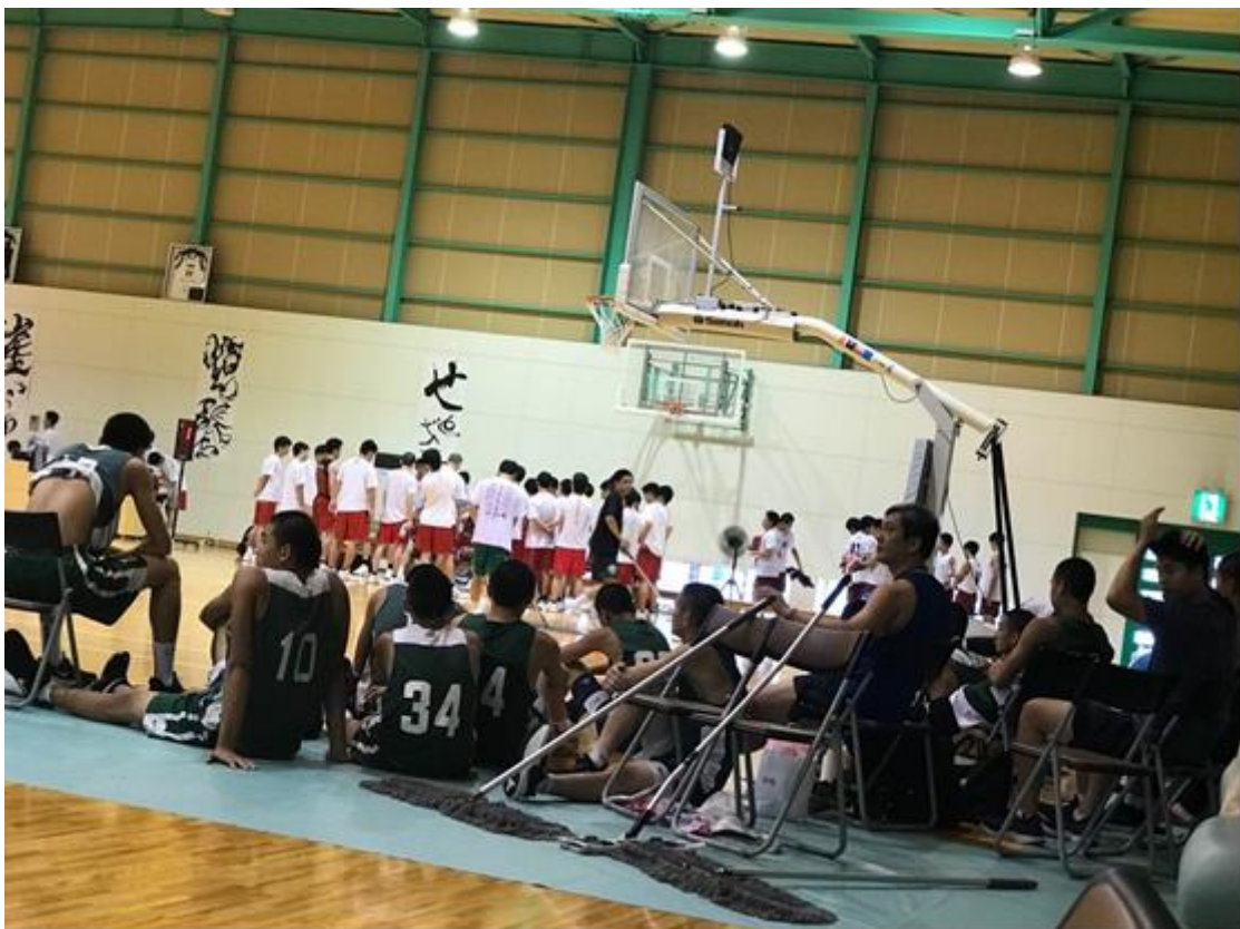
說明：比賽空檔，全隊一起觀摩其他隊的賽事