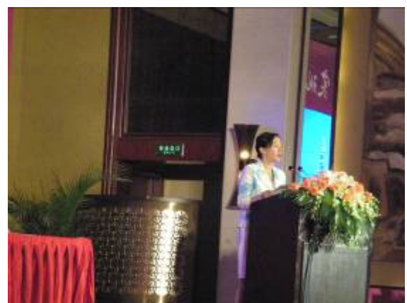
蘇州市政府盛雷副市長蒞臨臺北-蘇州產業合作推介會致詞