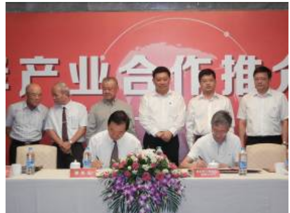
全國工業總會與鮮活果汁有限公司簽署合作意向書