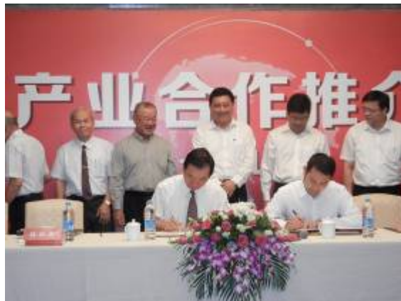
全國工業總會與好孩子集團有限公司簽署合作意向書