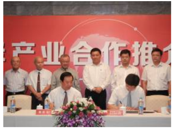
全國工業總會與昆山市三建模具有限公司簽署合作意向書