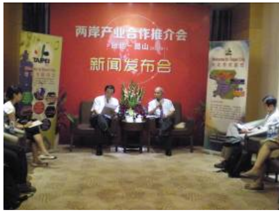
臺北-昆山產業合作推介會記者會