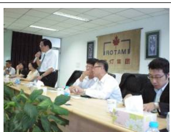
大豐港大宗物資輸送設施