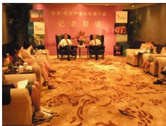
臺北-蘇州產業合作推介會記者會