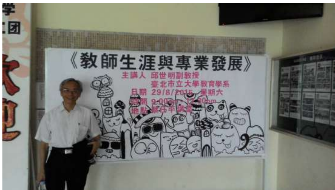
▲即將開始的教師生涯與專業發展講座準備教育狀態即將開始

為了更好的推動大馬華教與台灣之連結，此次不僅有與育才老師的交流講座—教師生涯與專業發展，更特別安排了與家長見面的親職講座，以期未來大馬的獨中華教，能夠與台灣的教育有更密切的交流與認識。