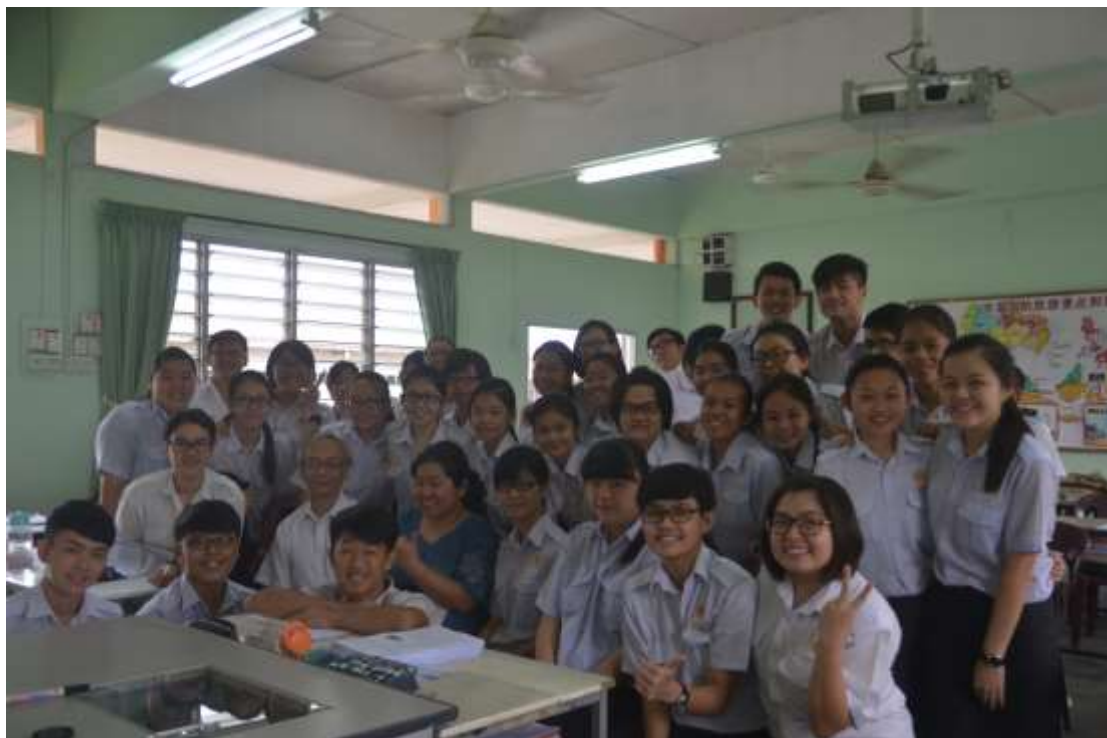
▲邱教授於勉勵後與高三文美班大合照

為了更好的推動大馬華教與台灣之連結，此次不僅有與育才老師的交流講座—教師生涯與專業發展，更特別安排了與家長見面的親職講座，以期未來大馬的獨中華教，能夠與台灣的教育有更密切的交流與認識。