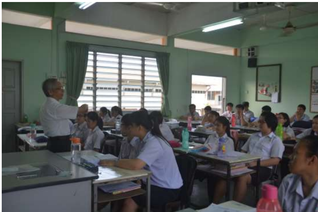
▲邱教授與高三文美班之勉勵分享

與育才獨中合作辦理營隊已到第三個年頭，依往例，安排邱世明教授與大馬教師進行交流，此次不僅為邱教授安排了兩場交流講座，考慮到大馬獨中學生大多有未來來台灣發展的趨勢，特為如今即將畢業的高三獨中學生，舉辦勉勵並分享台灣現今教育狀態之講座。