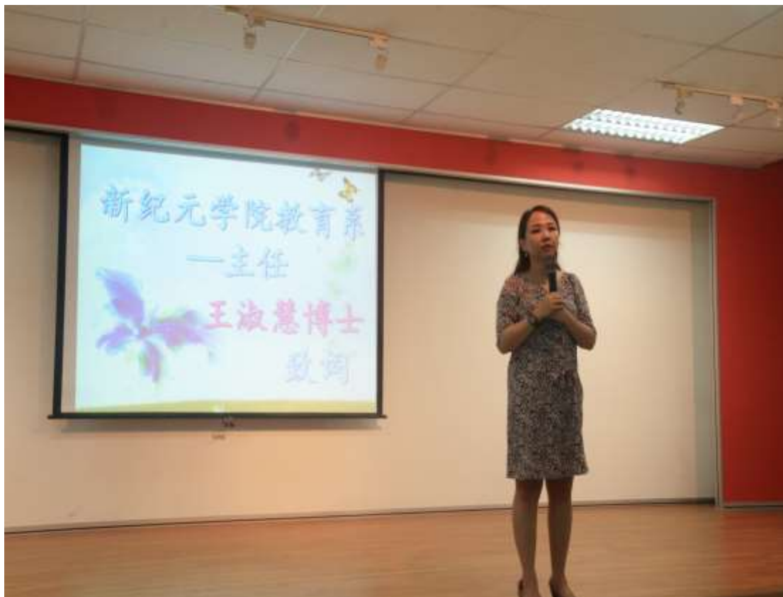
新紀元學院教育系系主任致詞。