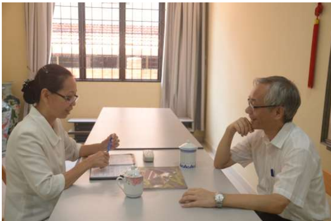
▲小型座談進行中：當地育幼院院長請教經營育幼院相關議題