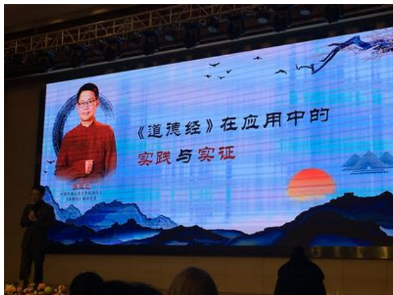
第二場講座張三愚:道德經在應用中的實踐與實證