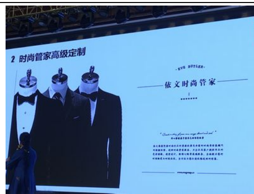
依文時尚管家高級訂製