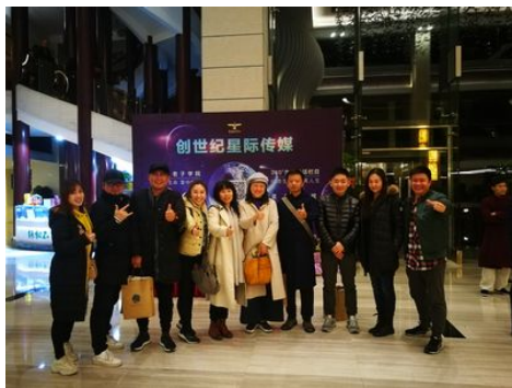
文創產業參加人員