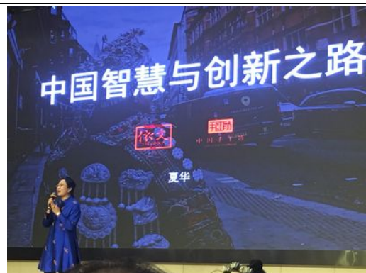
依文服裝品牌之崛起