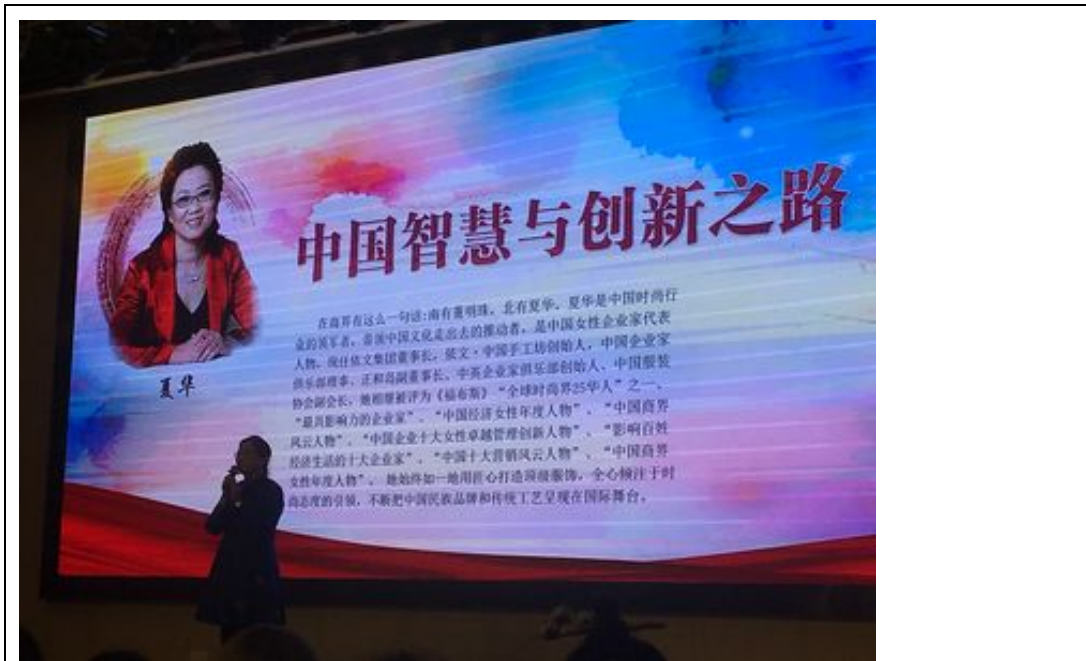
第一個講座演講人夏華:中國智慧與創新之路