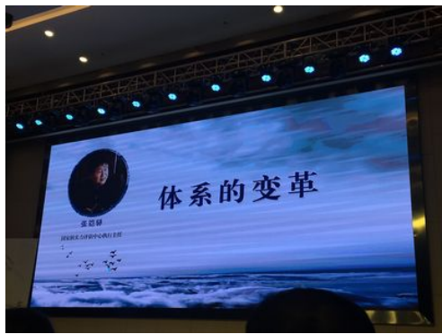
第二天講座邁向和平的道路