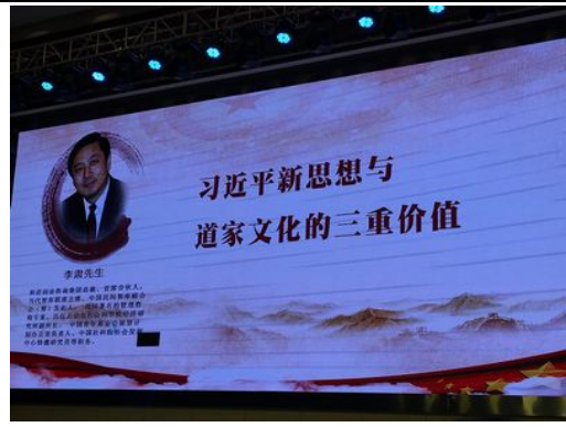
第二天講座邁向和平的道路