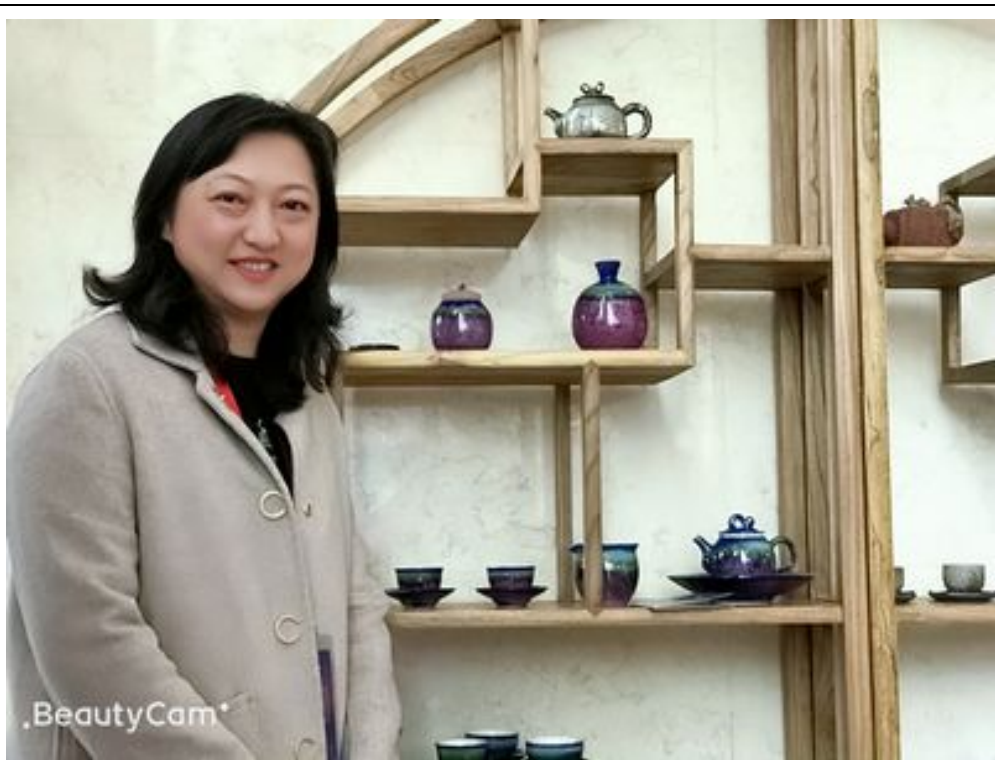
於大會會場一樓展出我的陶藝作品