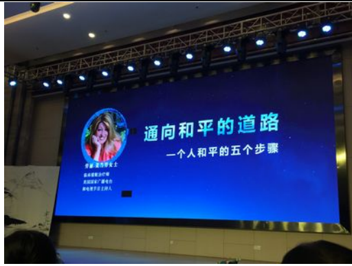
第二天講座邁向和平的道路