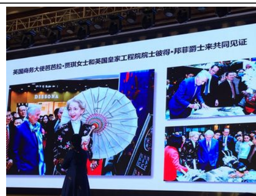
英國商務大臣的見證