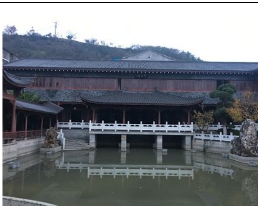
武當酒坊裡的文化會館