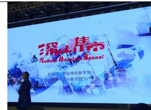
深山集市的創立構想