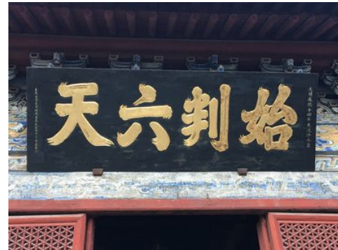
紫霄殿大門上方的三個牌匾都是臺灣各廟寺捐贈的