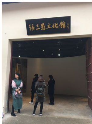
參觀張三愚文化館