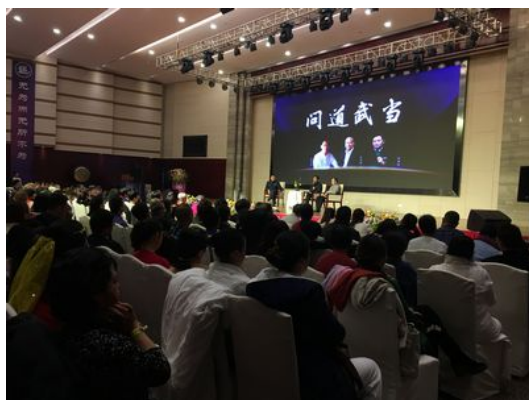
綜合座談:問道武當