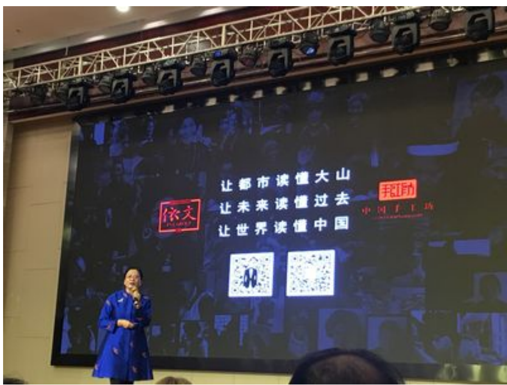
讓都市讀懂大山、讓未來讀懂過去、讓世界讀懂中國