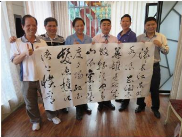
墨寶致贈宜賓三中