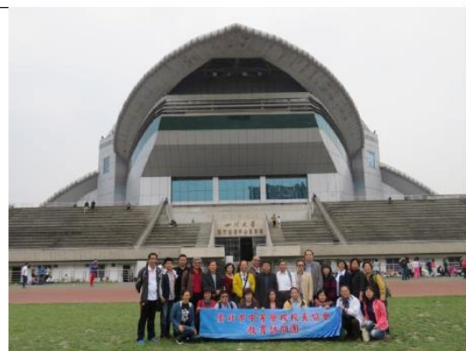
四川大學體育館、運動場