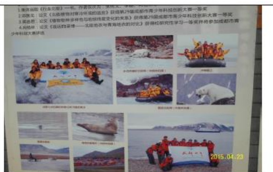
圖 40：七中學生全球視野活動