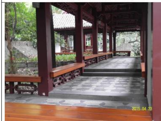
成都七中校園一隅