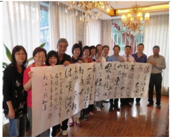
墨寶致贈宜賓三中