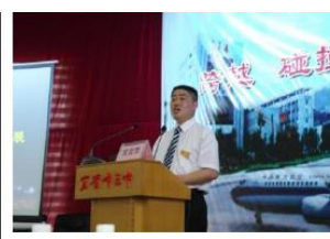
宜賓三中校長報告