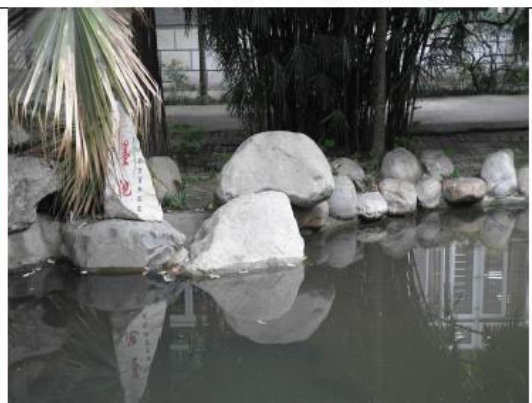
成都七中前身為清代墨池書院