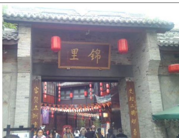
錦里一條街入口處

參訪武侯祠後,我們繼續驅車前往四川大熊貓基地,團員們都相當期待造訪這個「團團」與「圓圓」的故鄉。成都大熊貓繁育研究基地總佔地 1530 畝,於 1987 年建立,建立初期成都熊貓基地圈養從野外搶救的 6 隻大熊貓,然而至今日已成功地使大熊貓圈養種群數量增加到百餘隻,成為全球最大的圈養大熊貓人工繁殖種群。中國大陸在 1940 年代到 2000 年代向境外贈送或租借大熊貓藉以增進友好關係,此種透過大熊貓進行柔性的獨特外交模式有「熊貓外交」之稱,除臺灣外,俄羅斯、北韓、美國、法國、英國、日本、墨西哥、西班牙與德國也都曾有接待過來自四川成都的「嬌客」呢!四川的大熊貓基地,有別於臺北市立動物園,百餘隻的大熊貓沒有隔在玻璃帷幕中,而是開放式的圈養著,當地相當重視生態保育,走在園區中就能「感受自然」,大熊貓與人幾乎零距離的接觸。因為下午的氣候較為炎熱,熊貓大多躲在涼爽的房屋中不願意出來,但是能夠看到熊貓媽媽和寶寶母嬰同室活動,也是相當令人興奮,是非常特別的體驗。