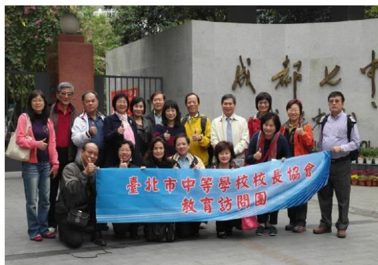
訪問團於成都七中校門前合影

體更加積極、整體更為和諧、個體顯現特長。」該校在 2000 年被四川省教育廳評定為國家級示範性普通高中，同年被中國大陸教育部確定為國家級示範性高中建設項目樣板學校。