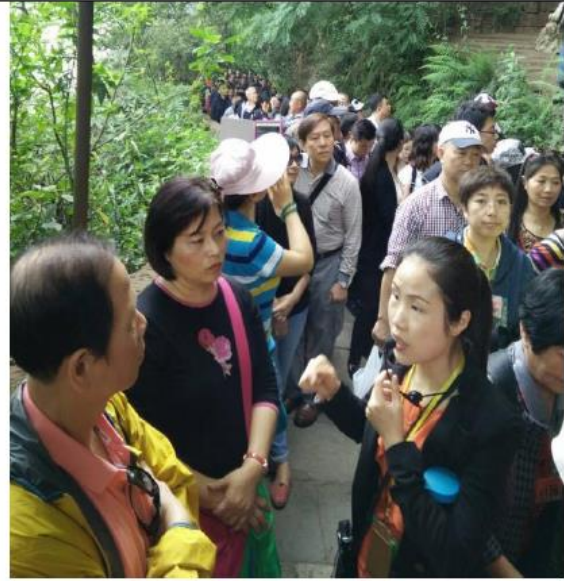
沿路遊客如織、解說員認真說明