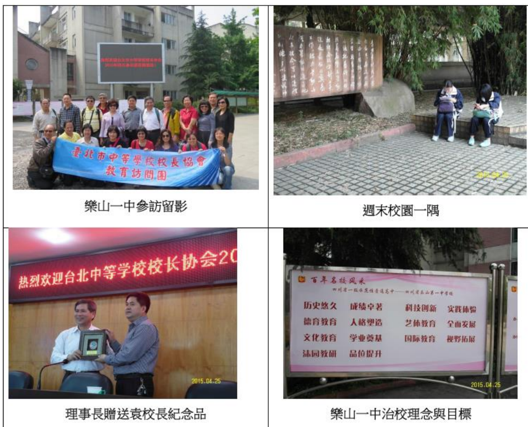
樂山一中參訪留影

除了升學績效優異之外，樂山一中也是四川省藝術教育特色學校，每年 4 月學校舉辦藝術節，展現學生各項藝術創作與活力表現；體育方面，籃球、足球也是近年推動重點；機器人競賽也在全省獲獎，得獎作品能夠有向全國展示的資格。這些活動在高度的升學壓力之下，也讓身心有一個調整的方向。