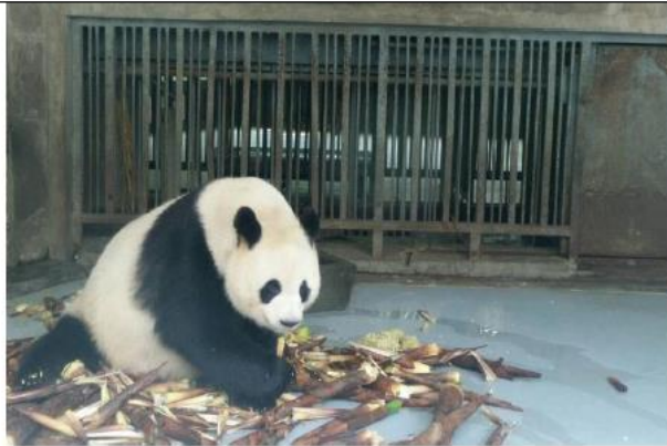
大熊貓大快朵頤的享受餐點