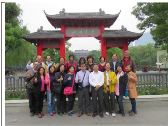
四川大學校園留影

四川大學體育學院擁有一流的體育教育與娛樂資源。學校現有多功能體育館 2 座，標準田徑場 4 座，足球場 9 座，籃球場 50 餘座，排球場 20 餘座，游泳池 3 座…等等, 提供教學與學生活動使用。校園巡禮後,唯一的想法就是「好大」的校園,「好大」的大學城,體育學院負責提供四川大學三萬多學生的身心健康規劃,真的不是一件容易的事。