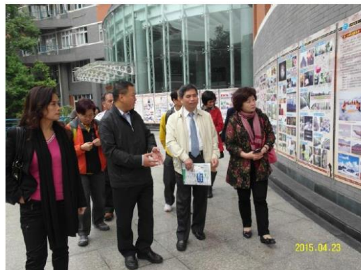
成都七中建校 110 週年介紹