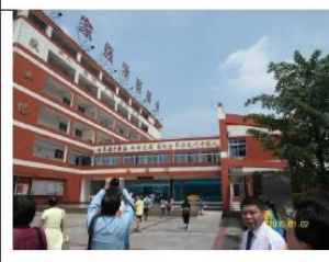
國家級示範高中-宜賓三中