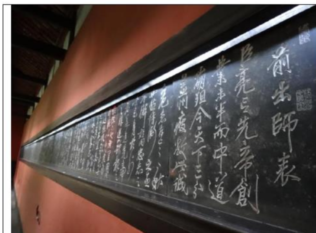
岳飛親筆所抄寫之「前出師表」真跡

我們踏出武侯祠的後門，來到了「錦里」，這個毗鄰武侯祠的古街，頗有古蜀國民風。傳說中錦里曾是西蜀歷史上最古老、最具有商業氣息的街道之一，早在秦漢、三國時期便聞名全國。錦里一條街，今日仍保有過去古街的樣貌，但也有融合現代的產業，例如我們在古街中看到了熟悉的「Starbucks 星巴克咖啡」，咖啡館的外觀為古城的樣貌，裡面的桌椅與擺設也是古色古香，不失為中西合璧後錦里獨有的一大特色。