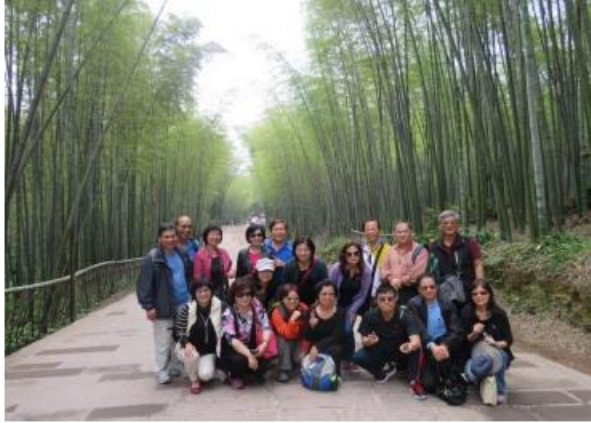
蜀南竹海-綠竹長廊