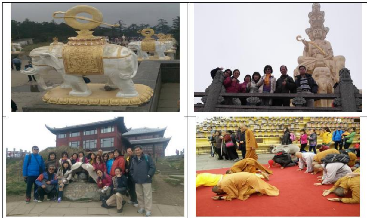
峨眉風景:金頂大佛、普賢菩薩座騎、信眾參拜、靈龜石合影

遊覽車換搭接駁小巴至雷洞坪，步行至接引殿，搭乘索道(纜車)直上金頂，峨眉山金頂的索道又叫觀光列車，一次可容納一百多人，有點無法想像一輛纜車可以搭載 100 位乘客，它的安全性……想必是很好才是!安全地下了索道還要再步行約 40 分才能到金頂區。沿途看到許多猴子，毫不害怕地與人類分食，倒是有些遊客嚇得哇哇大叫，花容失色；金頂區的氣溫低，還有些雲霧，我們的運氣不錯，能見度還算好，雖有雨霧，但仍可以欣賞到峨眉的山間美景。由於 4 月 29 日有法會儀式，所以到山上參拜的人相當多，可見到善男信女沿著華藏寺外紅毯跪拜祈願，寺裡供奉普賢菩薩，參觀金殿、銀殿、銅殿後，站立在霧中的金頂之上，雖然看不到小說中的武林高手、高僧，但能夠有機會參拜中國四大佛教聖地之一，也是一場洗滌心靈的神聖之旅。