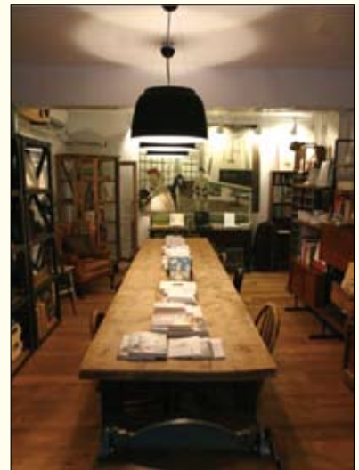
▲ VVG Something好樣本事

中的每一環節帶給人們美好感受的驚喜。走到建國南路一段的 四一玩作 ，從發展品牌設計家具開始，將中國的傳統手工技法融合現代優點，致力創造以人為本的時尚工藝。而位在西區的 luguo café 爐鍋咖啡@小藝埕 ，於迪化街成立小藝埕分店，充滿文藝氣息，與周遭濃郁的人文氛圍形成動人的畫面。