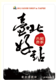
▲ 臺北好站的認證標章圖

為鼓勵臺北市的店家重視創意設計或引入獨特的風格美感，從「商品服務」、「空間營造」、「品牌特色」及「經營管理」評比面向，由市府評選優質店家授予「臺北好站」認證，每年都會將這些標竿示範店家推廣給社會大眾，讓民眾體驗更多生活美學，豐富臺北市新生活設計地圖。