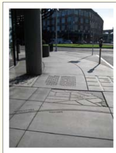
▲ 2012臺北設計獎入圍作品——會說話的城市

為蓄積臺北市爭取「2016世界設計之都」更多能量，2012臺北設計獎，競賽類別除原來的「工業設計類」，新增「視覺傳達設計類」及「公共空間設計類」獎項。報名參賽作品高達1,899件，較去年成長約21%，目前已有57件作品入圍決選。呼應「彼此YOU I」主題，入圍作品皆強調了設計是可以實際