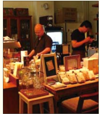
▲ luguo café 爐鍋咖啡@小藝埕

中的每一環節帶給人們美好感受的驚喜。走到建國南路一段的 四一玩作 ，從發展品牌設計家具開始，將中國的傳統手工技法融合現代優點，致力創造以人為本的時尚工藝。而位在西區的 luguo café 爐鍋咖啡@小藝埕 ，於迪化街成立小藝埕分店，充滿文藝氣息，與周遭濃郁的人文氛圍形成動人的畫面。