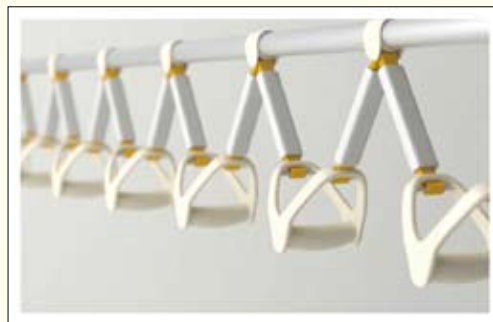
▲ 2012臺北設計獎入圍作品——拉你兩把

業設計獎學生類組銅獎之肯定。而歷屆工設獎得獎作品商機媒合成果已創造約491.6萬餘元營業額，有助活絡設計產業發展及創造設計產業良性競爭環境。