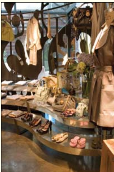
▲ FiFi's Market 菲菲流行倉庫