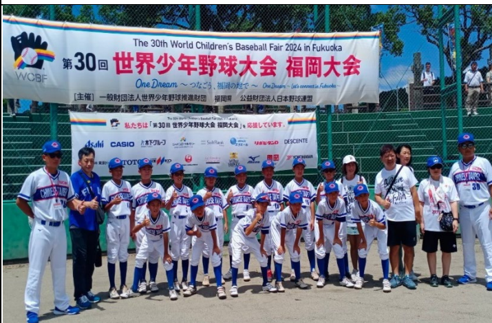
教職員與教練球員選手在球場合照