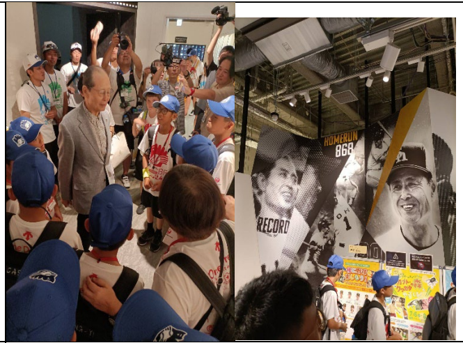
參觀王貞治棒求紀念館並與王貞治合照