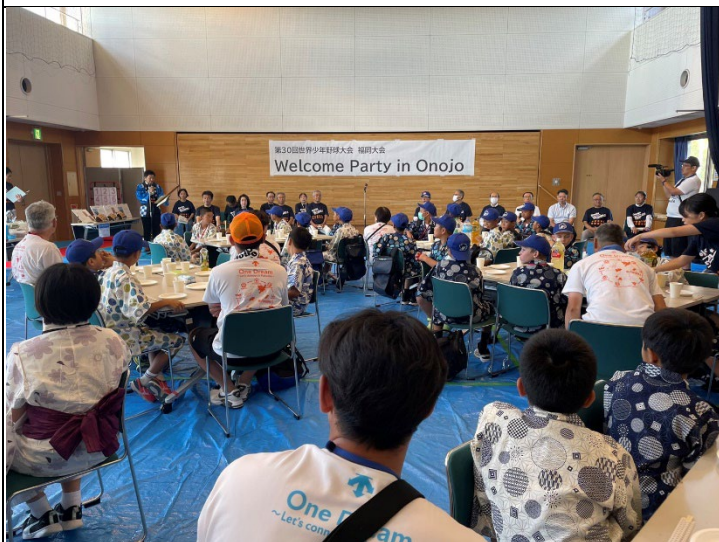
參觀大野城遺跡，室內觀光