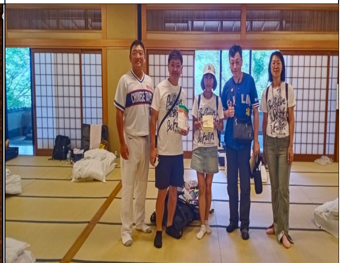
教職員慰問教練辛勞贈與禮品與教練合照