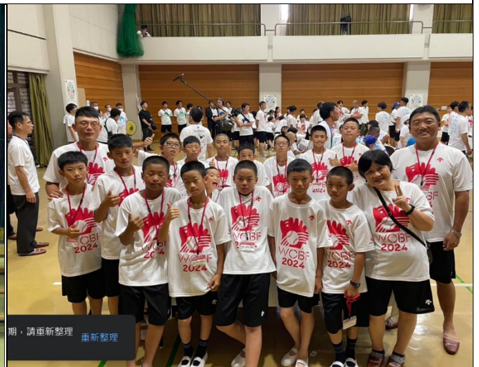
開幕式教練球員們合照