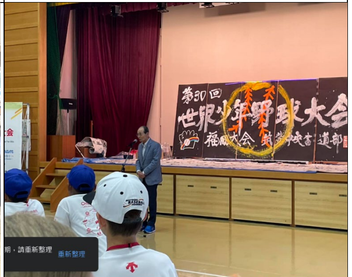
歡送晚會王貞治勉勵球員