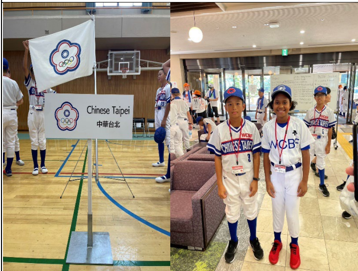
開幕式中華臺北隊旗，球員並與其他隊伍球員合照