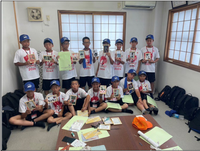
大會安排球員日本茶體驗後成果照