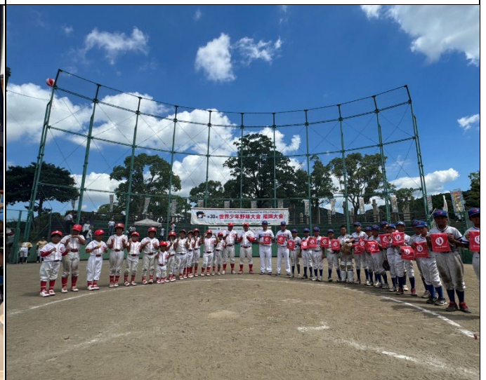
與大野城少年野球隊賽後交換紀念品並合照留念