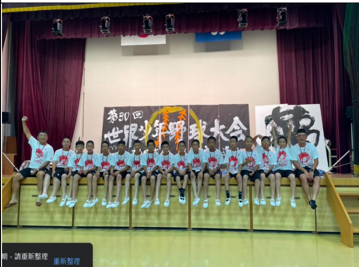
選手及教練在野球大會晚會後合影