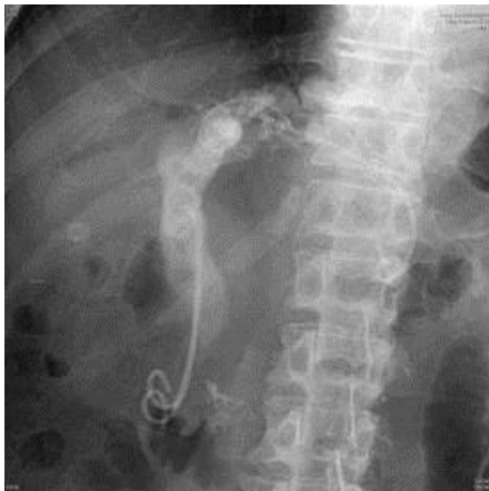
圖四、兩條ERBD置放於總膽管引流膽汁

和上述ENBD類似，但為內引流，身體外觀看不出有任何管路。以ERCP的方式將塑膠支架推入總膽管或是左右兩側的肝內膽管，使膽汁越過狹窄阻塞處，引流至十二指腸。有不同長度以及不同尺寸大小，根據病患膽道狹窄的位置以及阻塞的長度決定需要置放何種支架。這種塑膠支架引流其實是ERCP治療的大宗，健保也有給付，只要任何一處的膽管有狹窄或是阻塞，就可以置放，減緩病患的黃疸。遇到特殊情況，沒有符合條件的現成支架，東大醫師也會將現有的支架拿來調整，擷取適合的長度或者將兩旁的瓣膜削去，或者用熱水壺高溫將塑膠管燙彎固定，客製化手工製作，令人印象深刻。