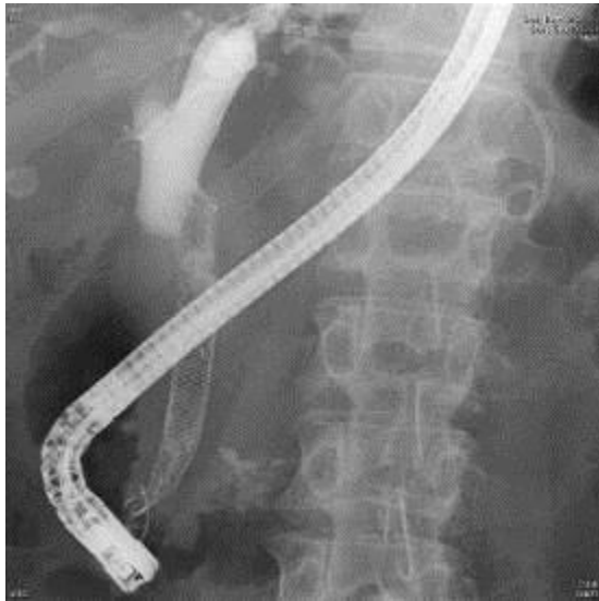
圖五、移除總膽管內之金屬支架

(uncovered)等不同種類。東大用的多為全瓣膜型，因其有機會移除，且腫瘤往內生長(in-growth)的機率較低。