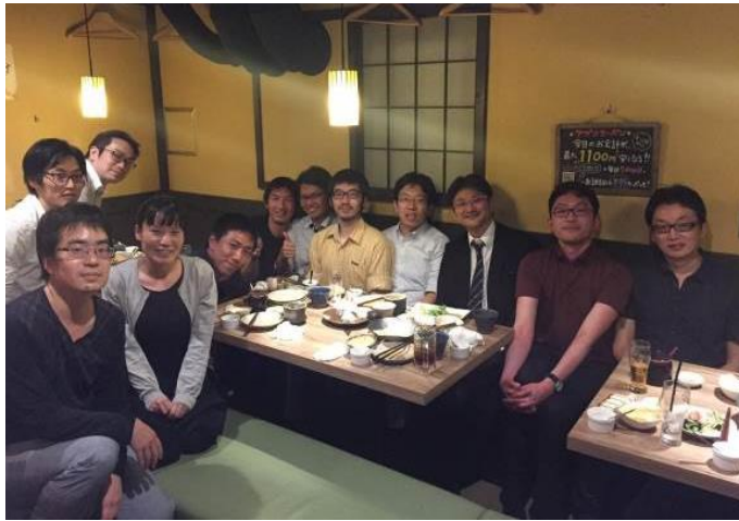
圖十八、筆者的歡送會