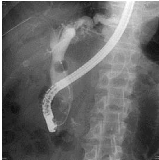
圖二、使用取石氣球清除總膽管內之結石/膽泥

將結石移出膽管的方法，除了金屬網籃之外，也可以用取石氣球將結石或者膽泥/膽沙刮除乾淨。或者，更常見的方式是兩者併行，在金屬網籃之後接著使用取石氣球導管。不但可以將石頭帶出膽道之外，同時更可以注射顯影劑確認還有沒有剩餘的石頭在膽管內。取石氣球有分不同大小，9-12mm、12-15mm、15-18mm等不同直徑，也有分顯影劑是從氣球之上(above type)或氣球之下(below type)顯影，東大較常使用的是above type，臺北榮總則較常使用below type。