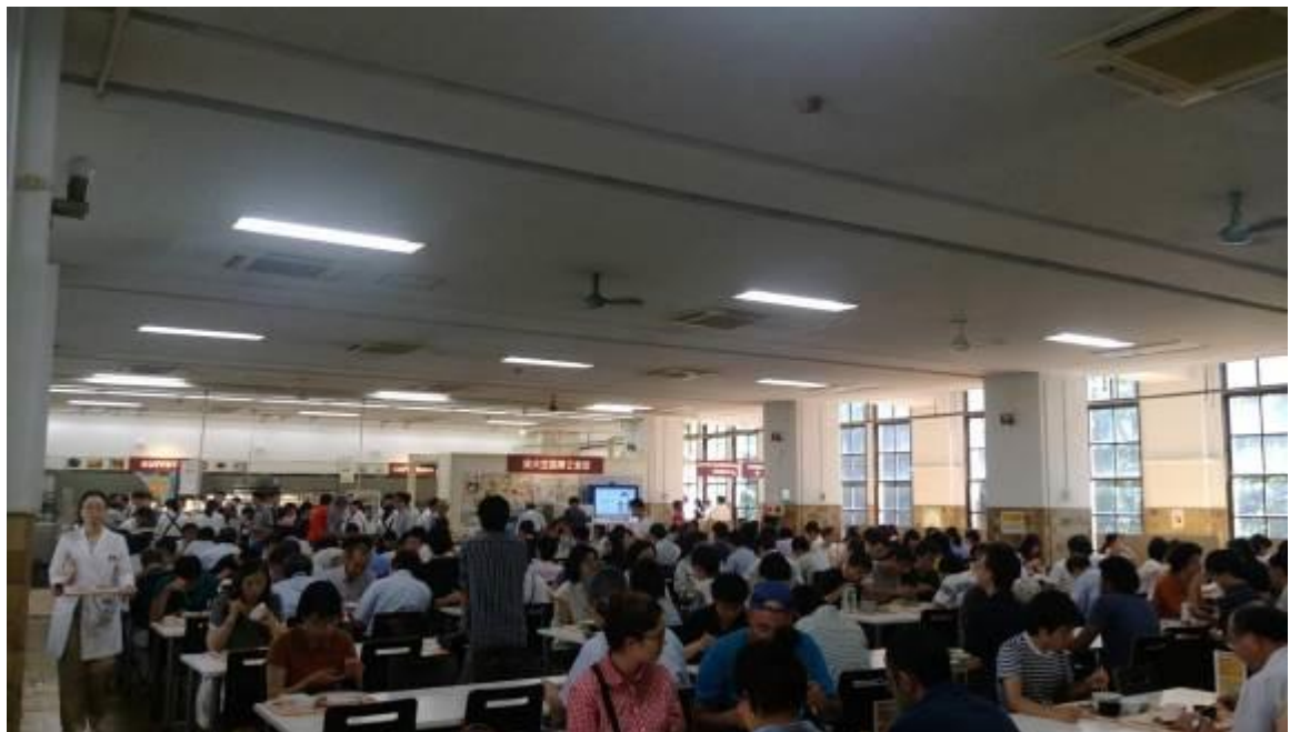
圖二十二、東大校園學生食堂