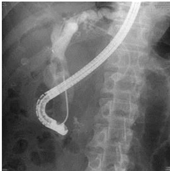
圖一、使用金屬網籃清除總膽管內之結石/膽泥

金屬網籃用於將石頭固定，並將之夾出膽胰管之外。東大貴為醫學中心，所有的器械應有盡有，就算同一種耗材也有許多不同尺寸備用。光是金屬網籃就有多重選擇，有四網的、花狀的、可穿導絲的等等。