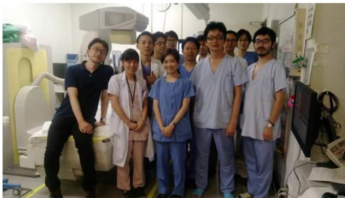
圖十七、歡送泰國醫師合照