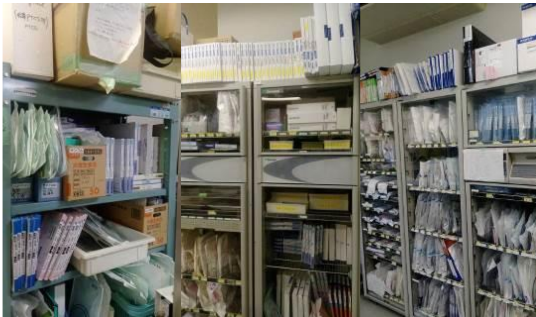
圖十九、檢查室琳瑯滿目的器械