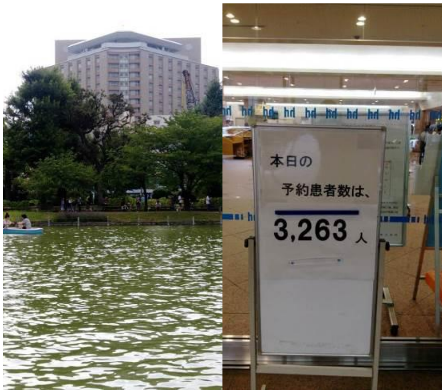
圖十二、東大病院外觀