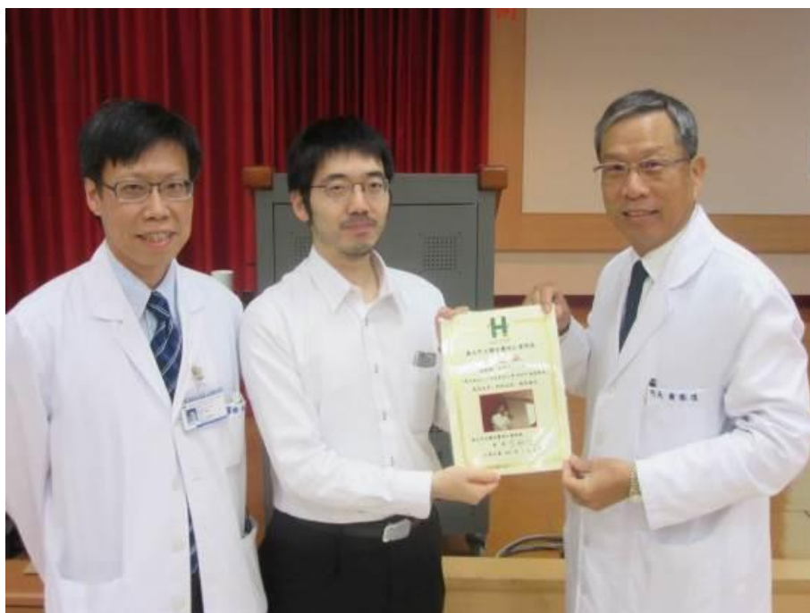
圖九、院長頒發感謝狀