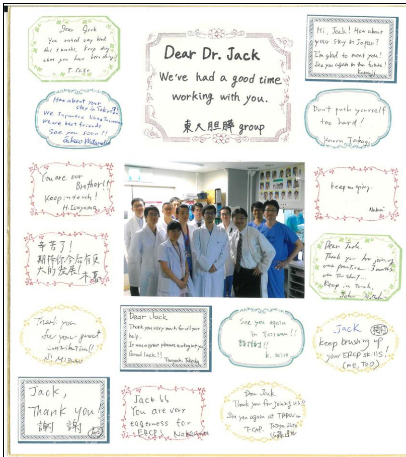
圖十一、東大同仁贈送之感謝函