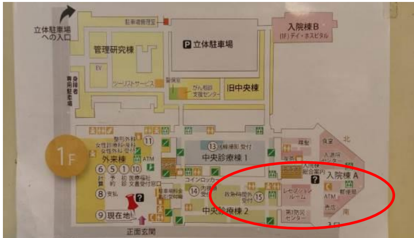
圖二十一、東大病院地圖