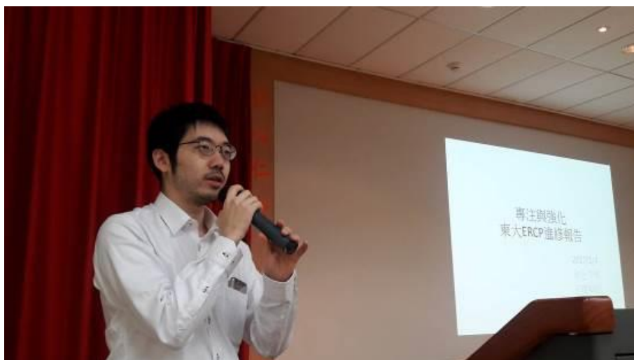
圖八、院內分享報告