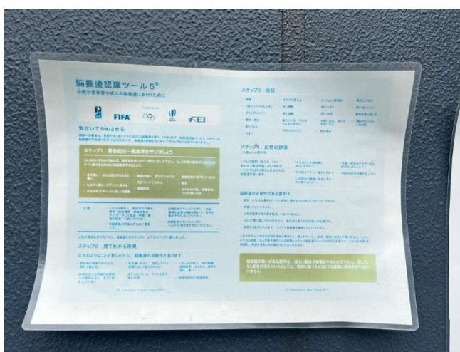
圖二 腦震盪評估表徵示意圖