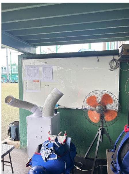
圖三 日本球場皆具備風扇及水冷扇等降溫設備