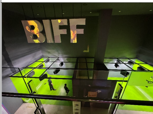
釜山電影體驗館綠幕拍攝體驗