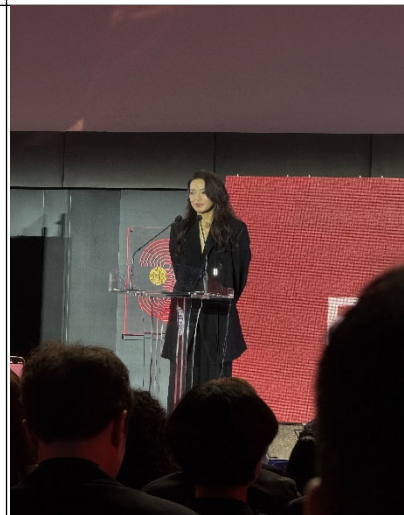
舒淇獲得最佳導演