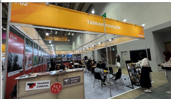
文化部影視局/文策院 台灣館