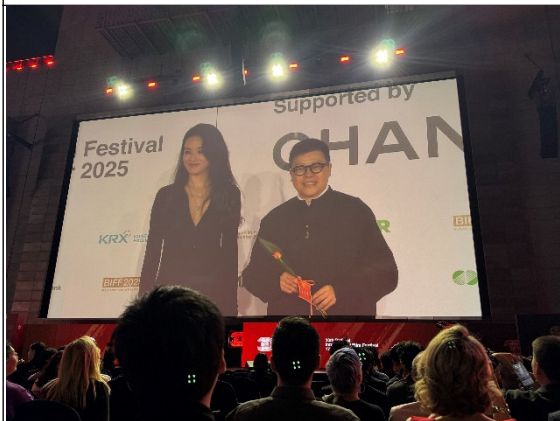
《女孩》舒淇導演(左)、葉如芬監製(右)走紅毯