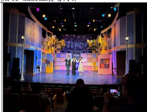
大學路音樂劇演出