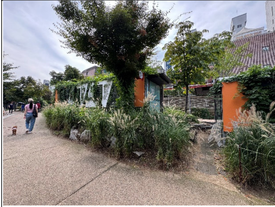
弘大京義線書街藝術家工作室