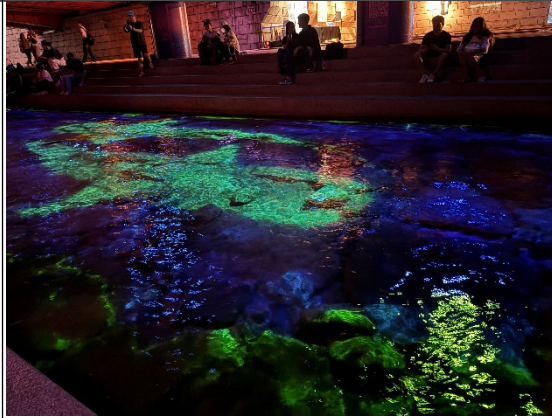
首爾清溪川光影展演