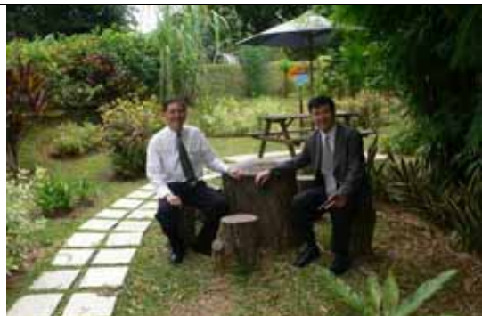
院區內枯死老木，創意巧思把枯木化作八仙桌