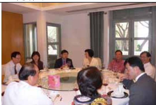
我國立法委員羅世雄夫婦訪問新加坡，亦共同用餐