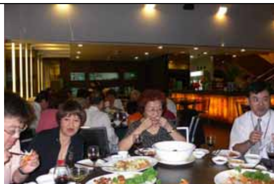
吃、吃、吃，能吃就是福