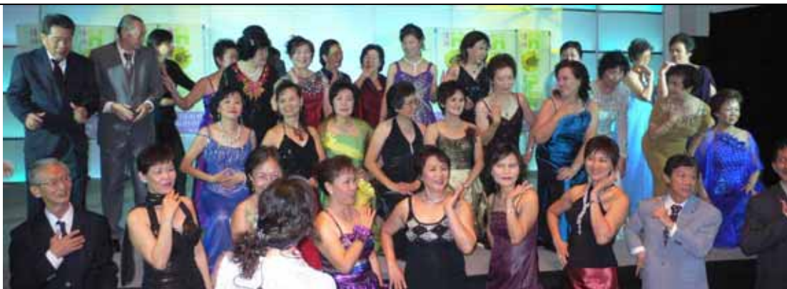
個案康復就是志工，志工們快樂地享受生活，樂齡樂齡，樂享高齡