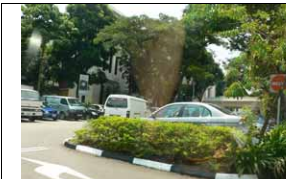
亞歷珊卓醫院，六年前一片荒蕪，如今門口綠意盎然

Alexandra Hospital 建於 1938 年，是一家擁有 400 床的一般急性照護醫院，原本經營不善，瀕臨關閉，經現任院長（在新加坡稱為執行長—CEO）於 2000 年 10 月 1 日重建，成為煥然一新的區域醫院，以病人為中心的並成為 National Healthcare Group 的一員。參訪當日院長親自接待並向訪問人員說明該起死回生的經歷，由照片中可看出該院的用心，利用創意的巧思將醫院營造為一個十分溫馨的大家庭。