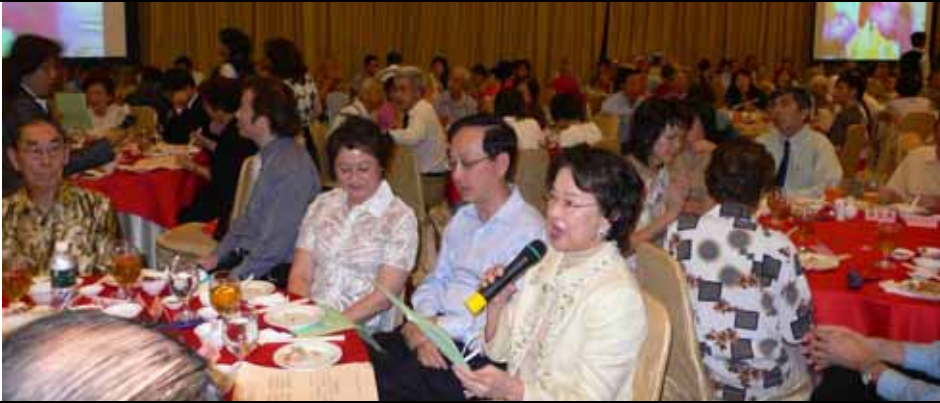
結業典禮，參加人數眾多