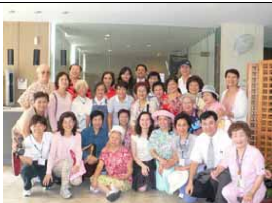
與同來助陣參加新加坡第三屆志工結業典禮的台灣志工合影