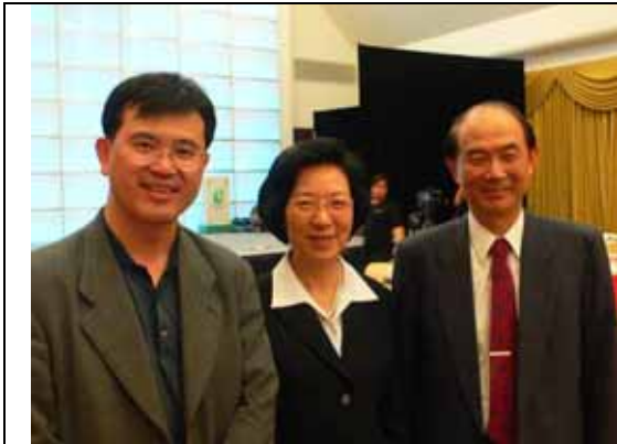
開演前與駐新加坡代表胡為真伉儷合影

新加坡傳神志工協會依據台灣經驗，在新加坡培訓樂齡志工，並每年辦理結業成果發表，給予志工莫大榮耀。此次結業典禮之地點為新加坡國家之「公務人員訓練中心」，地點十分幽美宜人，令人羨慕新加坡公務人員之待遇。志工表演除了餐會——老人活動的重心：吃得好，也有精彩的表演，由新加坡、台灣、馬來西亞的志工合作擔綱演出——這也是老人照顧的一大重心：玩得快樂。活動中，看到銀髮志工精彩的演出與受服務個案由孤獨與失能中站立起來，令人感動。本局創辦天使人力志工銀行，但是新加坡的老人志工活動，顯然已經把台灣的模式發揚得淋漓盡致。台灣應該更加努力了。