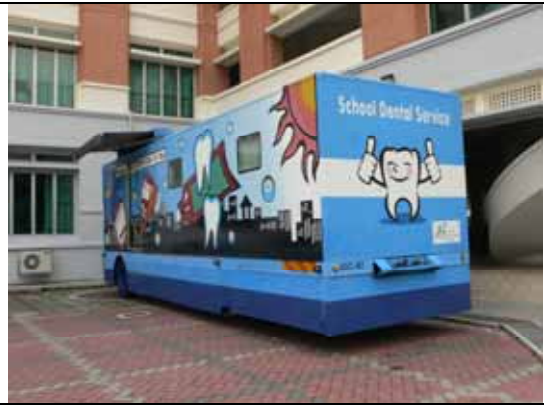
校園內的牙科診療車