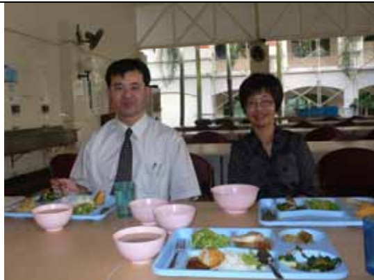
與麥校長在學生宿舍區共進晚餐