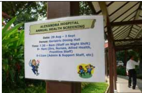
院內同仁每年健康檢查——有健康的員工，才有健康的醫院