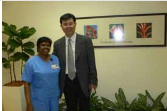
與急診室護理人員合影，背景是急診室一角，溫馨豐富，無一般急診室之貧乏