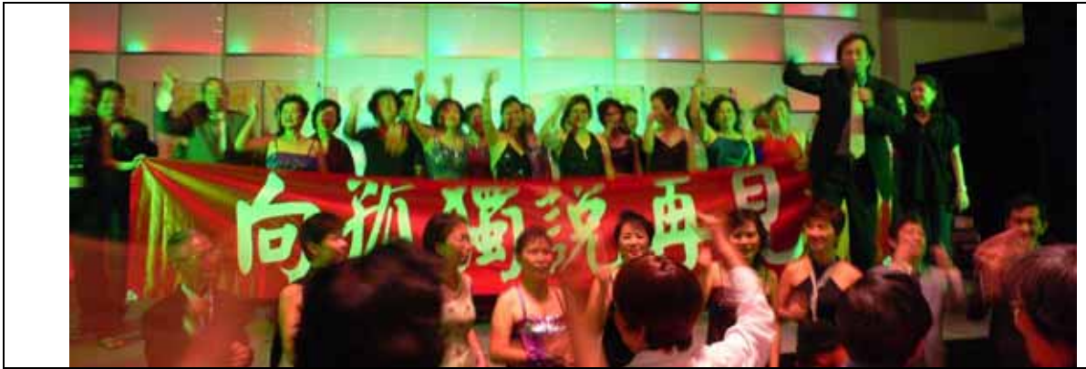
全體志工上台，一起向孤獨說再見