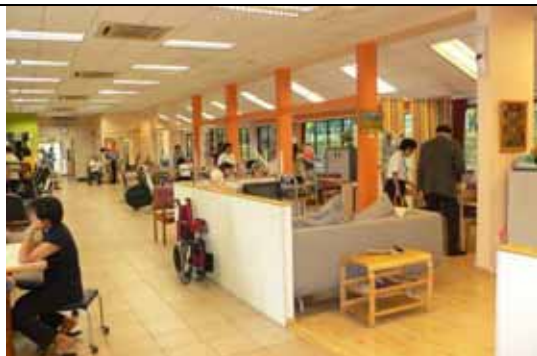
職能治療室，設備齊全，使用率非常高