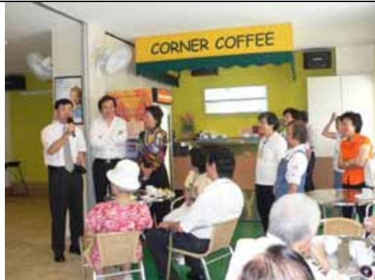
在新加坡武吉巴督的傳神協會所內，屋角咖啡是基本的「職能治療」設施