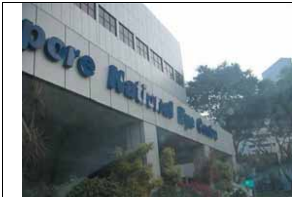
新保集團的眼科醫學中心