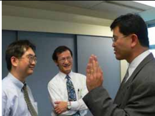
宋局長與代表處同仁交換意見