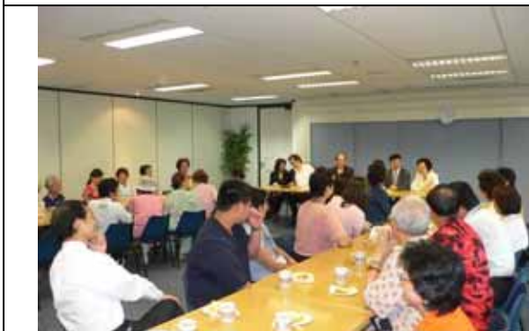
參與座談會的天使人力志工與代表處同仁