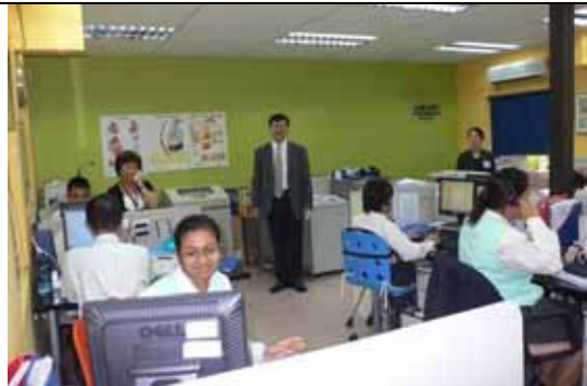
話務中心為高效率的聯絡站，醫院聘請花旗銀行的顧問來訓練電話禮儀及技巧