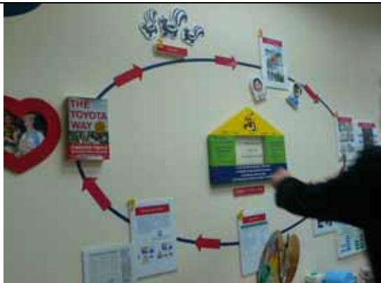
創意工作坊內四處可見工作指標與策略。圖上所示為「豐田之路」，說明該院經營理念來自豐田汽車廠的高效能管理