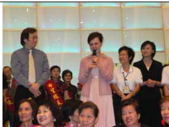
馬之秦小姐上台致詞