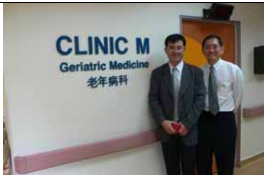
該院已設置老人病科。新加坡亦面臨老人人口大量增加的問題