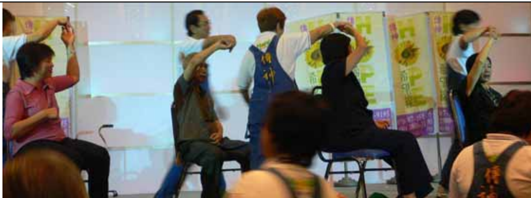
新加坡志工表演與個案互動，台上皆為真實個案