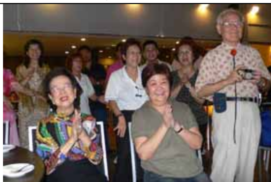
有人表演有人觀賞，演的人盡情，看的人盡興