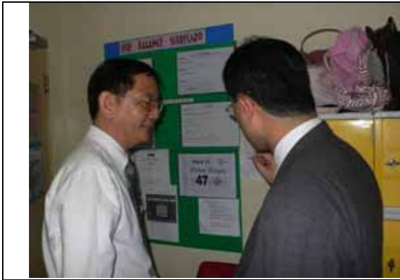
回到創意工作坊，再次見證其掌握工作之積極與效率