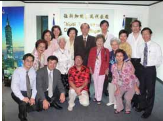
胡代表率代表處同仁與參訪志工與代表處門口留影