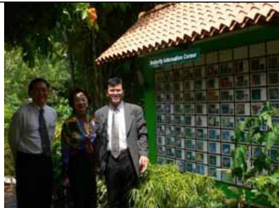
改革工作不只在院舍內，尚把院區內的一草一木一蟲一鳥，都是重建的一部份。院前公園已經成為活蝴蝶博物館