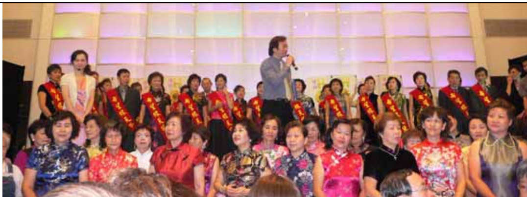
新加坡第三屆天使人力志工完成結業的「同學」盛裝出場亮相合影