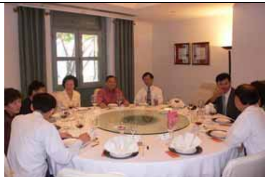
午餐貴賓包括新加坡教育部政務部長顏金勇先生（圖中著暗紅色上衣者），席間交換教育制度問題