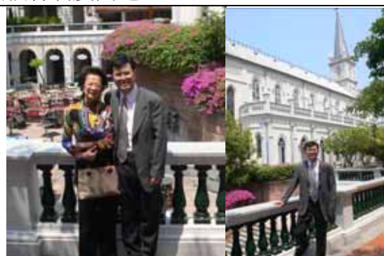
飯後於古蹟前留影（宋局長、黃主席）