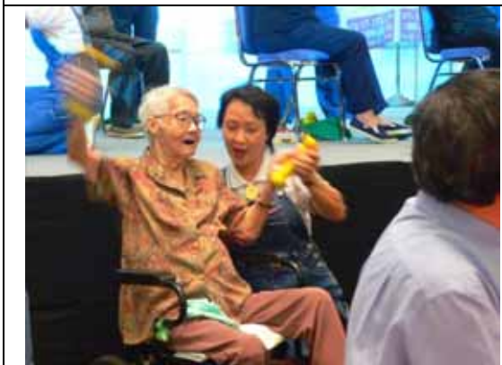
示範如何讓中風老人動起來