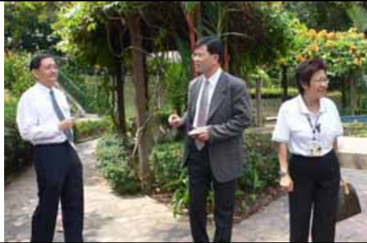
院舍間處處綠意盎然，宛如置身一家花園