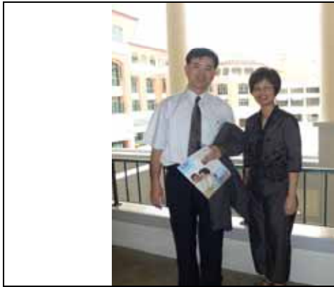
與南洋女中麥校長合影