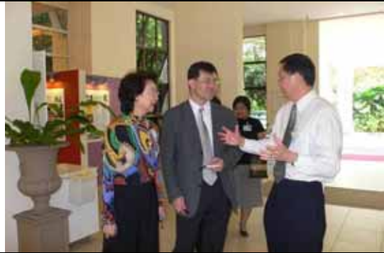
院舍內非常溫馨怡人，圖示為急診室，無一般急診室之瘡痍滿目