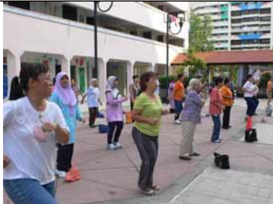
每天早上 9 點整，社區內開始運動養身。馬來人、印度人雖不懂中文，也興高采烈地參與活動