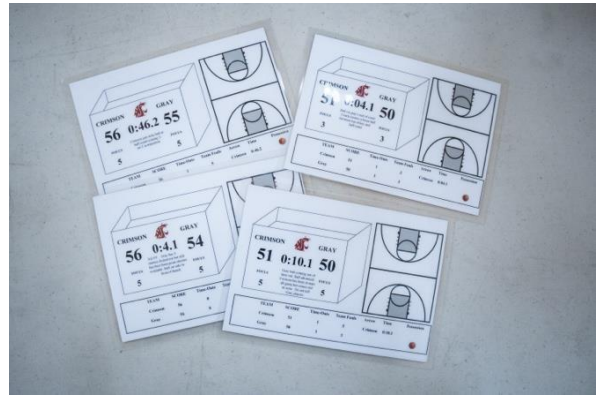
華盛頓州立大學女子籃球隊教具分享