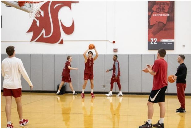
華盛頓州立大學男子籃球隊戰術分享