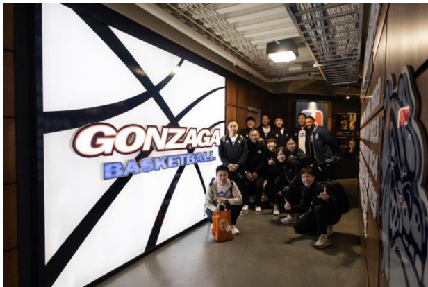
岡薩加大學男子籃球隊場館設施交流