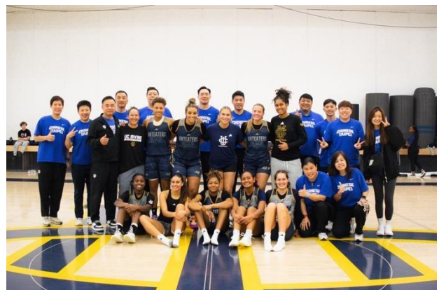
與爾灣加州大學教練團及球員合影