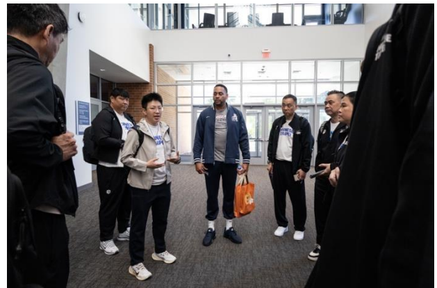
岡薩加大學教練分享球隊文化