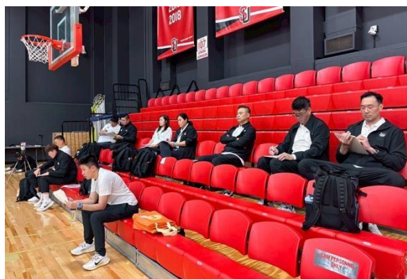
教練團場邊寫筆記