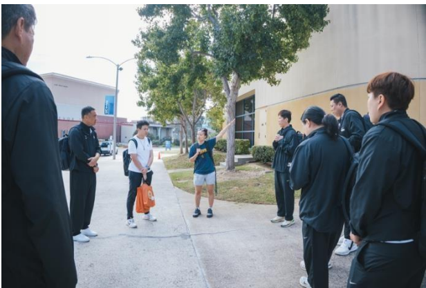
爾灣加州大學女籃隊教練介紹環境及設施