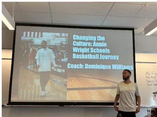
Annie Wright 高中