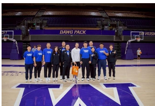
與 University of Washington 男籃教練合影