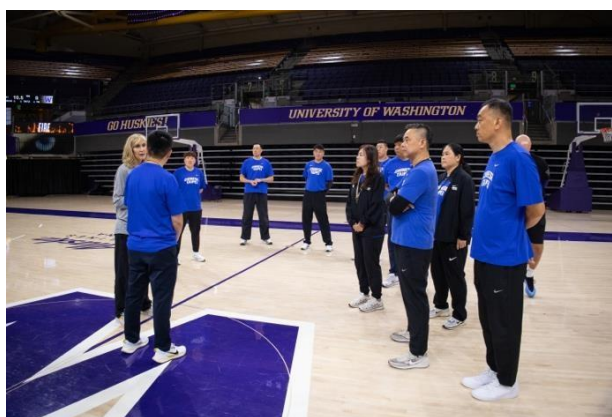
與 University of Washington 女籃教練討論分享