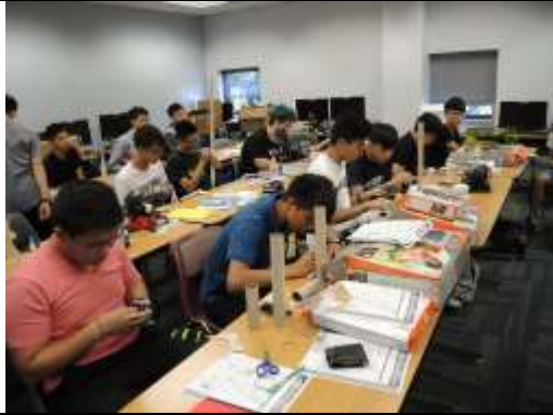
學生自己製作自己的火箭