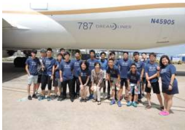
與 787 夢幻航空合照