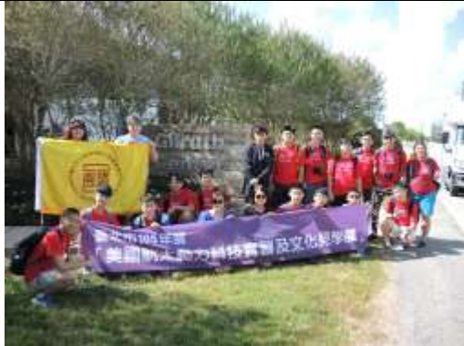
Gilruth Center 團照