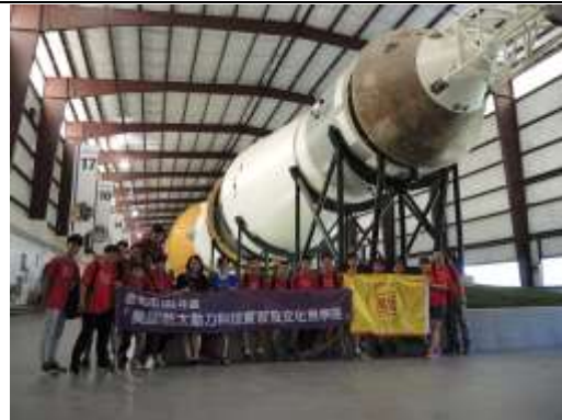
與土星五號登月火箭(模型)合照