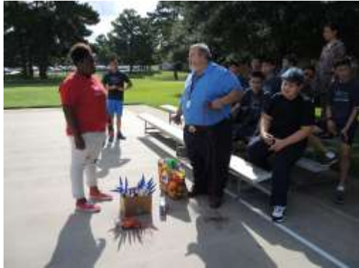
教師與助教告知學生應注意事項