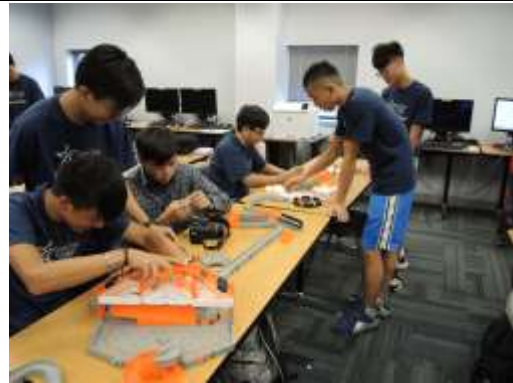
學生實際操作六角系統