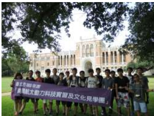
全體萊斯大學合照

究生項目，是美國最著名的大學之一，素有南方哈佛之稱。萊斯大學在材料科學、奈米科學、人工心臟研究、以及太空科學等領域占有世界領先的地位。