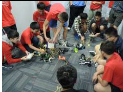
學生分組機器人競賽