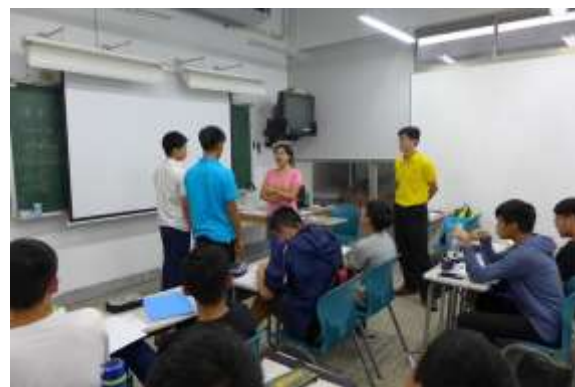
教師與學生英文互動