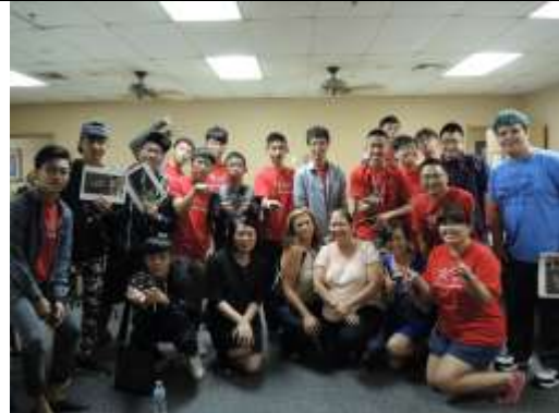
與幫我們解說的人員合照