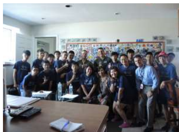
在 Signature 合照