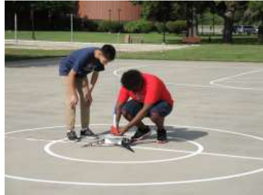
助教協助學生將火箭固定於發射台