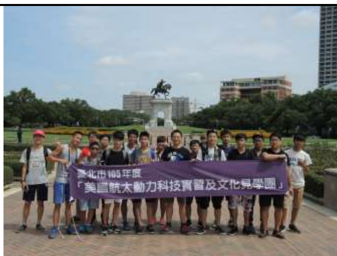
在赫曼公園的合照

楊赫曼公園位於市中心的南側，西側是著名的萊斯大學，周遭有自然科學博物館、兒童博物館、健康博物館和休士頓美術館等，公園內還有一個演出布段，永遠免費開放的米勒戶外劇院。近百年的赫曼公園在休士頓的愛護之下，除了有著名的廣場之外，還有環公園的小火車，隨著火車的繞行可以看到充滿異國風情的日本花園、花園中心、野餐區、兒童遊樂場等等。