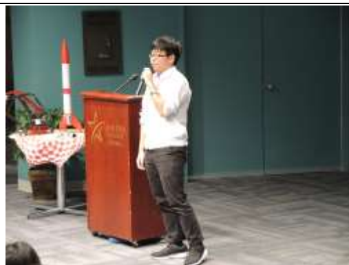
學生上台發表感謝