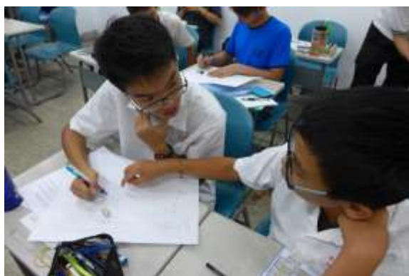
學生積極參與討論