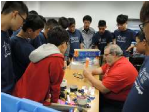
教師詳細介紹何謂六角系統