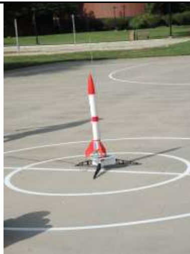
裝置高能量火藥的火箭