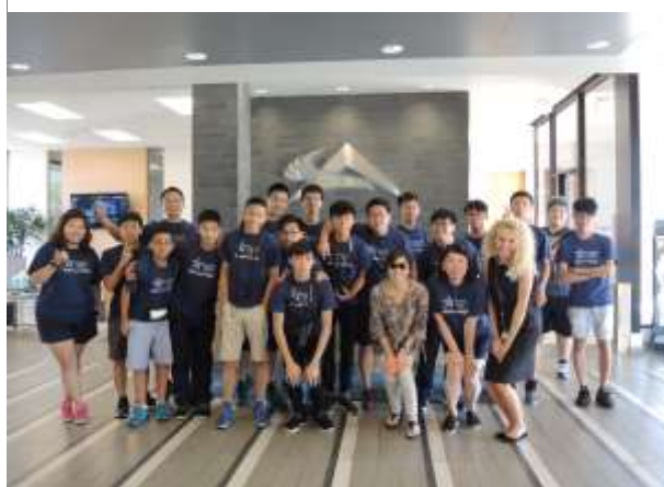
在 AtlanticAviation 合照