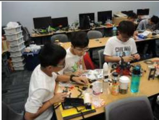
學生細心找尋零件