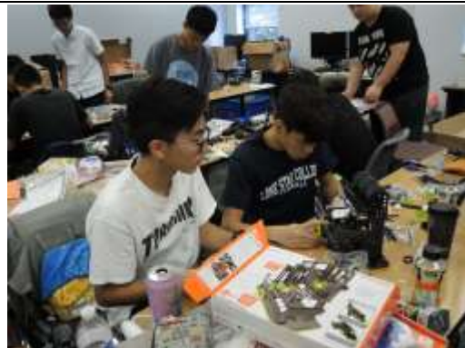
妥善運用團隊合作