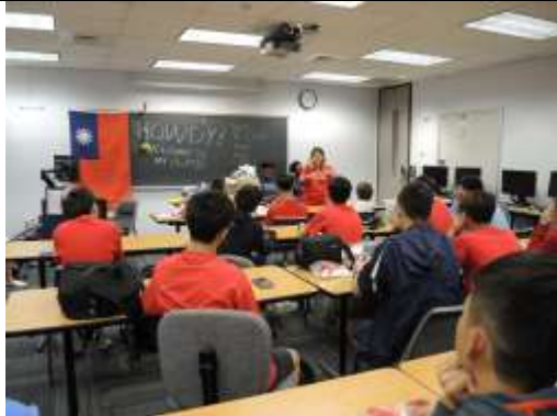
Nacy 介紹火箭各個部分名稱