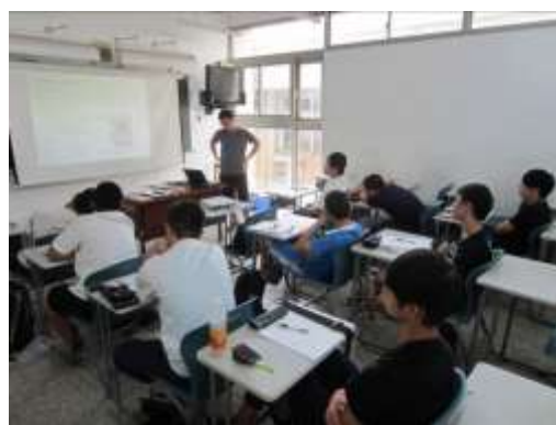
實務修護技術-專業知識增長