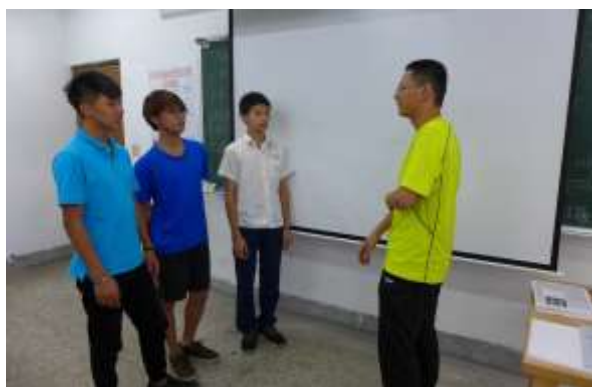
學生上台與學長英文對話