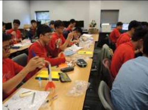
學生根據教師指引製造火箭