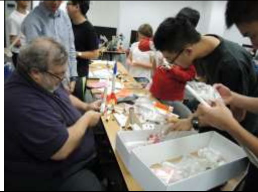
學生積極詢問教師