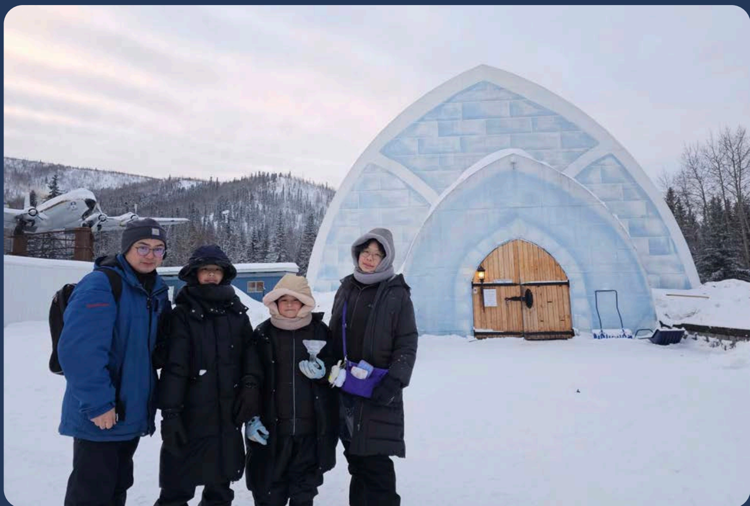
今年春節連假作者全家一起到阿拉斯加追極光，攝於珍娜溫泉冰雕博物館前。