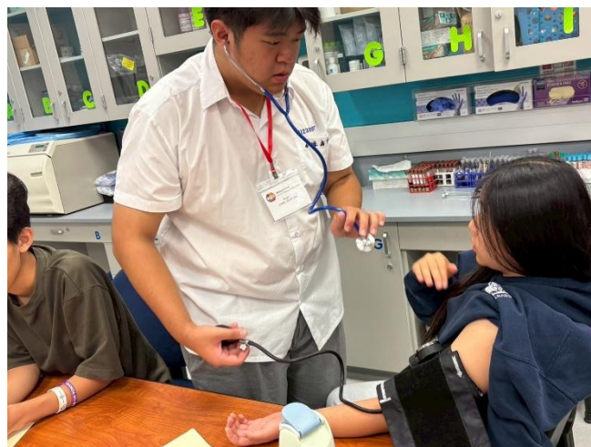
臺灣學生於SVCTE體驗醫療護理職業實作