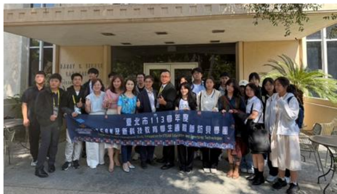
與加州理工學院葉乃裳教授討論奈米科技研究