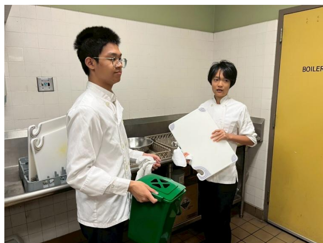
臺灣學生於SVCTE體驗餐廚烹飪職業實作