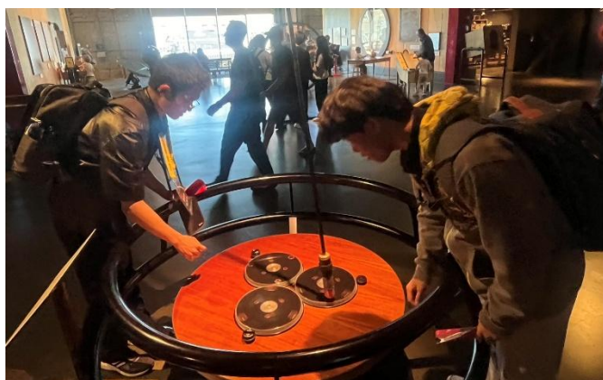
參觀加州創新科技博物館，學生實際操作了解科學原理