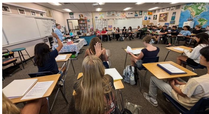
體驗Los Gatos高中一日美國高中生學習生活