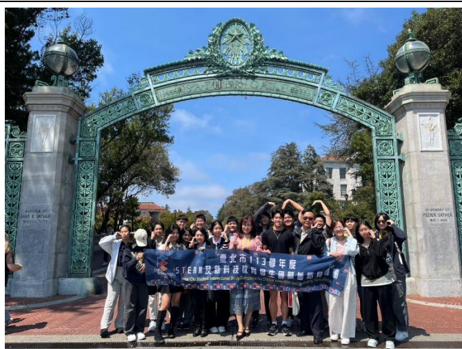
參訪柏克萊大學，了解學生申請入學條件