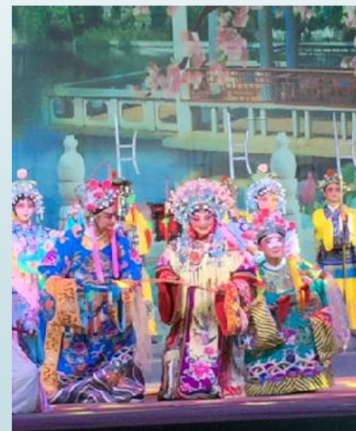
衢州非遺展演活動