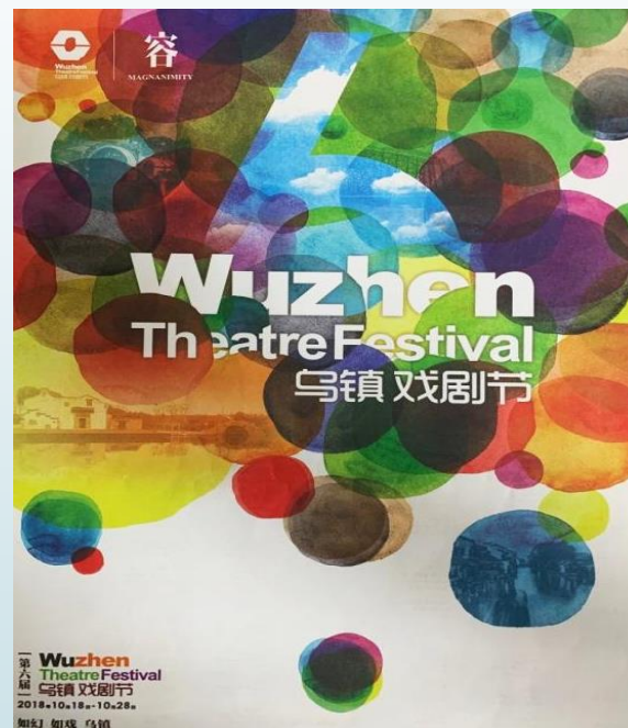
2018年烏鎮國際戲劇節宣傳海報