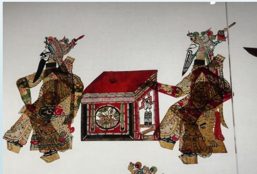
中國美院象山校區民藝博物館