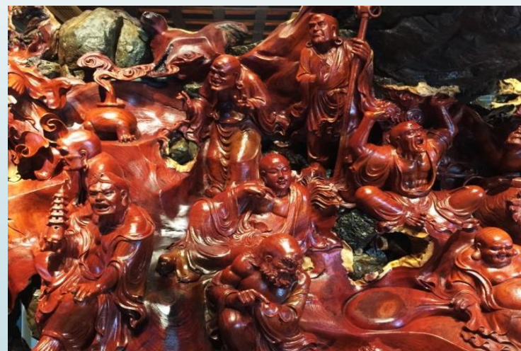
開化縣根緣小鎮（樹根雕塑藝術）