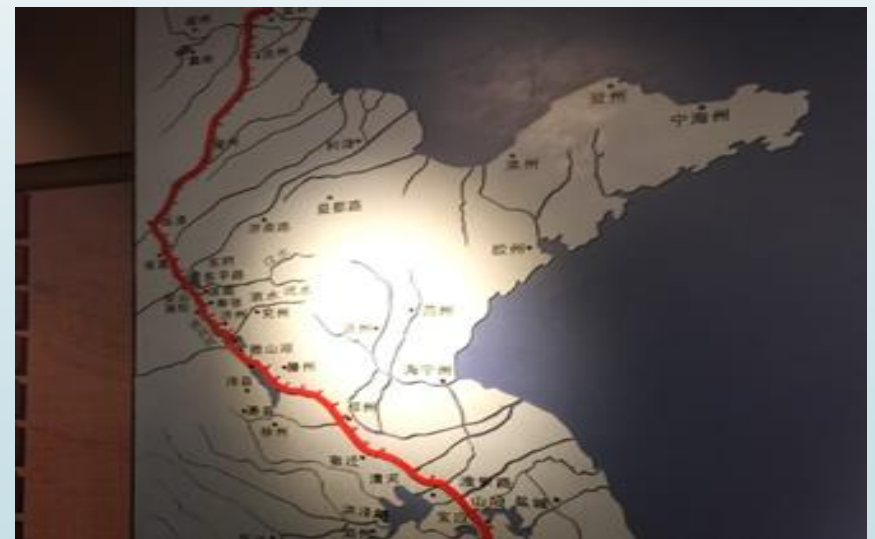
大運河博物館（京杭大運河路徑）