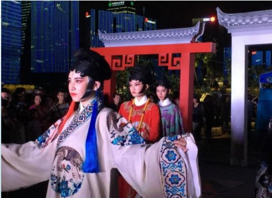
錢塘江民俗文化展演