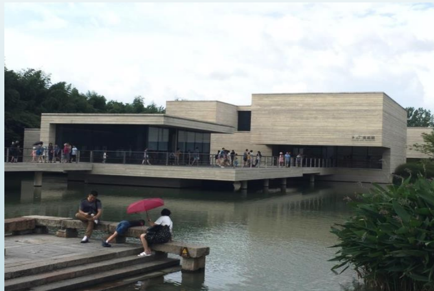
烏鎮木心美術館外觀