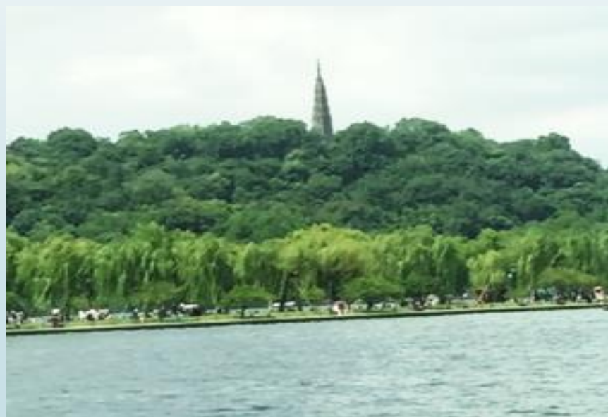
杭州西湖景觀一隅（雷峰塔）