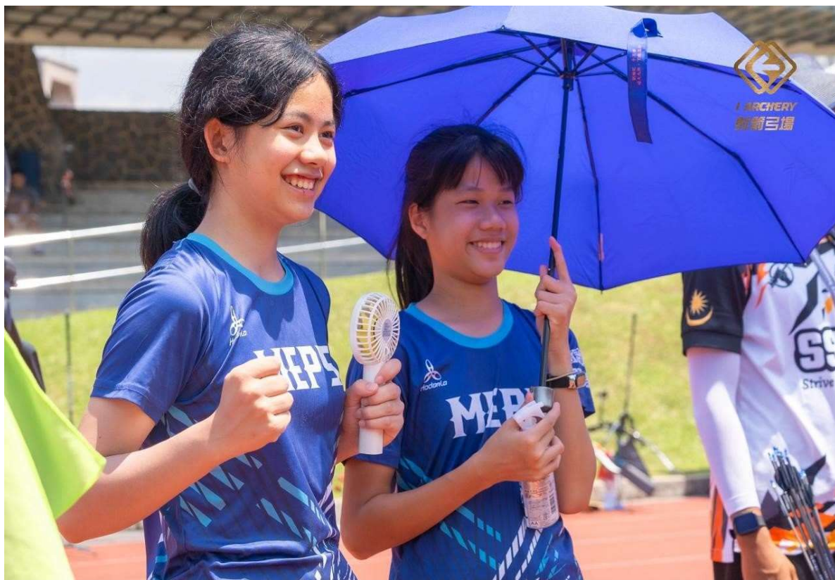
照片說明：7/27第三天個人對抗賽