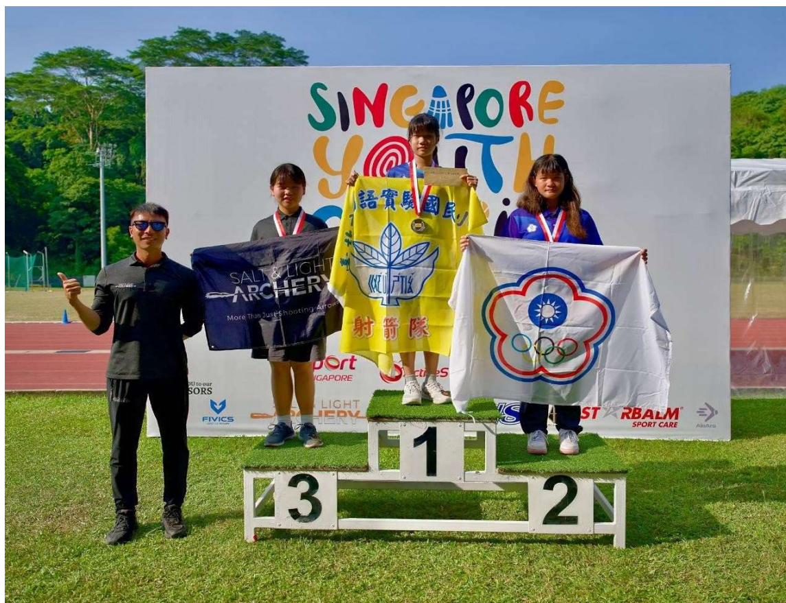
照片說明：U15女生組個人金牌