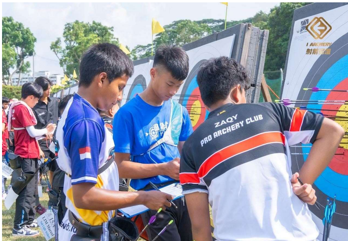
照片說明：7/29 交流練習