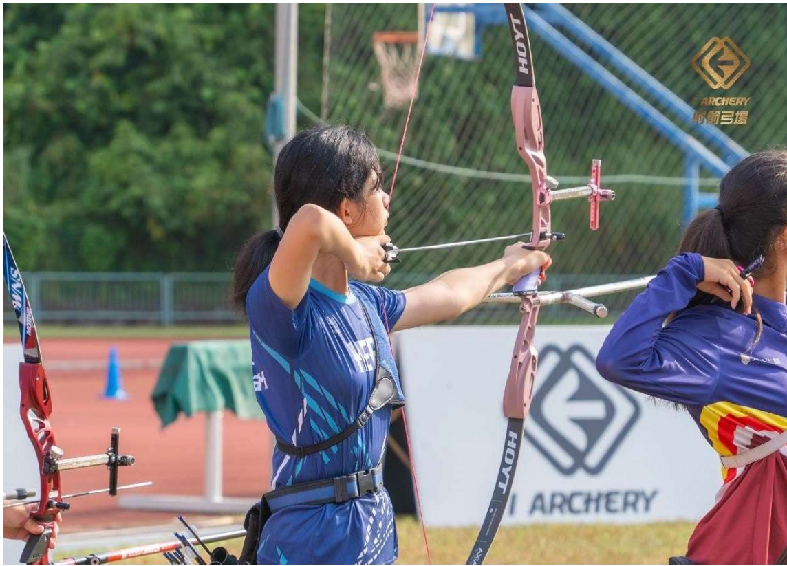
照片說明：7/27第三天排名賽