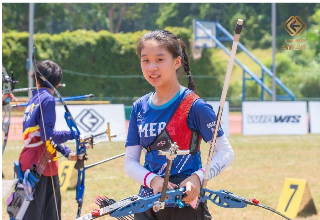
照片說明：7/26第二天公開練習