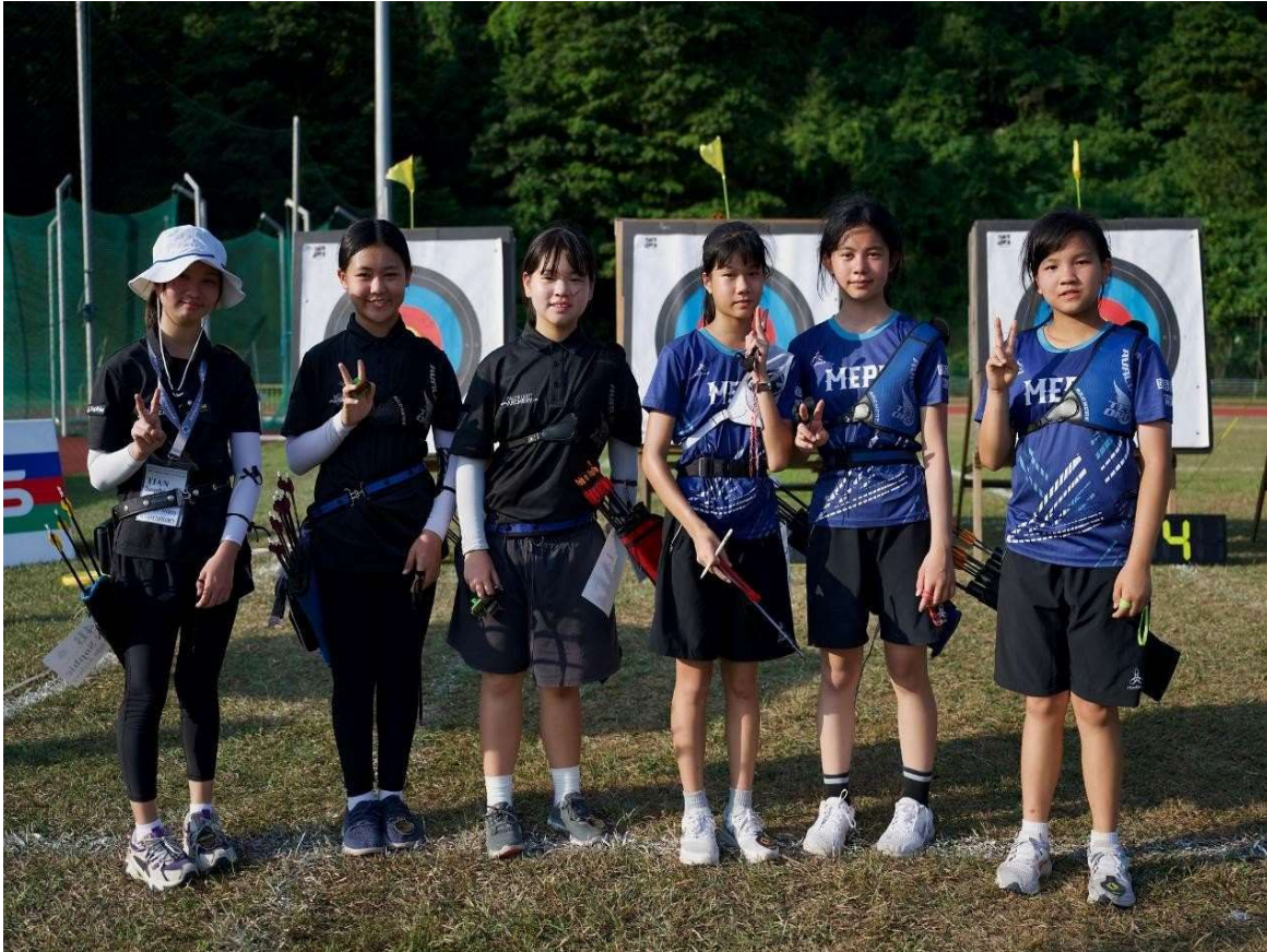
照片說明：7/27第三天團體對抗賽