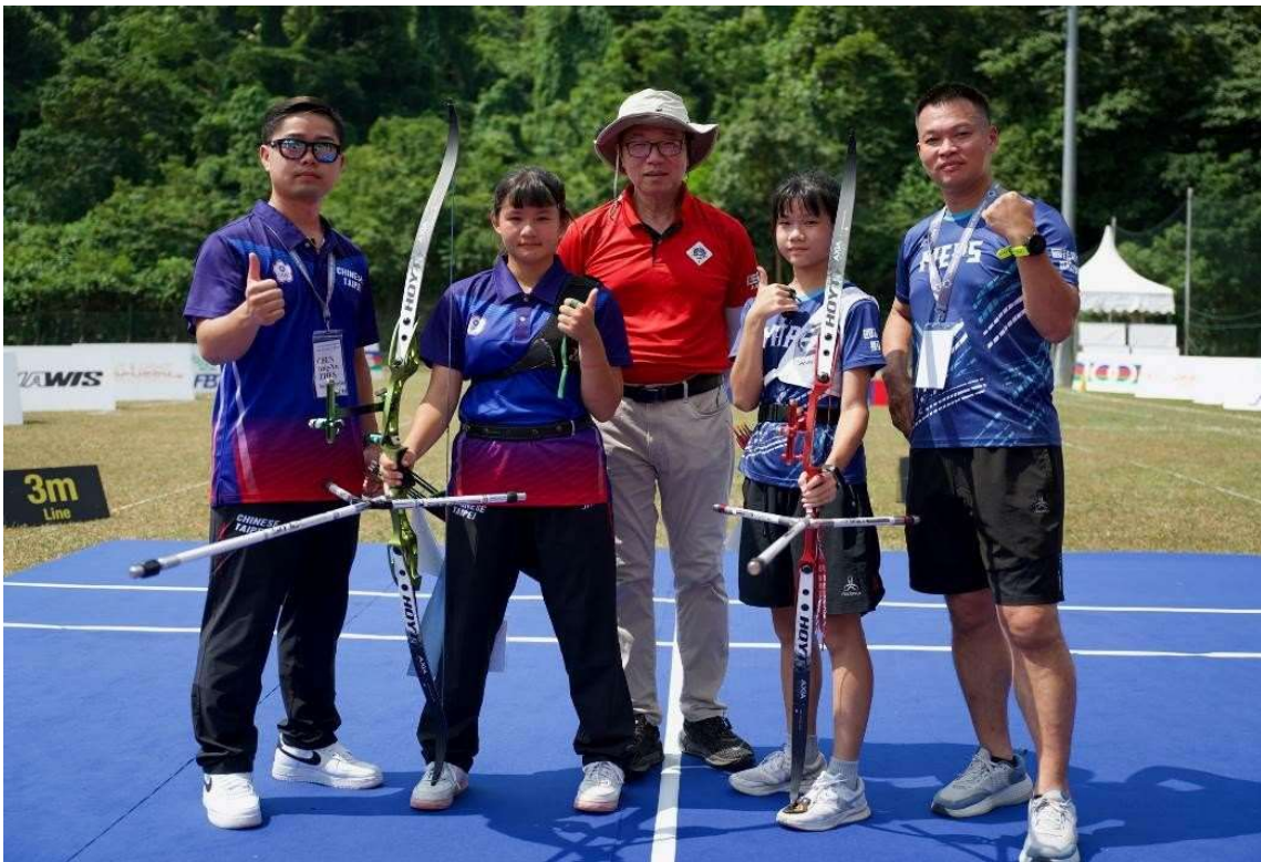
照片說明：7/28 U15女生個人金牌戰