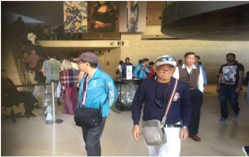
圖片說明：里長們進入羅浮宮