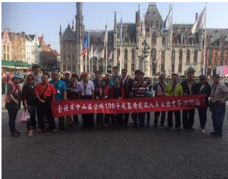
圖片說明：參觀布魯日市集廣場