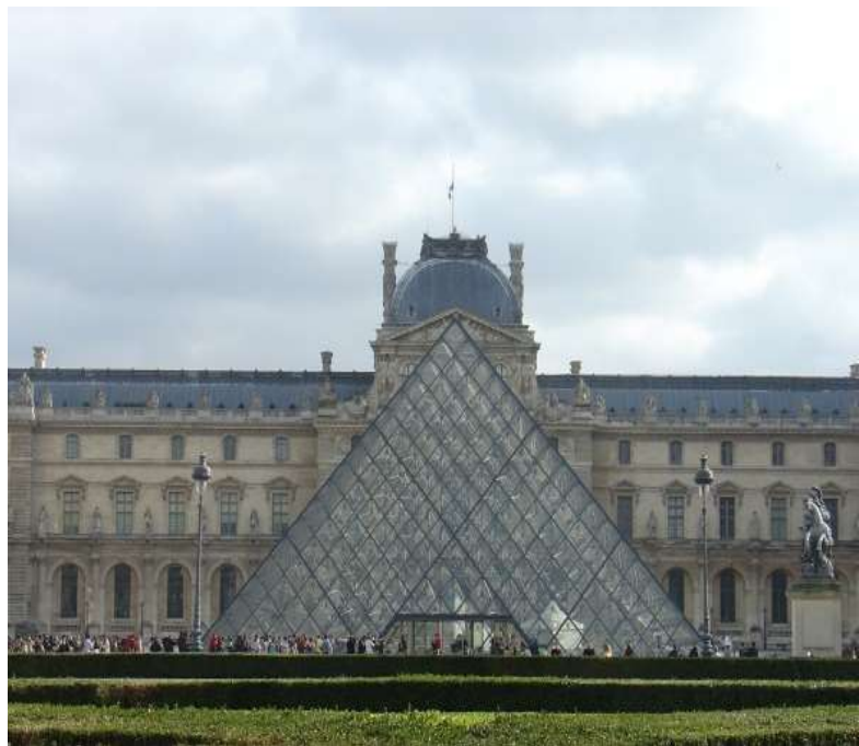
圖片說明：羅浮宮建築外觀