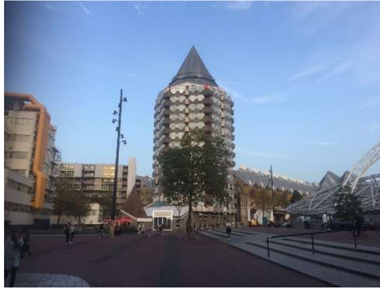
圖片說明：參觀鉛筆屋及方塊屋