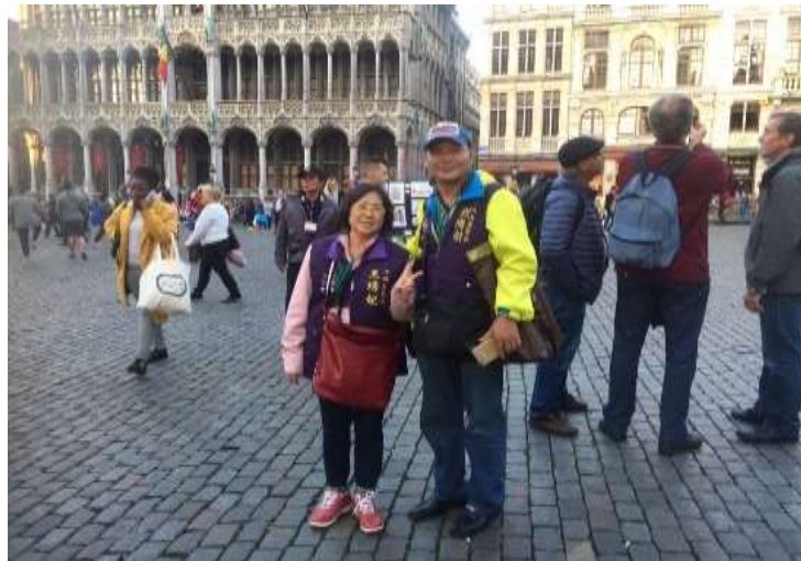
圖片說明：下埤里里長與江山里里長於布魯塞爾廣場合影