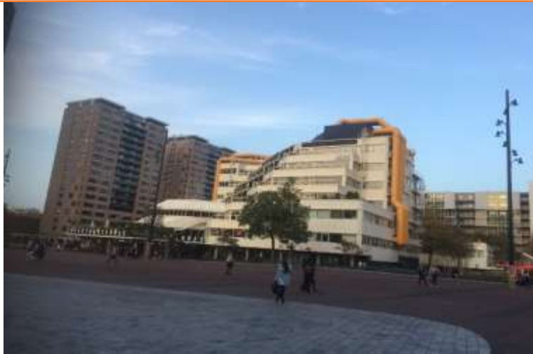
圖片說明：參觀鹿特丹圖書館