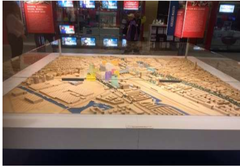
圖片說明：烏特勒支市模型