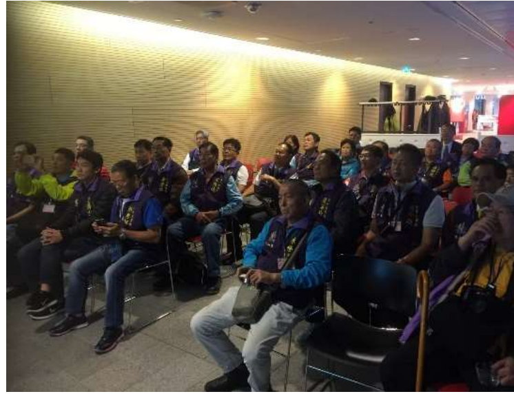
圖片說明：於烏特勒支市政府聽取簡報