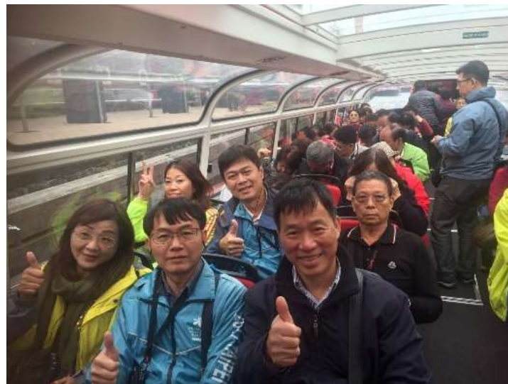
圖片說明：搭乘玻璃船遊運河