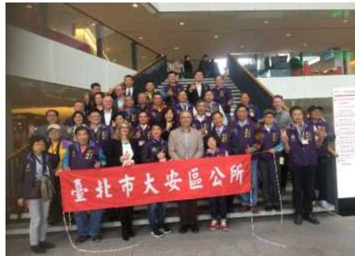
圖片說明：在烏特勒支市政府大廳合照