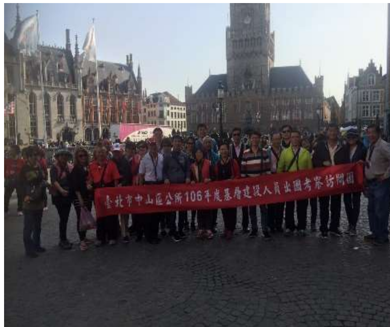
圖片說明：參觀布魯日鐘樓