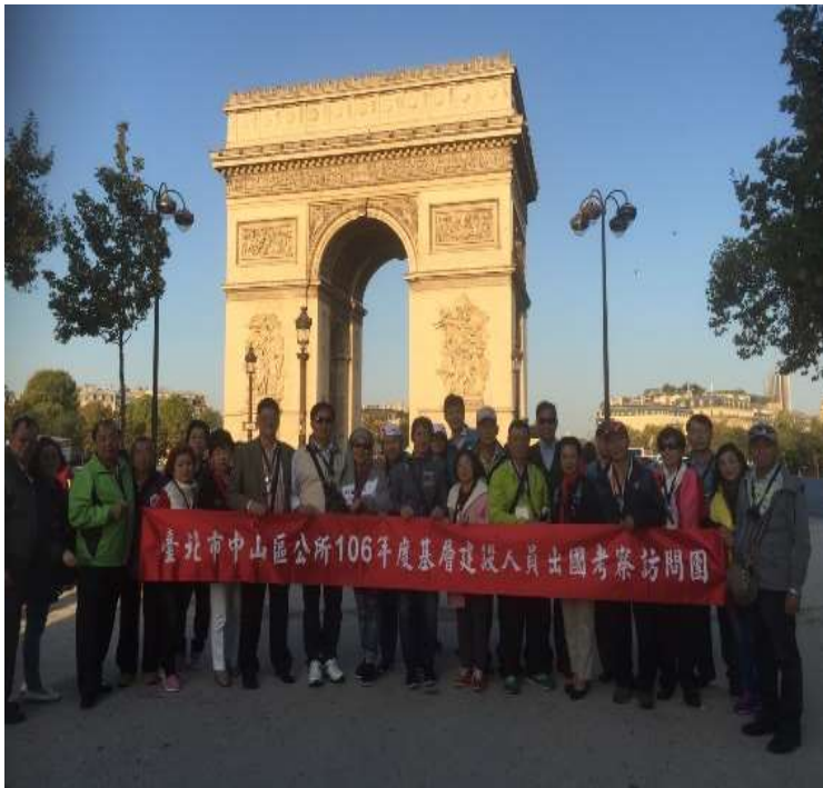
圖片說明：里長們在凱旋門前合照