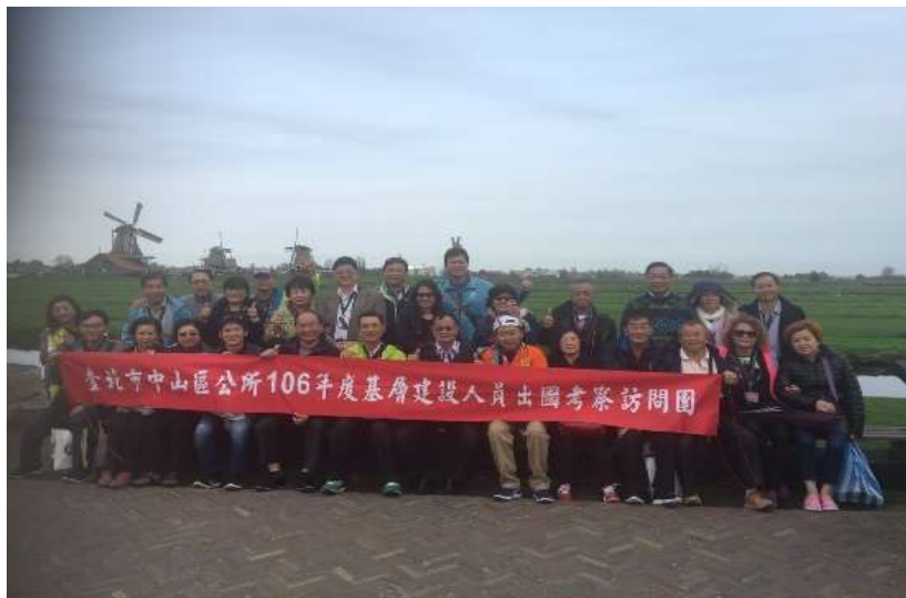
圖片說明：參訪風車村