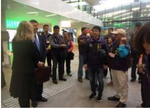
圖片說明：烏特勒支市政府接待員引導里長們