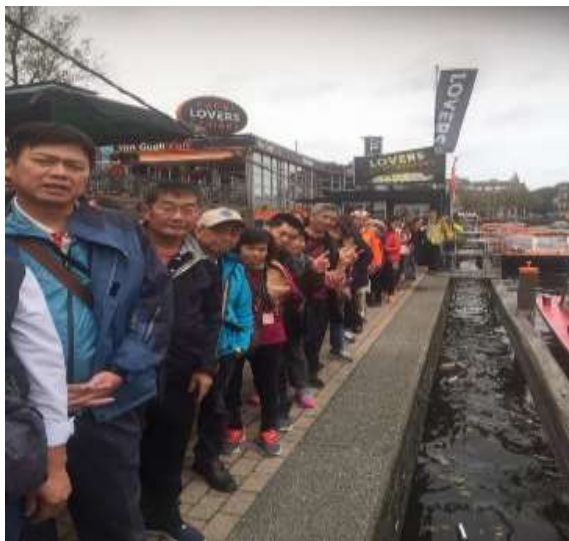
圖片說明：等候搭乘玻璃船遊運河