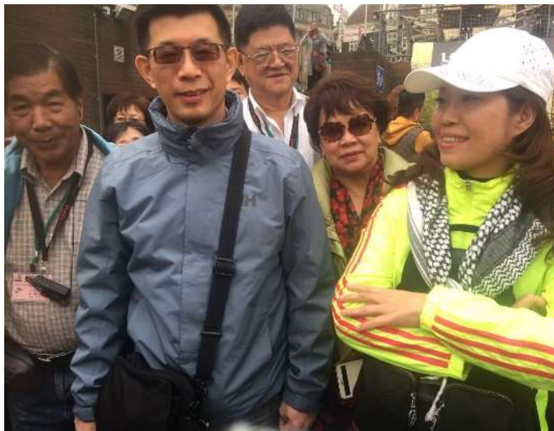
圖片說明：等候搭乘玻璃船遊運河