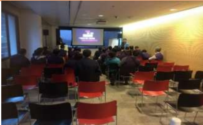
圖片說明：在烏特勒支市政府簡報室專心聆聽簡報