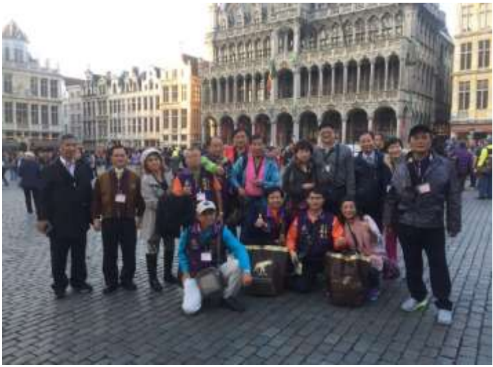
圖片說明：參觀聯合國教科文組織認定的世界遺產-布魯塞爾廣場