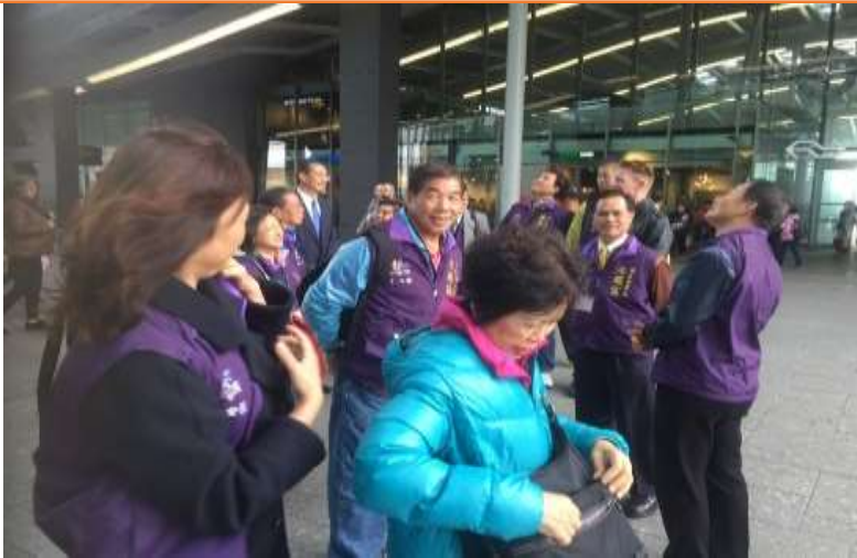
圖片說明：前往烏特勒支市現正興建之自行車專用停車場