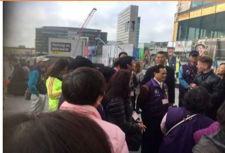
圖片說明：烏特勒支市市政府人員介紹正在興建之自行車專用停車場