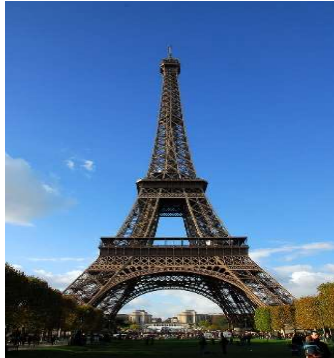
圖片說明：艾菲爾鐵塔外觀