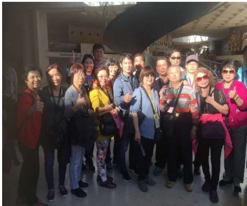
圖片說明：里長們在羅浮宮大廳