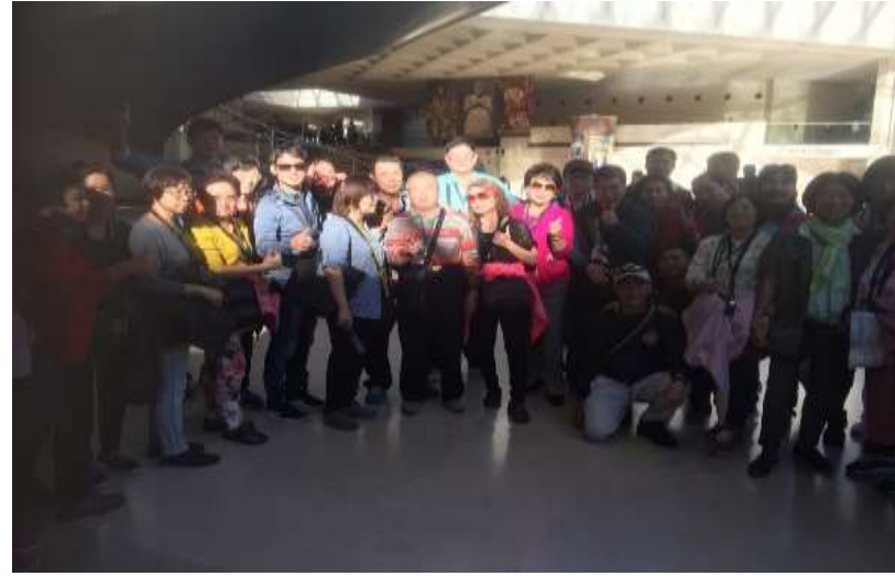
圖片說明：里長們在羅浮宮大廳