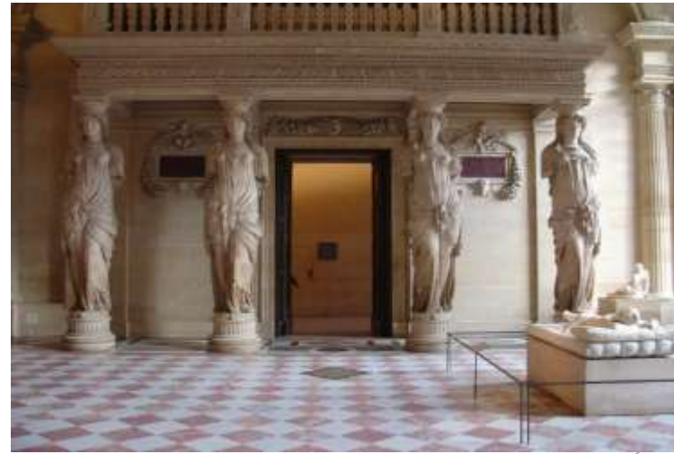
圖片說明：羅浮宮館內展區