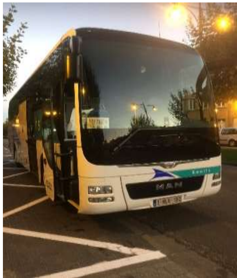
圖片說明：於歐洲搭乘之專車-中山區