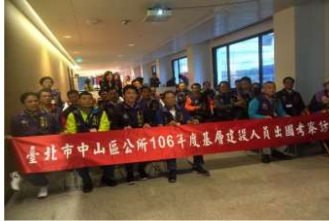
圖片說明：在烏特勒支市政府簡報室