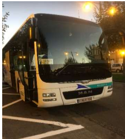
圖片說明：於歐洲搭乘之專車-大安區