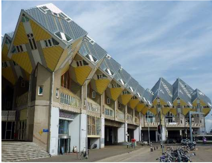
圖片說明：參觀方塊屋