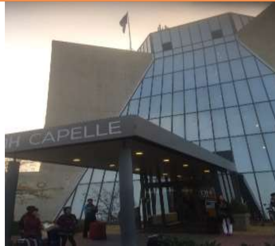
圖片說明：下榻鹿特丹NH Capelle Hotel