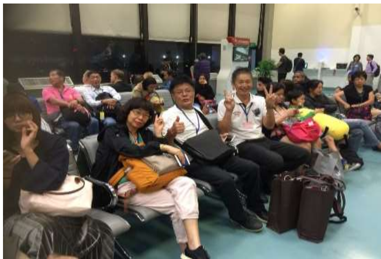
圖片說明：在桃園機場候機中：