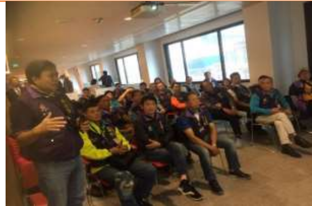
圖片說明：行仁里里長詢問烏特勒支市政府人員有關長者照顧問題