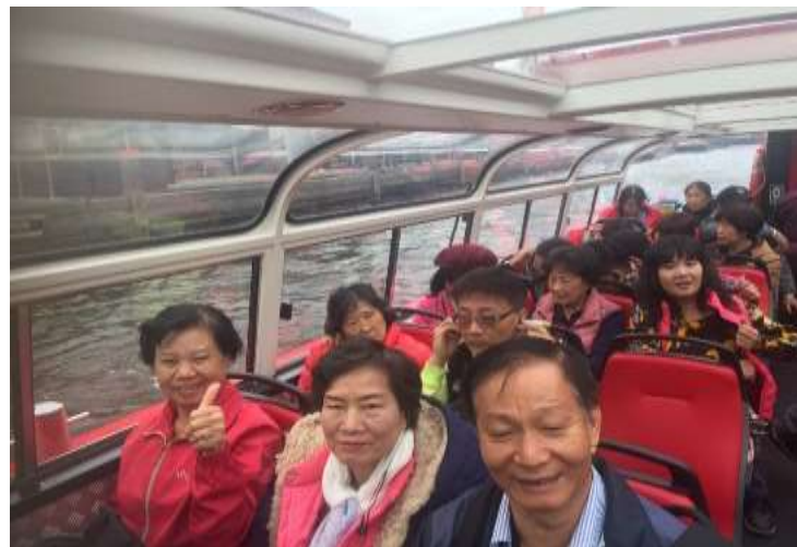
圖片說明：搭乘玻璃船遊運河