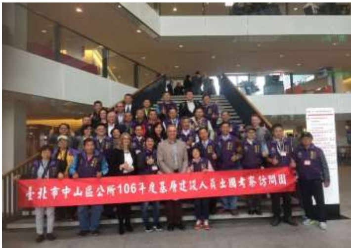
圖片說明：在烏特勒支市政府大廳合照