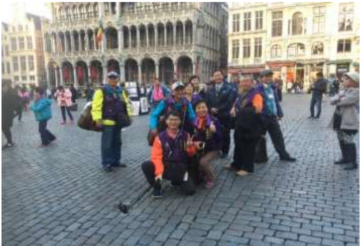
圖片說明：參觀布魯塞爾廣場合影片說明