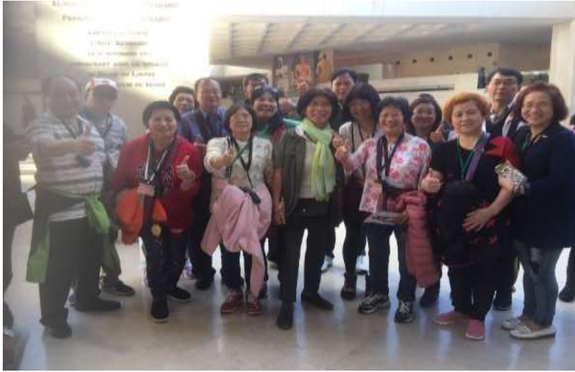
圖片說明：里長們在羅浮宮大廳