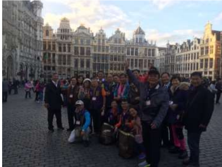
圖片說明：參觀聯合國教科文組織認定的世界遺產-布魯塞爾廣場