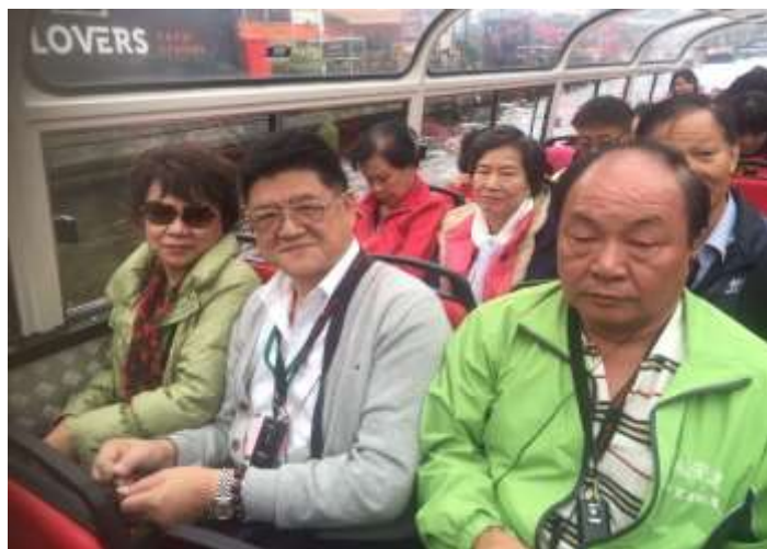
圖片說明：綜合市場的玻璃帷幕