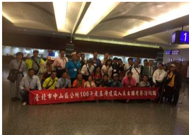
圖片說明：在桃園機場大廳合照