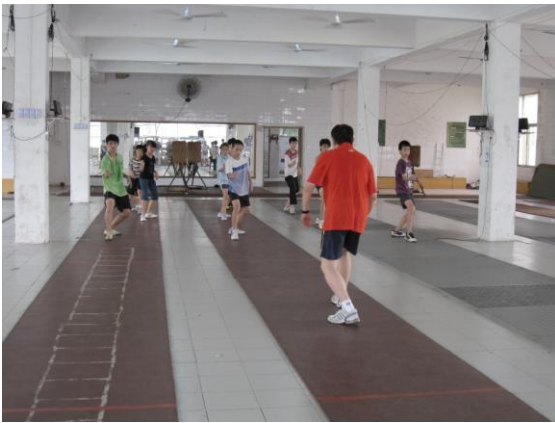
參觀擊劍場及訓練

學院辦學條件完善。現有多媒體客市28間，電腦教育2間，語音室1間。普通教室均配有擴音器、幻燈片投影、電視機、VCD、答錄機和智慧型廣播系統。