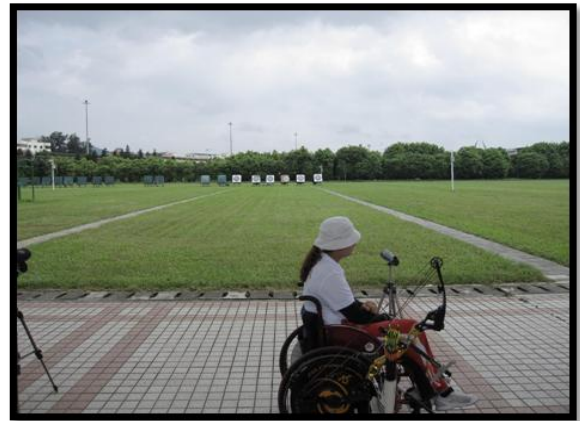
黃村訓練基地裡的射箭場