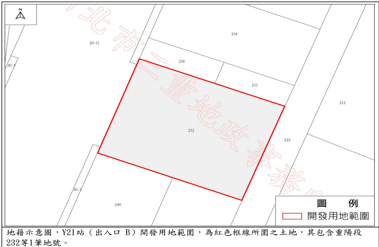
圖2 Y21站（出入口 B）捷運開發區地籍示意圖