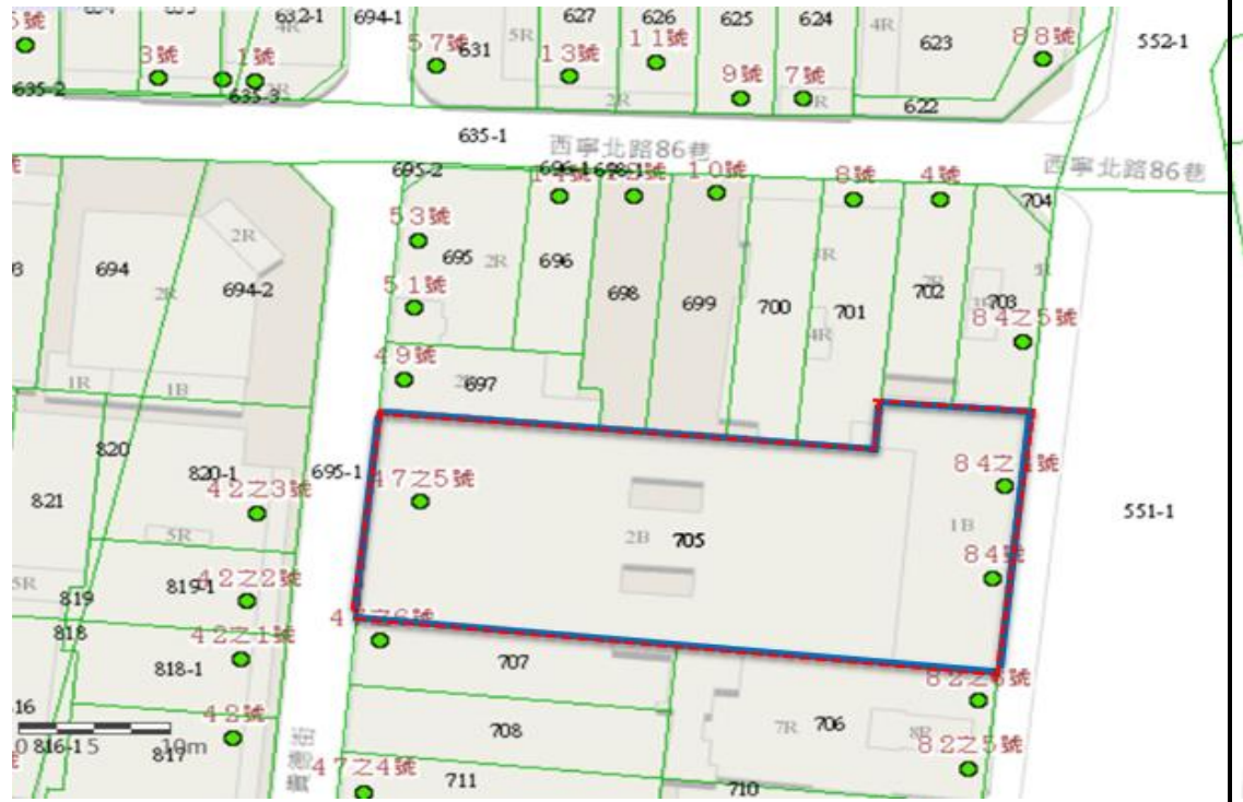
直轄市定古蹟「全祥茶莊精製廠」 本體及其定著土地範圍示意圖

古蹟本體為西寧北路 84 號及貴德街 49 號建築本體，建物為大同區迪化段三小段 1670 建號（建物總面積 1230.34 平方公尺），建築物坐落土地為大同區迪化段三小段 705 地號（758 平方公尺）等 1 筆土地。（實際保存面積須以保存範圍實測數據為準）