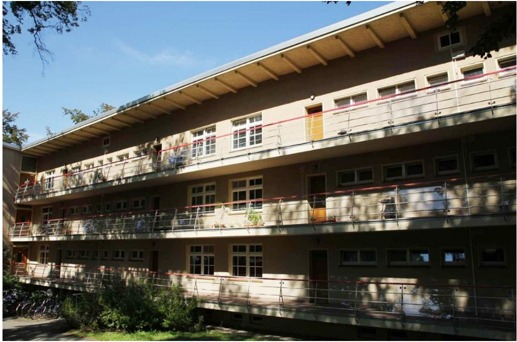
圖 2 Park Babelsberg 學生宿舍