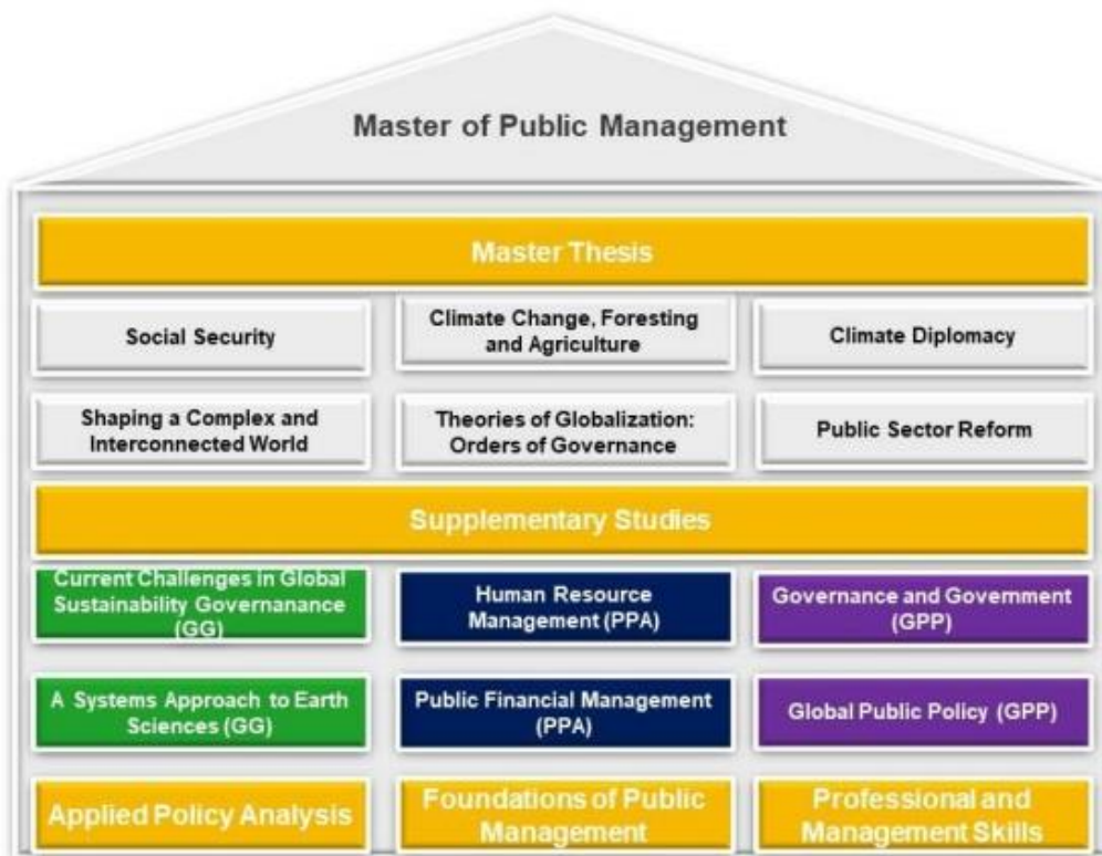
圖 4 公共管理碩士課程架構

提交論文大綱後擇定指導老師，與指導老師討論後修改論文問題意識、研究問題與研究方法，以及依研究主題設計研究執行方案後撰寫論文、口試。