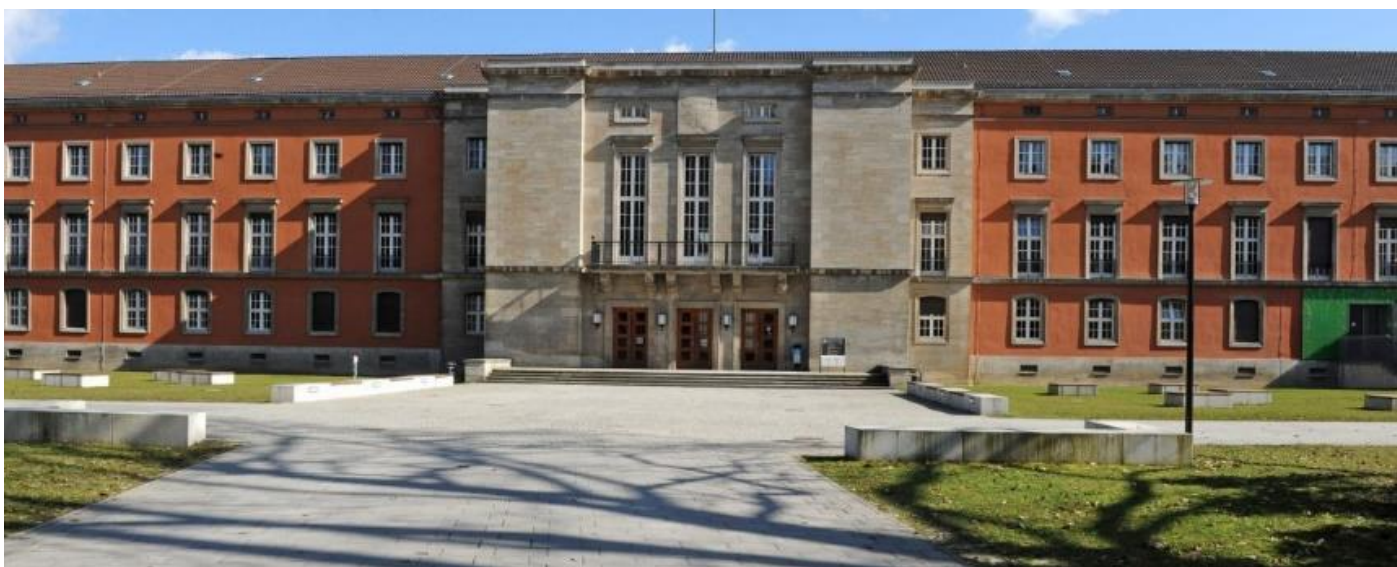
圖 1 波茲坦大學 Griebnitzsee 校區

波茲坦大學主要由三個綜合校區（Neuen Palais, Golm, Griebnitzsee）組成，校區橫跨波茲坦市，由於提報人就讀的公共管理碩士課程主要位於 Griebnitzsee 校區，對於住宿的規劃便以該校區周邊為主要範圍。該學區周邊上有四、五所綜合大學、學院，雖有私人租屋亦有學校合作的學生宿舍等多元房源，但因周邊學生數眾多，因此建議在確認就讀後即透過學校申請宿舍，避免赴德後才安排住宿之不確定性。