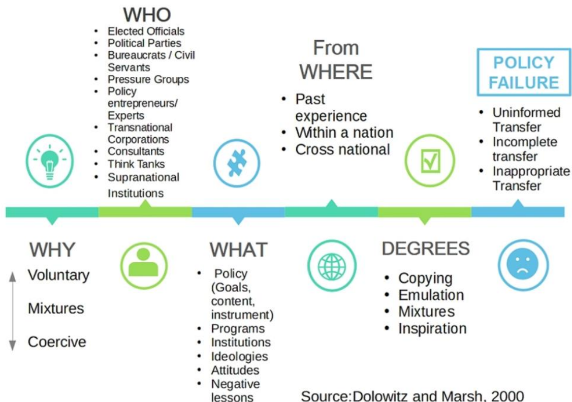
圖 6 政策轉移框架（來源：Dolowitz 和 Marsh，2000）