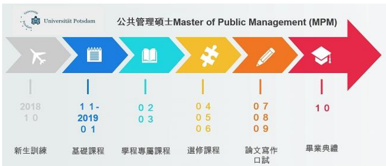
圖 3 公共管理碩士課程進修時程（來源：提報人自行繪製）

提案人進修的課程為公共管理碩士課程，一年學制分為冬季學期（10月至3月）與夏季學期（4月至9月）兩學期，課程除共通基礎課程外，亦會依學生所屬學程安排專屬課程以及依學生研究興趣與論文方向提供選修課程，進修時程如下圖 3。