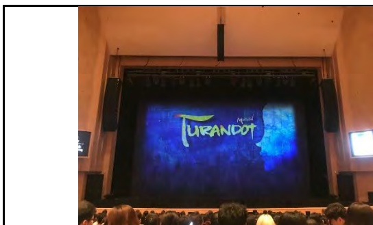
韓國音樂劇〈杜蘭朵〉劇照

音樂劇〈杜蘭朵〉係韓國改編普契尼知名歌劇〈杜蘭朵公主〉之創新音樂劇作，亦為大邱國際音樂劇活動代表作品，作品揉合原作故事主線及韓國古典文化元素，以提高現代觀眾親近性，並以大量體舞台道具、高科技燈光效果及絢爛音效，展現磅礴氣勢；主角群及伴舞群總計近三十人於舞台上展現動人演技及精彩樂聲，同時有弦樂團現場演出伴奏，給觀眾視覺及聽覺上的雙重饗宴，演出結束後觀眾數度起立鼓掌，反應熱烈，同時音樂劇表演場地為私立啟明大學之歌劇院，其場地配置、席位安排、音響場域及舞台設施皆屬一流，顯示大邱市除公立展演場地外，民間單位亦積極建設音樂藝文場館，以培養新興創作人才。