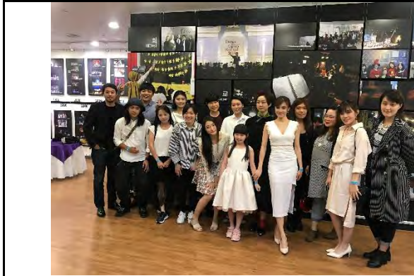
C Musical團隊於頒獎典禮會場合影

頒獎典禮為大邱國際音樂劇節的活動高潮，DIMF邀請評審委員針對音樂劇中各劇團表演進行評選，並頒發最佳新人、最佳男女主角、終身成就獎等多項獎項外，臺灣演出團隊C Musical亦入圍最佳女主角、最佳音效等多項獎項，可惜未能於各國傑出佳作中未能脫穎而出，但經觀察大部分得獎作品於演員人數及道具特效上投入大量成本，顯示臺灣囿於有限預算下創作之精緻劇作，於國際競爭舞台上仍有進步空間。