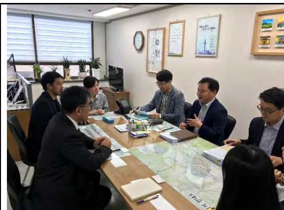
拜會大邱市文化體育觀光局金浩燮局長

大邱市政府文化體育觀光局統籌城市文化觀光事務，是大邱國際音樂劇節重要推手，本次參訪亦由本局劉主任秘書得堅率演出團隊C Musical及業務科同仁，前往拜會文化體育觀光局金浩燮局長並交流城市文化治理心得，金浩燮局長分享大邱市辦理大邱音樂劇節活動推廣心得，並說明除地方政府協助推動活動外，韓國中央政府單位「韓國觀光公社」亦投入相當資源支持推動音樂文化產業化業務，觀光公社並於各城市設立觀光支社，透過支社處理地方政府行政介面事務，由中央及地方政府共同協助推動文化觀光業務，成效斐然；同時經觀察大邱市文化事務、觀光活動及體育賽事等業務皆整合於單一局處，相較於本市各局處單位以各自專業分工，大邱市政府單位業務橫向整合情形確有值得本市學習之處。