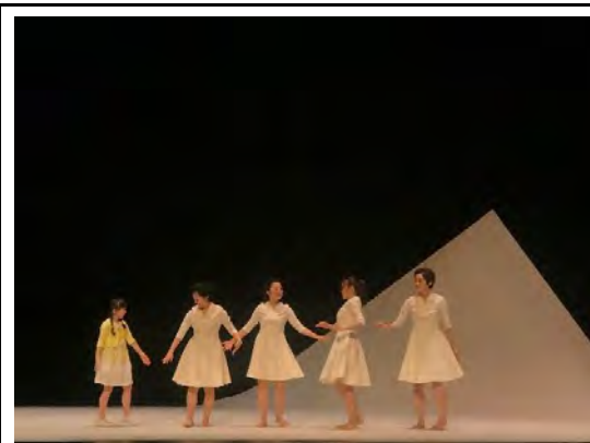
臺北市傑出演藝團隊C Musical劇照

C Musical於107年獲選台北市傑出演藝團隊，該團隊於107及108連續兩年獲大邱國際音樂劇邀請前往參加演出，並與歐亞多國精彩作品共同競逐各項獎項，展現台北音樂文化藝術領域創作人才已備受國際肯定，團隊今年度以全新音樂劇作〈最美的一天〉作為演出劇目，以臺灣傳統親情為表演主軸，並以全女角演出作為特點，由不同年齡層演員詮釋臺灣家庭文化下特有的溫馨倫理，輔以演員精湛演技及柔美清唱聲線；表演溫馨感人，雖以全中文演出，但仍引起不少觀眾於演出中感動拭淚，表演結束後民眾亦與團隊熱情合影留念。