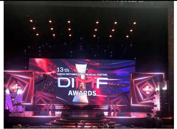
大邱國際音樂劇節頒獎典禮現場