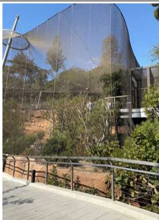
圖4. 聖地牙哥動物園的在 Lost Forest 區域的 Parker aviary，由 Parker Fondation 捐贈建造的大型網籠區域，模擬自然棲地為設計核心。大網籠提供寬廣、植被豐富的环境，讓鳥類能展現覓食、築巢等自然行為。