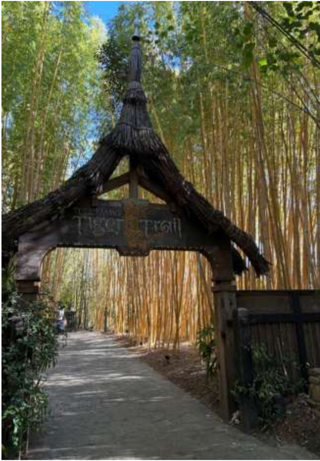
圖5. San Diego Safari Park「虎徑」入口意象，以蘇門答臘風格的草屋作為入口，整個展區約2.1公頃，以森林環境打造，可近距離觀察蘇門答臘虎並強調保育理念。