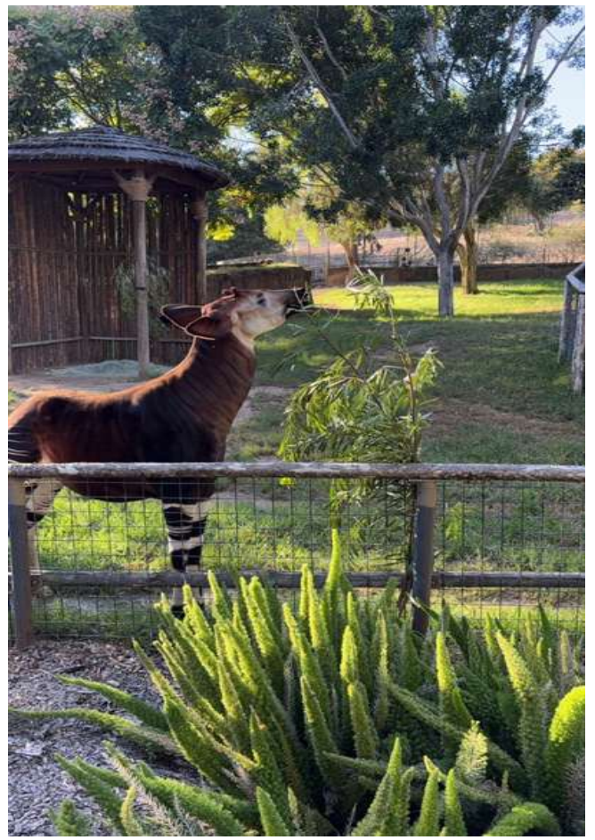
圖6. San Diego Safari Park okapi 展示場圍籬設計較低，與遊客以植栽區隔出距離；及餵食點設置於遊客面前，可清楚觀賞到動物進食畫面。