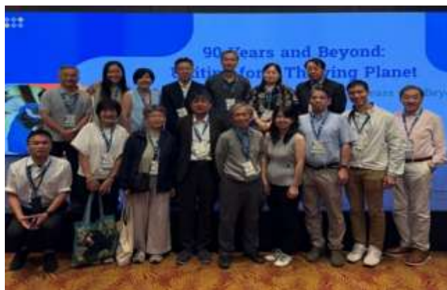
圖 2. WAZA 會議 - 與來自 JAZA ( Japanese Association of Zoos and Aquariums)、泰國 ZPOT (Zoological Park Organization of Thailand)及香港海洋公園與會者合影。