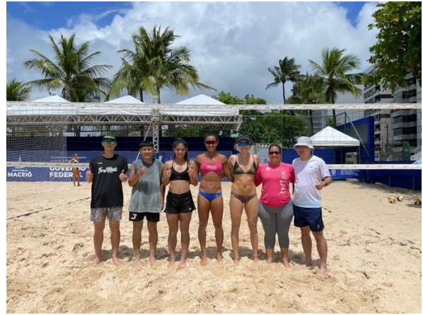
訓練交流賽及場地適應