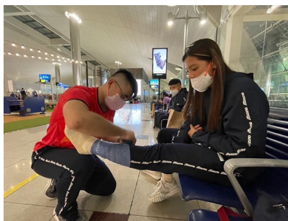
杜拜機場專機傷害治療