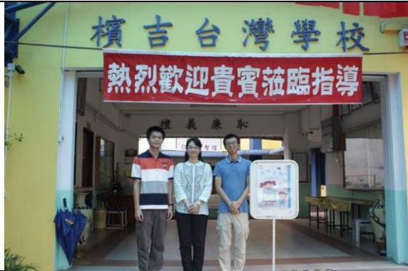
照片說明：與吉隆坡台灣學校老師座談，感謝提供這次觀摩與交流的機會