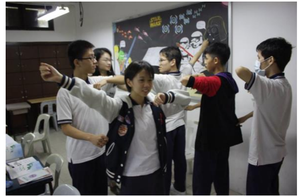
照片說明：105 年度教學輔導團訪問檳吉臺灣學校合影