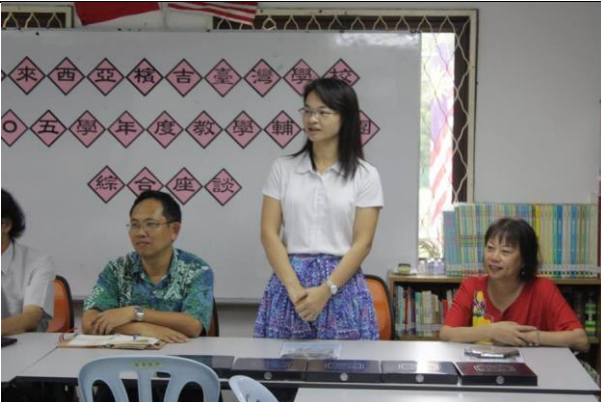
照片說明：感謝檳吉臺灣學校提供教學觀摩交流的機 會