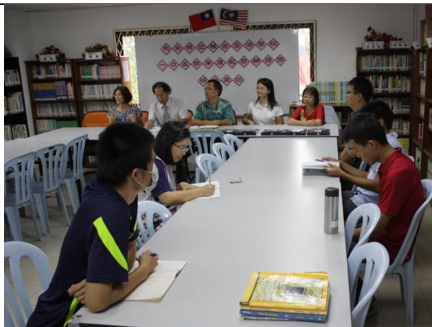
照片說明：檳吉台灣學校綜合座談