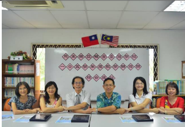
照片說明：檳吉台灣學校綜合座談合影