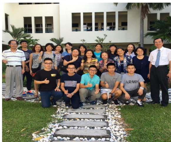
照片說明：與吉隆坡台灣學校座談後合影