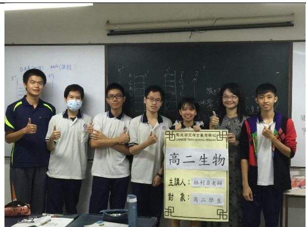
照片說明：指導學生實際體驗 DNA 鍵結方式