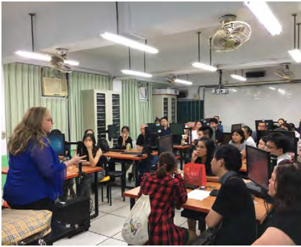
美國歷史暑期課程-在臺行前說明會