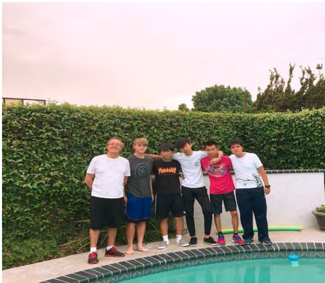
美國文化-與寄宿家庭 home 爸與 home 第合影。