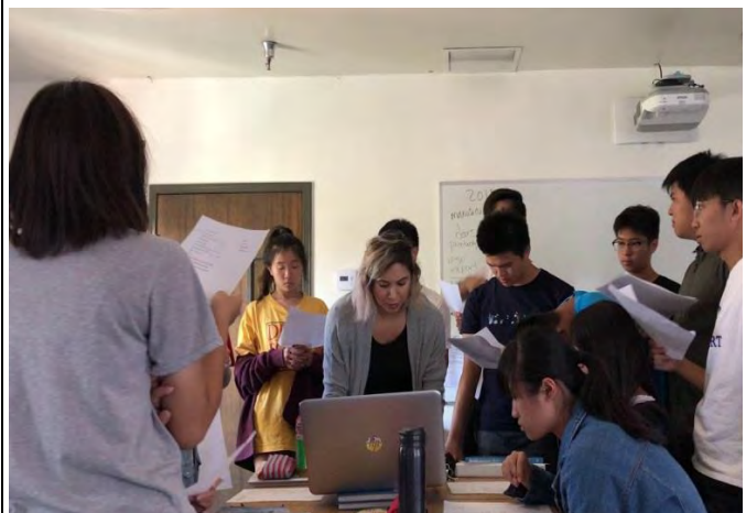
美國歷史-自編自唱