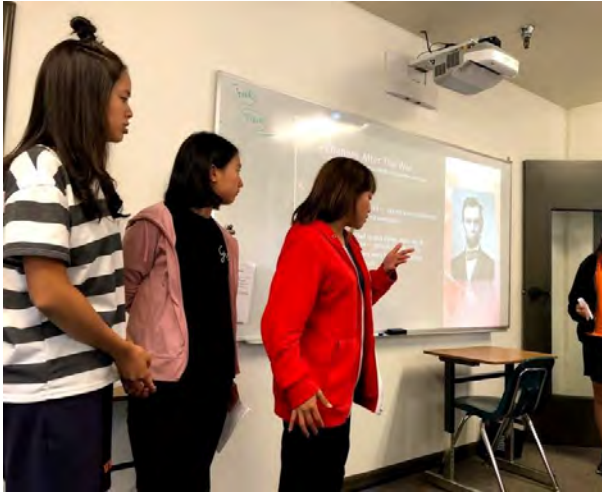
美國歷史-南北戰爭