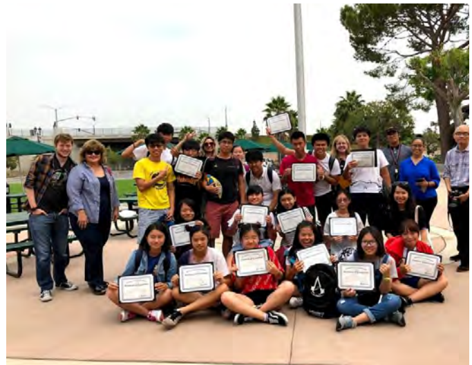
美國歷史-結業式全班順利通過美國歷史課程