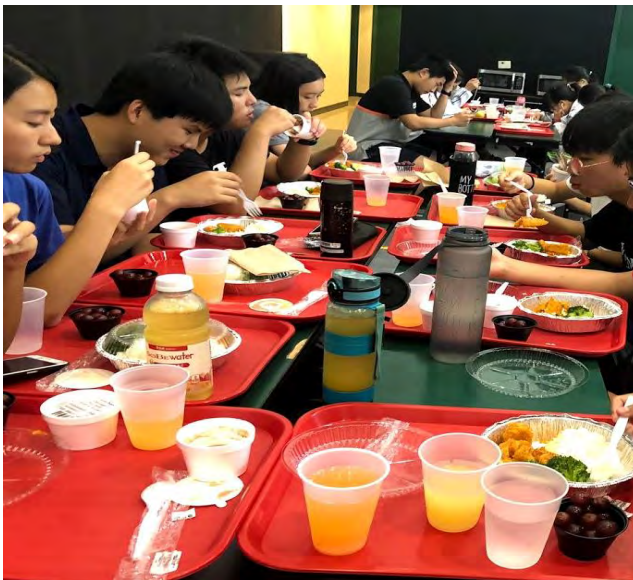
美國文化-高中餐廳體驗