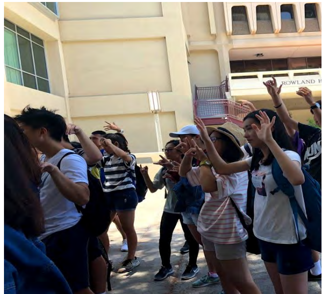
加州大學爾灣分校參訪