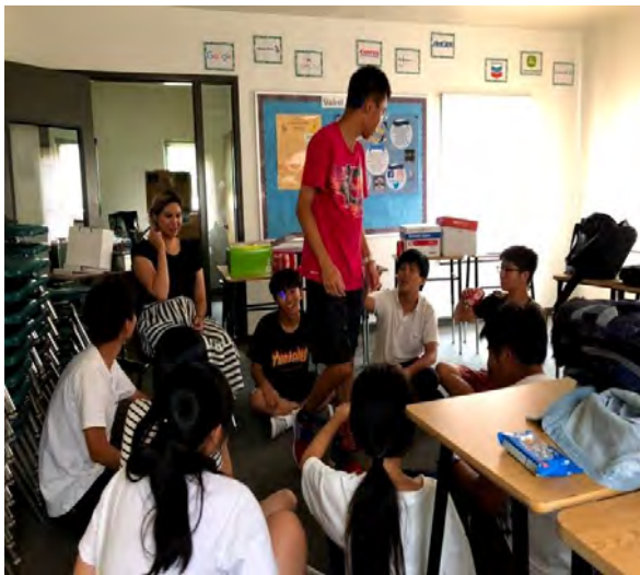
美國歷史-不同教學氛圍體驗