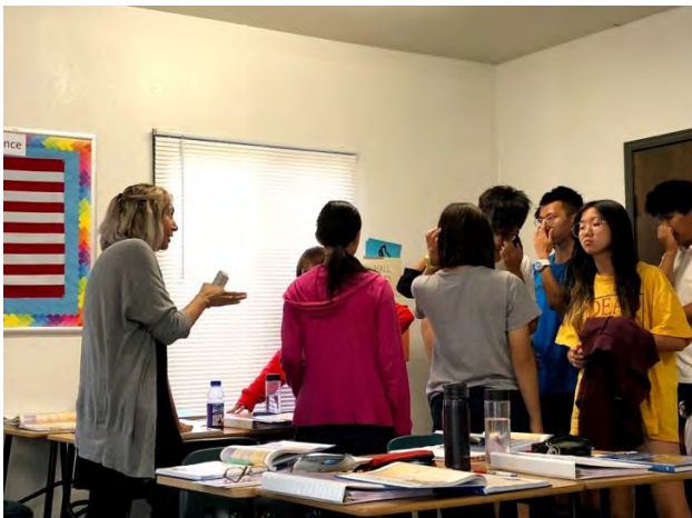
美國歷史-時事辯論