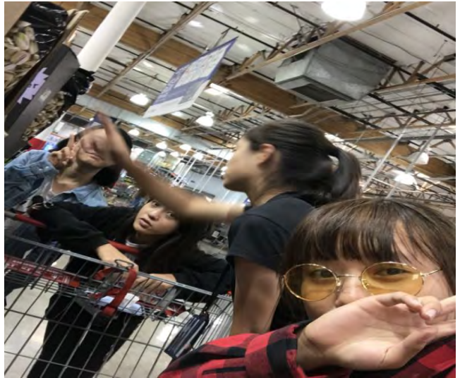
美國文化-下課後逛逛美國超市