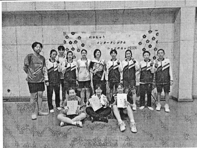
比賽獲獎選手與其他隊員合影