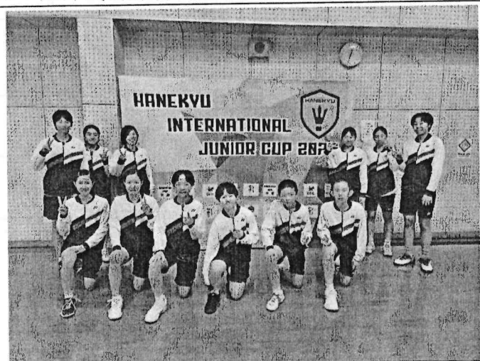
全體隊員於比賽會場合影