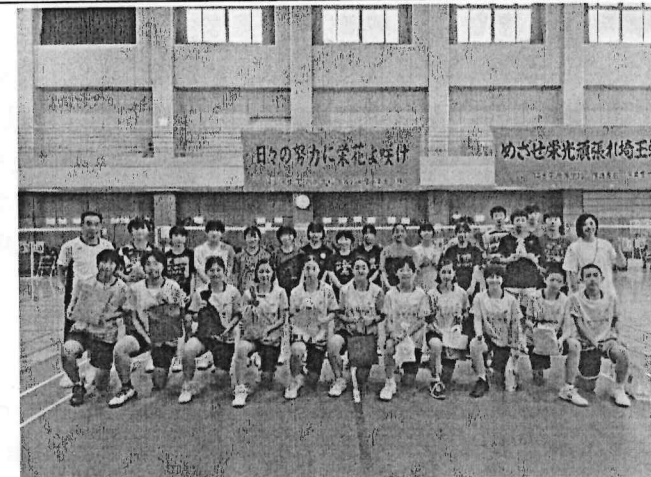
臺灣及日本選手合影