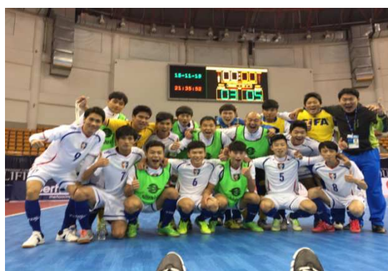
中華隊賽後慶祝晉級