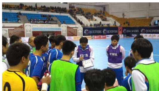
比賽中暫停戰術講解時段