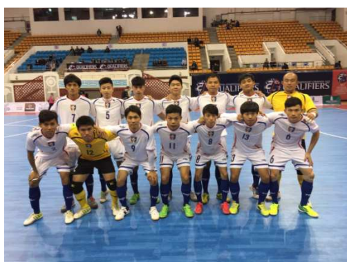
中華隊員賽前合影