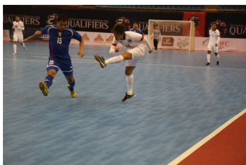
香港 10 號球員對中華後防造成威脅