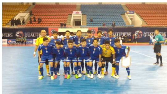
中華隊賽前團隊合影