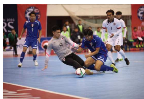
中華隊球員於門前射門遭遇阻擋