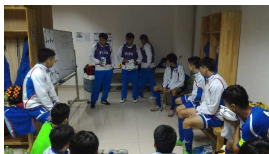
中場休息時間戰術講解