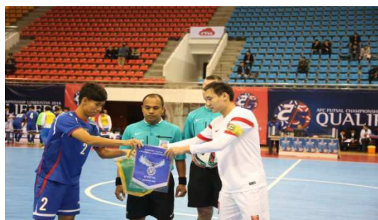
中華隊賽前與對方合影