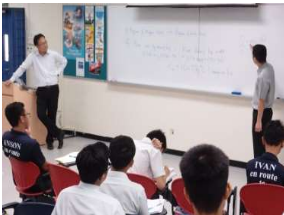
學生上台回應老師問題

教師與學生都能夠習慣不停提問的節奏、教師都能夠很有耐心的理答、不論回答好壞、教師都能用很自然的肢體動作與口吻正向鼓勵孩子、其他學生也會歡呼或鼓勵。這方面真的是可以好好借鏡，以及教導國內的孩子。