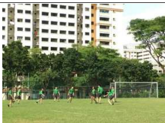
分組練習擲飛盤時，組內程度好的教程度較差的，實踐合作學習的精神

在分組討論分工項目時，讓人感到不可思議的是，所有的學生都很認真地在參與討論。不禁令人想到自己的表演藝術課，也是常常需要分組討論，即便我們在事前耳提面命要注意的各樣事項，但總是會有學生的秩序狀況不佳。我們請教帶領我們觀課的康主任，請問他們是不是輔廉的學生入學時的素質就比較好？但康主任說其實不然，但學校老師非常用心從中一開始就培養學生的品格力，後來也在課後討論中聽到老師提到輔廉是不處罰學生的。在學生犯錯時，不是只有老師對學生講道理，也會請受害的學生說出他的感受讓犯錯者知道，透過這個過程培養學生的同理心。學校還有一個開放的空間，讓學生在當中好好省思。相信就是在這樣的環境中，逐漸培養出學生尊重負責的態度。