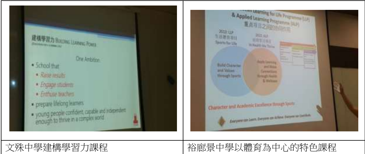
文殊中學建構學習力課程

程與領導力課程，但是這樣的課程雖然可能每個學校都有發展，但是均是以各校不同的環境、學生背景等不同的狀況設計，並且針對學生未來所需要的能力，討論與設計如何針對學生的需求的課程，並且在課堂中實施。學校也會針對學生的程度，開設相對應的課程與選修課，這雖然與新加坡的升學制度與考試制度相關，但是也是在我國未來實施 107 課綱中，可以參考與學習之處。