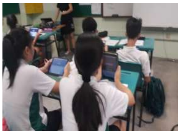
中文課使用平板電腦上課