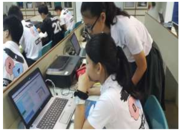
學生自然熱絡的討論