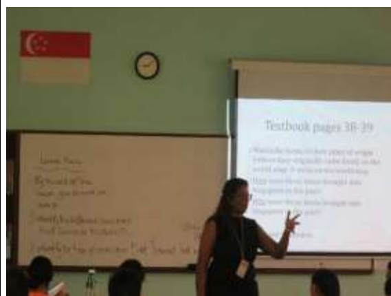
教師在授課時於白板上寫下本次課程教學重點（歷史課）