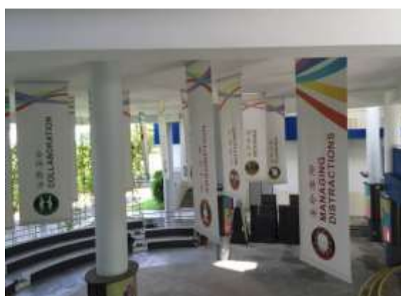
學習力課程－建構 17 種學習力指標標語