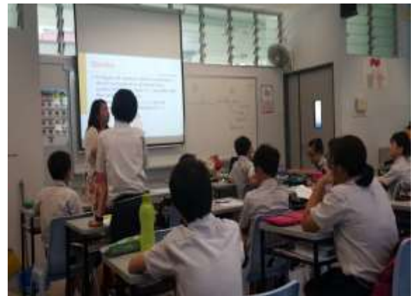
老師用提問方式帶領學生思考