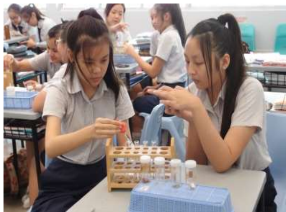
實驗時兩兩一組共同合作