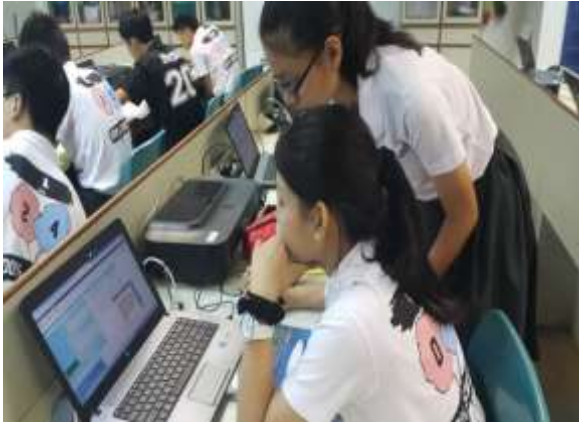
學生討論氣氛濃厚，有困難很自然地會前往幫助同學。