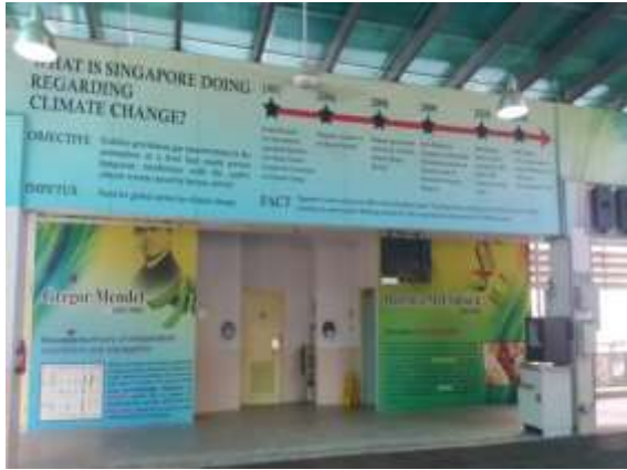
培華中學科學廣場—科學家介紹