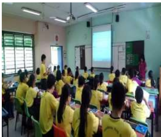
學生上英文課的情形