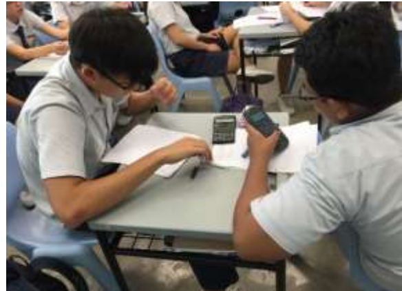
學生(中三)於數學課分組討論，每人皆使用計算機