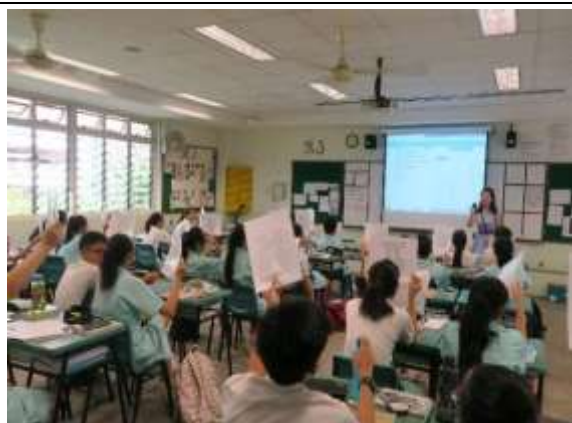
學生使用答題卡，教師以手機將學生答案掃