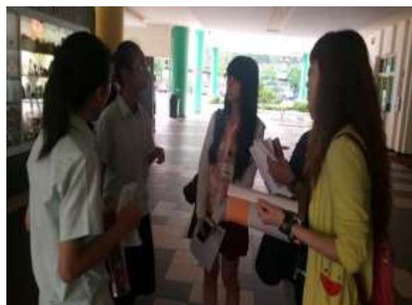
學生向外賓說明學校的課程安排與教師教學狀況