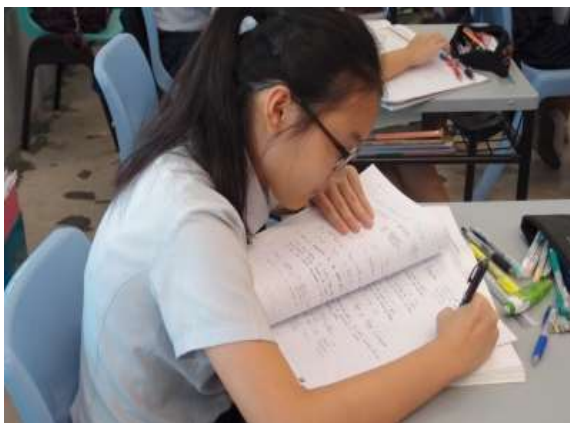
學生認真書寫筆記

因此，學生學習的基本能力如作筆記、專心聽講方面。在學校經營、班級經營都可以加入培養規劃的重點。