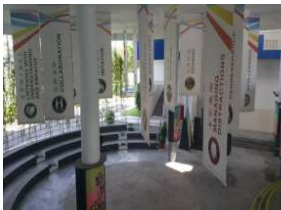
文殊中學將希望學生達到的 17 種學習力做成標語，掛在中庭

這次參觀新加坡的學校，發現學校幾乎都會把學校相關優異表現的獎盃與優良事蹟，置放在公開的場所，通常看到的是穿堂，或是學校另闢校史室展示，這樣不僅讓學生了解學校的優良事蹟，也更有榮譽心與向心力。另外學生優良表現，如大型考試表現優異的學生等等，均已木製的公布欄(至少有兩間學校均為同樣的款式)，公布在活動中心，讓所有的學生都能看到，也是另一種激發學生榮譽心與認同感的情境布置。