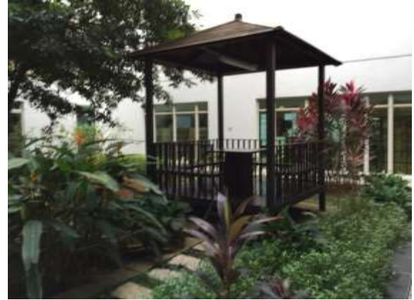
美麗的涼亭供學生休憩討論課業使用