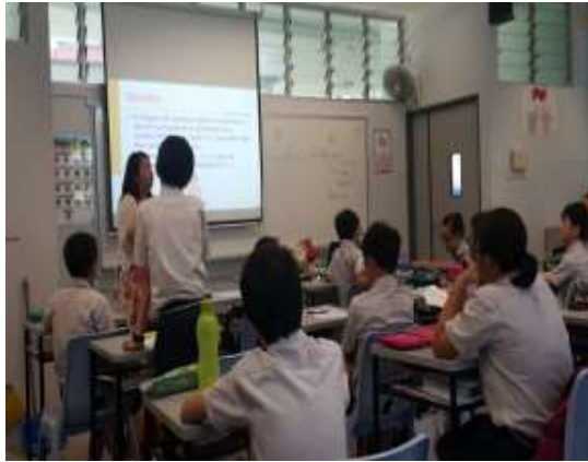
文殊中學教師用提問方式帶領學生思考