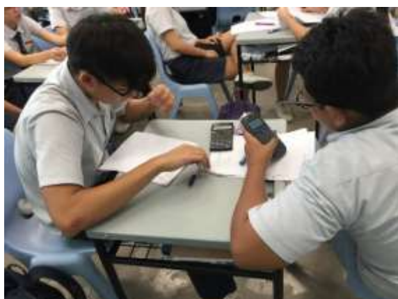
學生在數學課時普遍使用計算機計算較為細節的部份（數學課）

投入教育圈雖然才短短的三年，但是從學生時代就開始經歷了臺灣教育界的改革浪潮，對於不同的制度和方法也不斷的進行修正與改良。不論是何種制度與方法，都應該針對環境和現實加以改良才能適合我們的學生，而這些改良與修正正是需要時間來證明的。期待這次參訪與交流的火花能夠成為星星之火，替北政國中甚至是教育界帶來燎原之火的創新與改變。