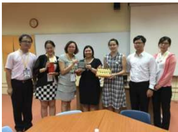
與輔廉中學校長合照

利用每個年級的體驗學習週不同的活動進行，訓練團隊精神、讓學生嘗試當領袖，自行策畫及完成整個活動。中一由班主任提名或學生自行報名，學校老師會進行甄選；中二擇進行學生會幹部訓練；中三進行驗收，方式為帶領中二新進成員，作為領導能力的訓練，以及學校重大活動的設計、規劃、進行，展現知識與技能的運用。