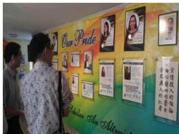
學校老師與學生的榮譽榜，做成大型海報張貼在穿堂