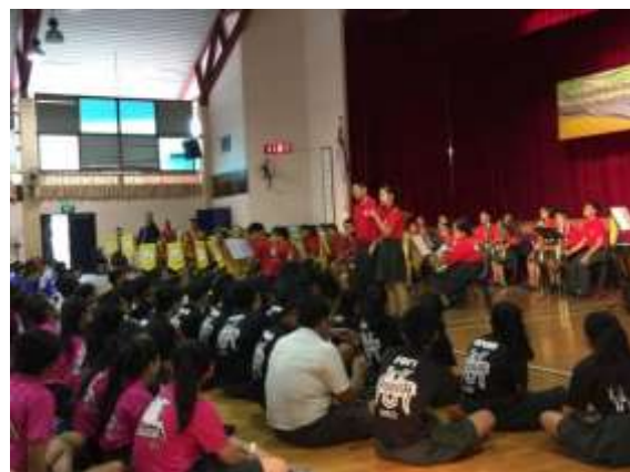
輔廉中學的樂隊表演