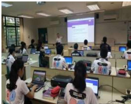
科學課程使用資訊融入教學