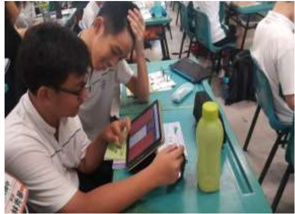
學生自然地討論與交流