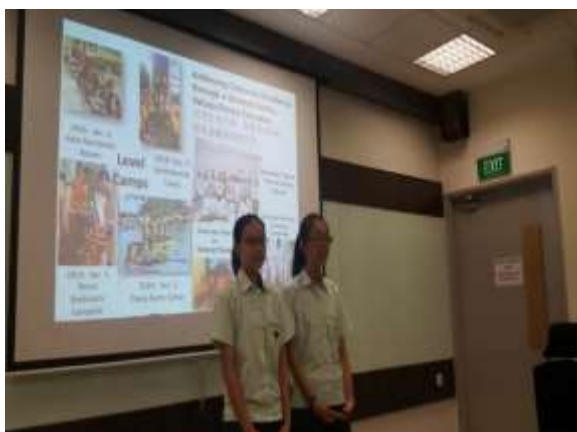
培養學生領導力—由學生報告學校的學習與特色

b.核心策略二：關注學生的學習表現，希望以學生為中心的教學方法，讓學生得到優秀的成績，培養學生有判斷、思維能力、自主學習、有效地解決問題。首先強調營造良好的學習環境，不管是硬體或軟體，有強大的教師團隊，注重培養老師的技能以提升學生學習。主要的策略是U P A C (Understand/Play & Answer/Check)。另外一項策略，是希望培養學生能夠有效的溝通，通過一種提問策略，引發學生的思維與思考，顯性地表現出來，這也是全校推行的策略。學習不只侷限於教室內，希望在學校教室以外的角落適宜學習的環境，在課餘時間可以在學生的廣場與角落學習，此外學生也會到海外與姊妹學校交流。而學生的學習文化提升老師的教學能力，裕廊景中學相信老師對孩子的學習是有關鍵作用的，我們為老師們營造適合的學習環境，發展合作與對話的文化。除此以外專業發展課程，建立教師專業學習團體，讓老師們互相支持，並請資深的教師為老師進行課程的培訓與觀課。