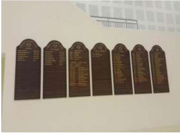
掛在體育館的榮譽榜