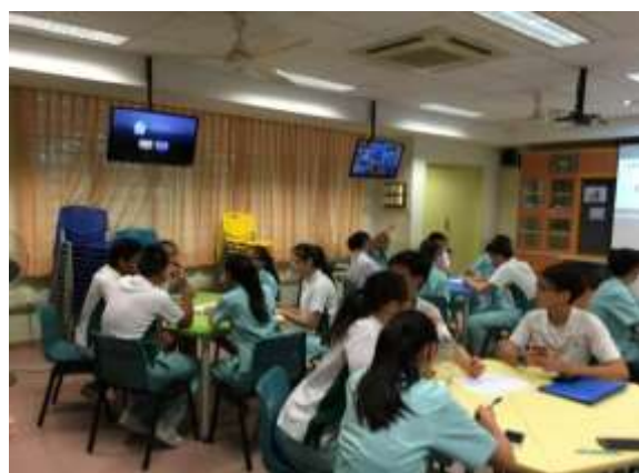
英文課程重視聽與說的表達

b.在議課時，授課教師對於課程設計進行說明。2015 年先檢討實施情形(課程評鑑)，然後規劃 2016 年課程計畫，為了教導學生論說文，以「網路對學習是必要工具嗎？」為主題，設計四節課，然後進行作文評量。