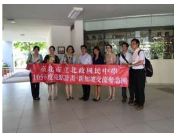
與文殊中學校長合影