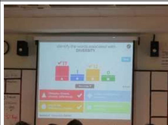
教師使用線上網站，學生使用手機上網回