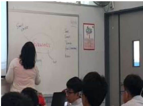
文殊中學老師以煙火為主軸， 課程設計環環相扣

短短約一個小時的課程中，每一個環節都環環相扣，連舉例都用同一個例子，學習單上的練習範例與所選用的英文歌區，均是以「煙火」為主題，讓學生能夠更加地進入狀況，而且幾乎每一分鐘都沒有冷場，這樣的教學設計是我們需要學習的，而且也讓人非常的讚嘆與配合。