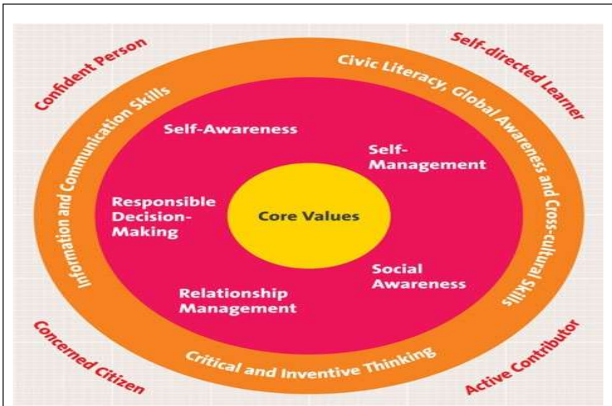
新加坡教育部制定：21 世紀學生所應該具備能力的願景與架構圖 11