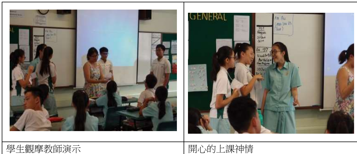
學生觀摩教師演示

四間學校都有因應教育單位規定的基本能力去設置學校的方針，校本課程或班級經營教師個人課程都有類似這種基本學習能力的培養。像是學生如何討論、如何聆聽、如何尊重同學等。或是做筆記、畫線、如何向老師提問等基本的學習能力，都有系統的在訓練培養。