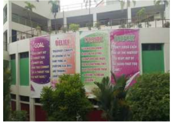
超大型標語說明學校的目標及願景