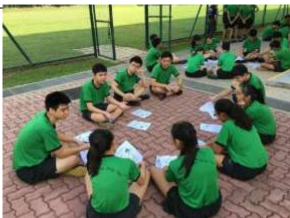
輔廉中學的體育課在分組討論，每一個學生都非常認真參與。

輔廉中學的課程是中四和中五的學生一起上課，因為學生年紀較大、能力較強，所以是將全部學生每十人分為一組，除了各組組內一起練習提升球技之外，未來要自己籌劃比賽，自己排賽程、自己輪流當裁判、記分員。這種作法對我們來說相當新奇，因為學生能透過這樣的經驗，大大提升個別的體育能力、規劃能力、領導力、分工合作能力等等。