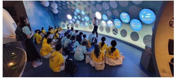
與聖中土生華人文化館合影