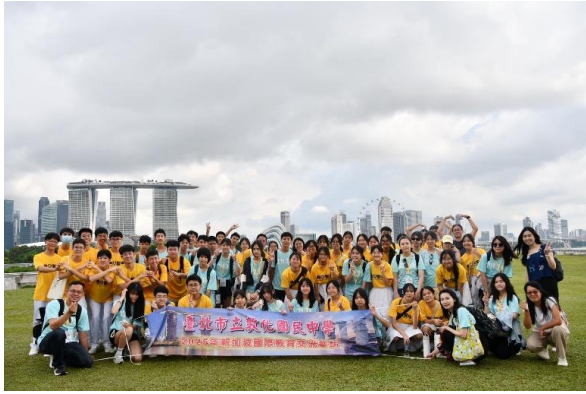
濱海堤壩旁與學伴合影