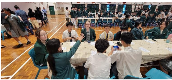
與聖中、澳洲同學共同進行晚宴