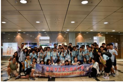
新加坡機場、聖公會師長接機合照