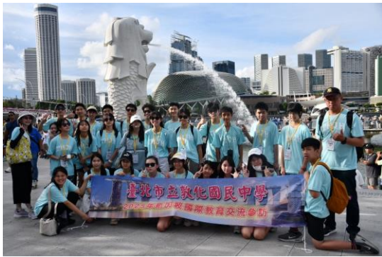
新加坡魚尾獅踏察