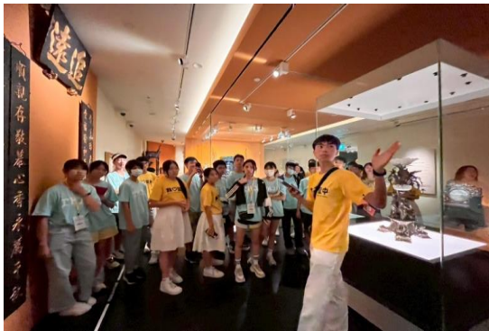
聖中土生華人文化館解說