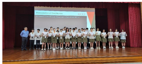
聖中校長頒發參與 GLP (全球意識課題研究) 課程證書