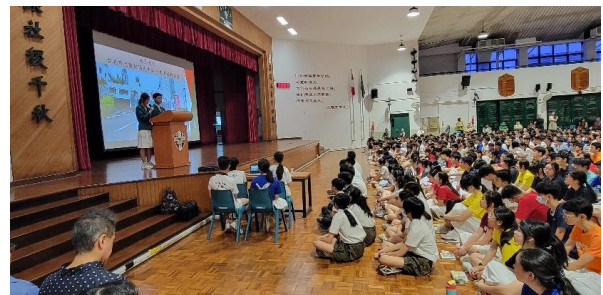
參加聖公會中學晨會活動