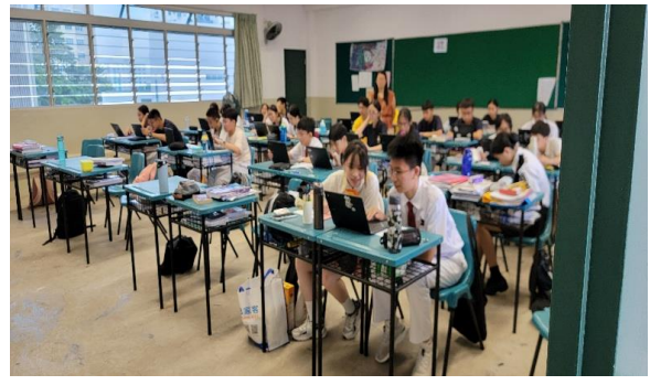
同學入班與學伴共學新加坡課程