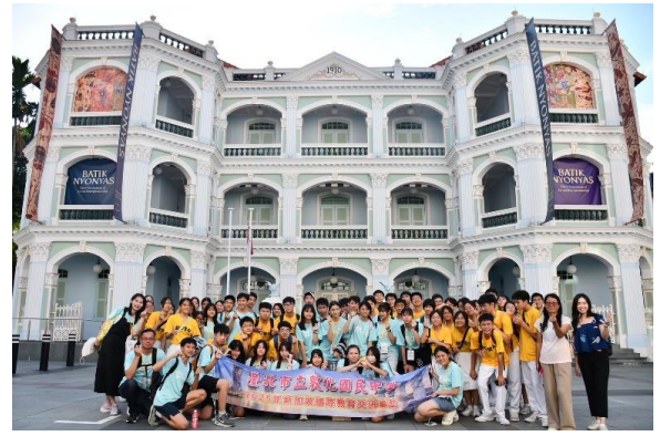
與聖中土生華人文化館合影