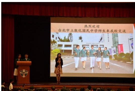
師長代表敦中致感謝詞