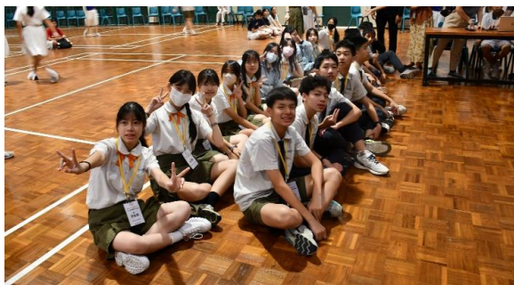
參加聖公會中學晨會活動