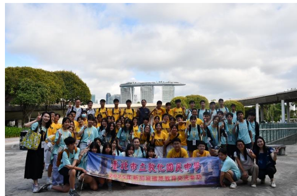
與聖中一齊參觀永續再生能源館