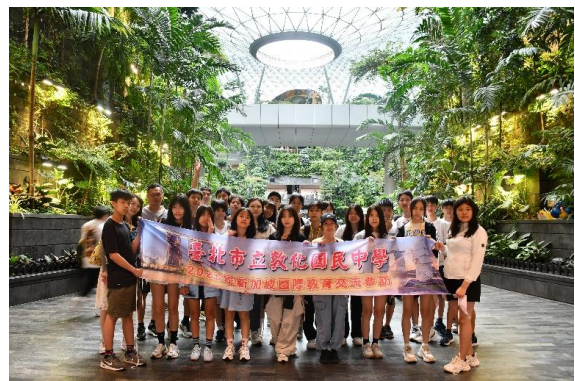
樟宜機場雨漩渦踏查