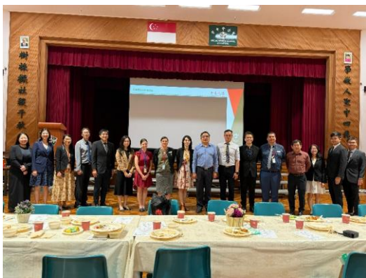
晚宴與新加坡師長暨澳洲師長合影