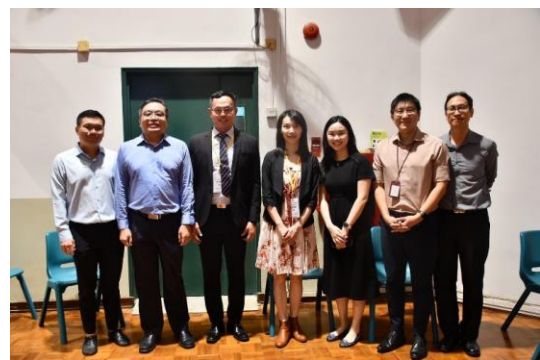
與新加坡聖公會校長、主任、課程老師合影