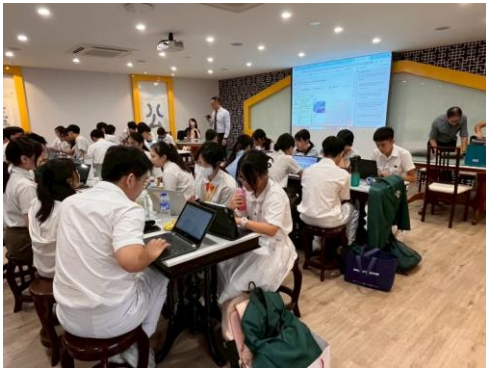
與聖中同學小組共同進行 GLP (全球意識課題研究) 發表準備