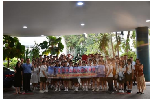
新加坡聖公會中學參觀交流