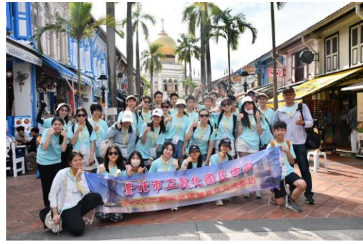
新加坡甘榜格南踏察