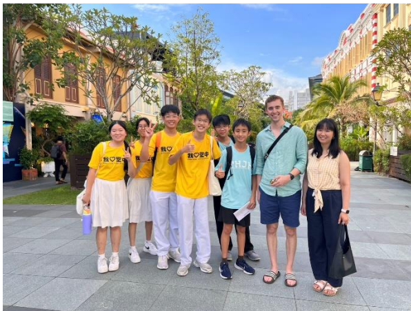
口說英語街訪與訪談者合影