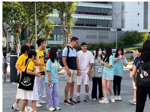
敦中口說英語街訪