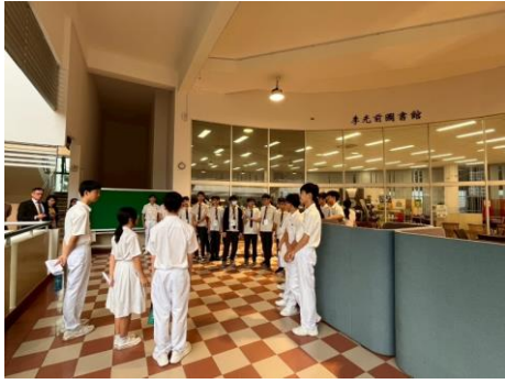
聖中同學校園環境導覽