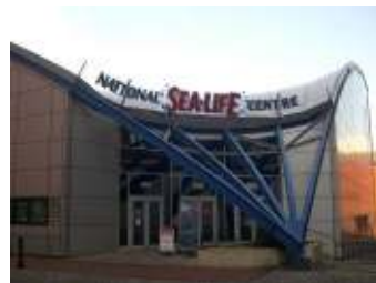
▲ National Sea-Life Centre