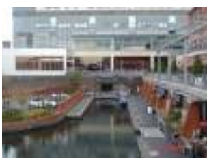
◀ Mailbox 及運河