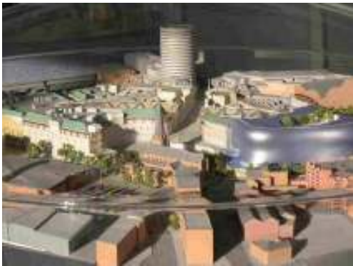
◀車站附近地區模型

New Street Station 車站附近地區開發與市中心再發展有密不可分之關係，市中心再發展劃定有商業改善地區(Business Improved District-BID)，BID 面積約為 100 acres，範圍介於 Five Way 及 Paradise Circus 之間，核心是 Broad Street，向南延伸到 Holiday and Tennant Street，向北延伸到 Sheepcote/Vincent Street 及 King Edwards Road，部分伯明罕運河也在 BID 範圍內。