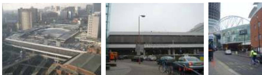
◀New Street 車站

交通開發策略在車站地區轉運系統主要是 New Street / Moor Street 及 Snow Hill 三個車站間的免費接駁系統。