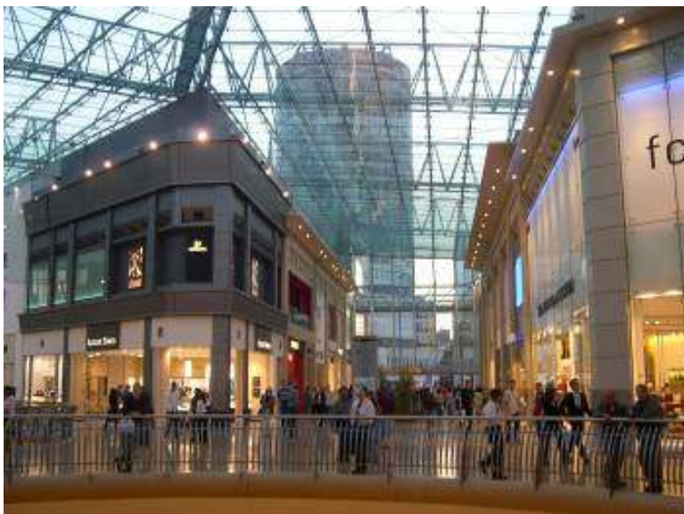
▲ 英國車站及大型百貨公司偏好鋼管玻璃透空採光，增加人行動線之方向性開發