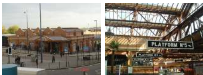
◀Moor Street 車站