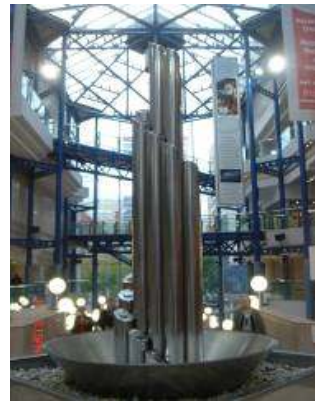
◀ 音樂廳 ▶