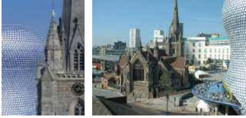
◀ St.Martin 教堂