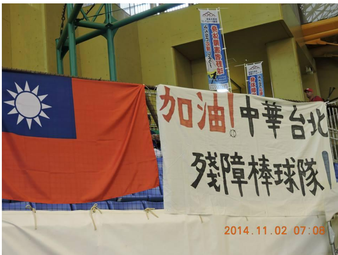
會場內加油旗幟一照