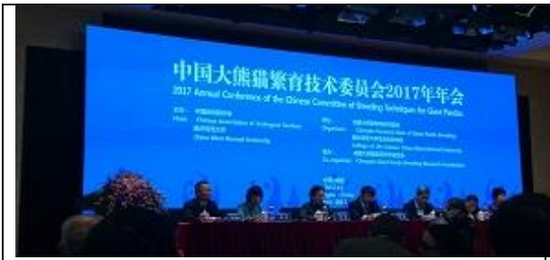
圖1、中國大熊貓繁育技術委員會2017年會開幕儀式