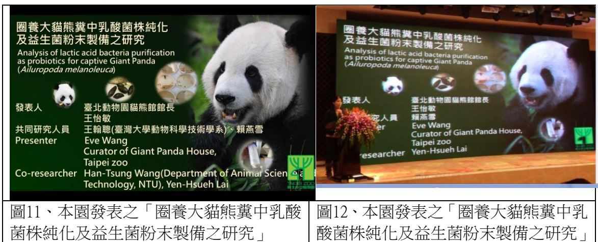
圖11、本園發表之「圈養大貓熊糞中乳酸菌株純化及益生菌粉末製備之研究」

了解應用在大貓熊飼養管理的可能性。圈養大貓熊或多或少個體有腸道菌相較不穩定，易發生腸道菌相混亂，而有黏液便、腸胃不適之症狀，本研究未來應用性也受到與會者期待，期望本園能持續發展。