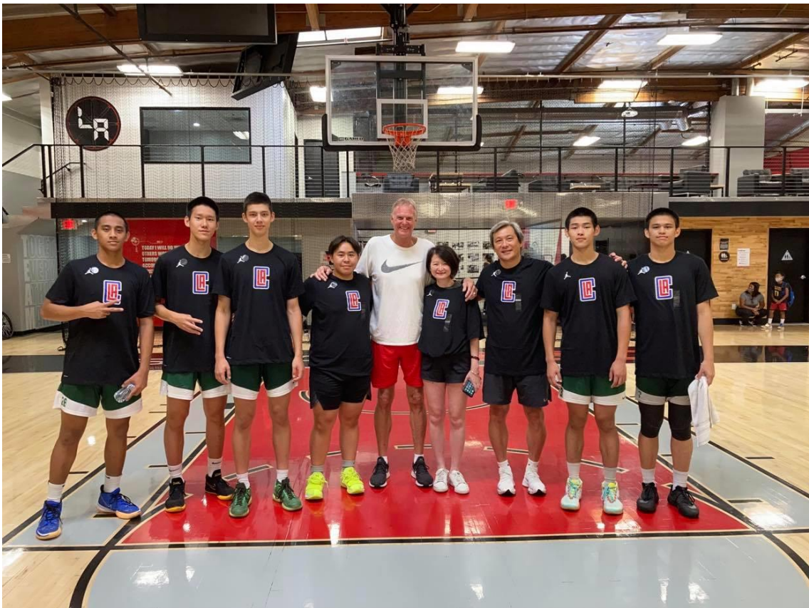
說明：最後一日訓練，開心地穿上教練送的快艇隊紀念衫拍照。