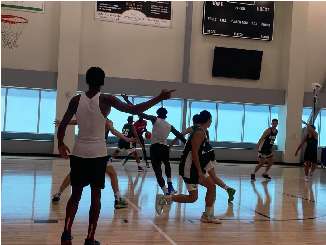
說明：與南加州明星隊的對抗賽。