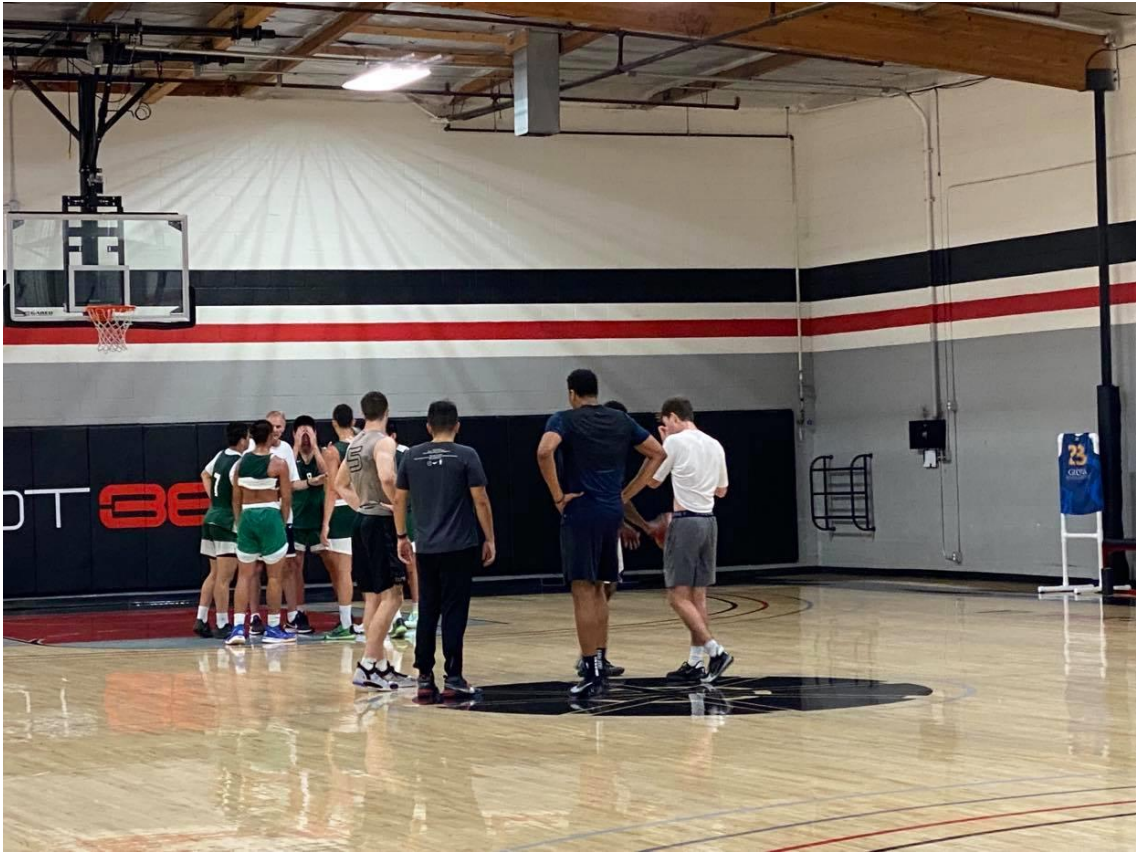
說明：每日訓練後的例行會議。