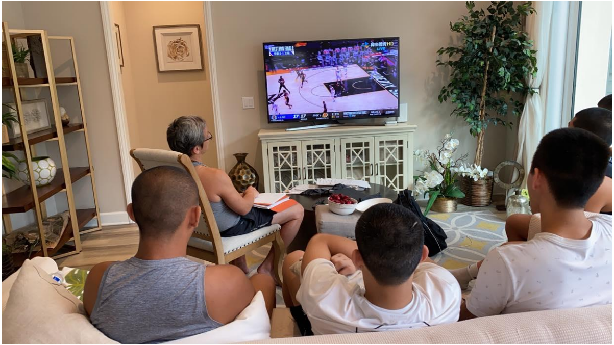
說明：教練與球員在住處一起觀看 NBA 季後賽。