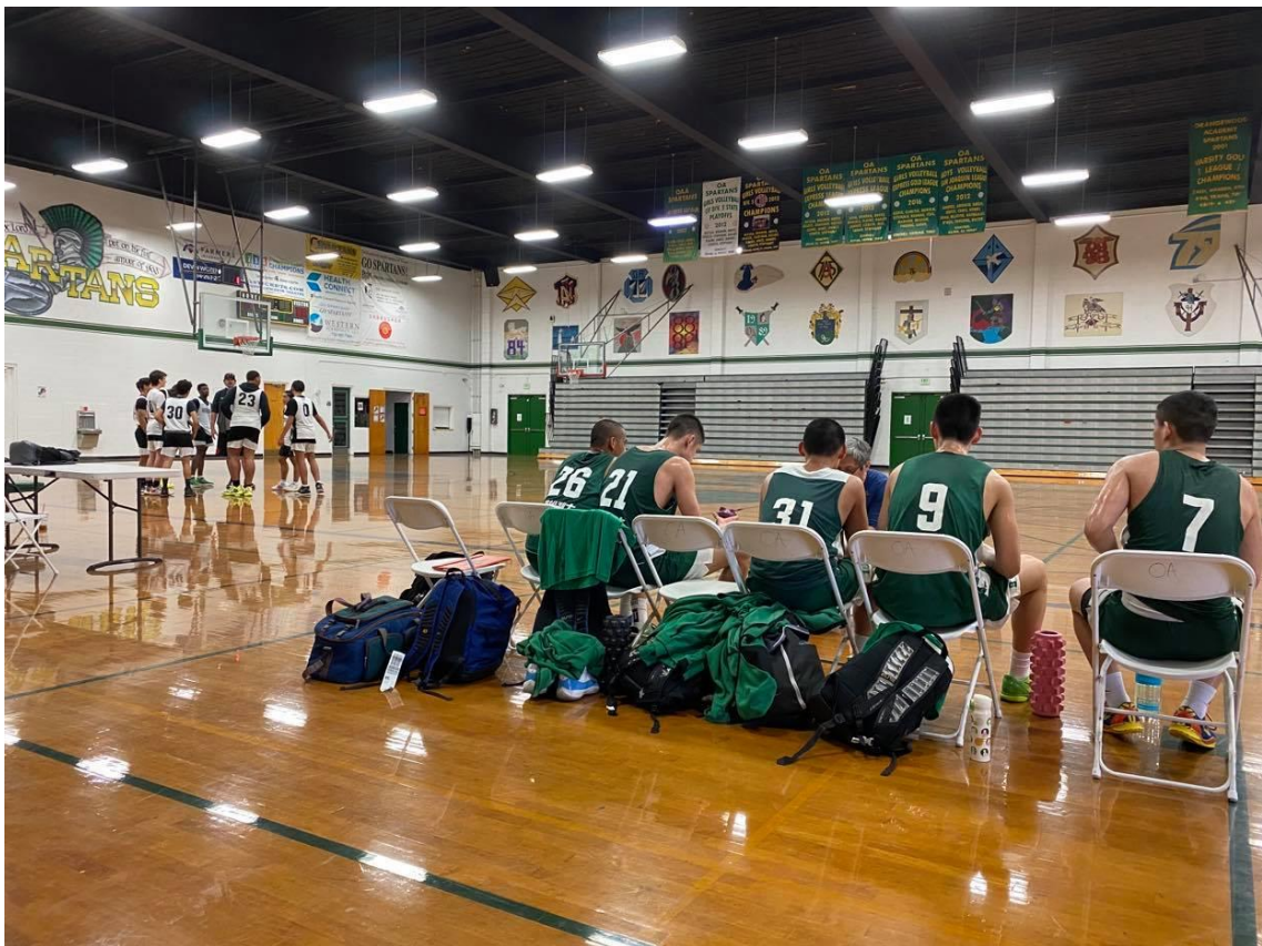
說明：與 Orangewood High School 的對抗賽。