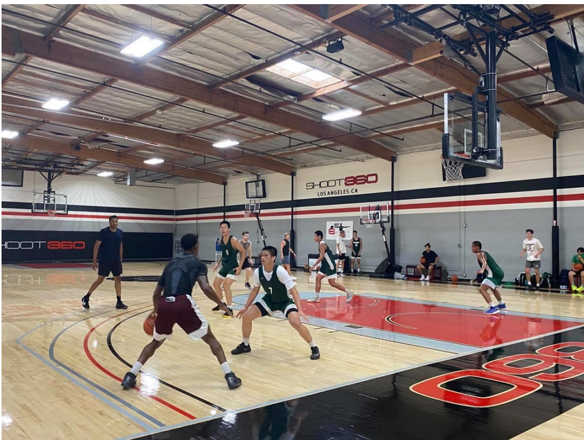
說明：與職業隊及大學隊球員一起接受 NBA 教練團訓練。