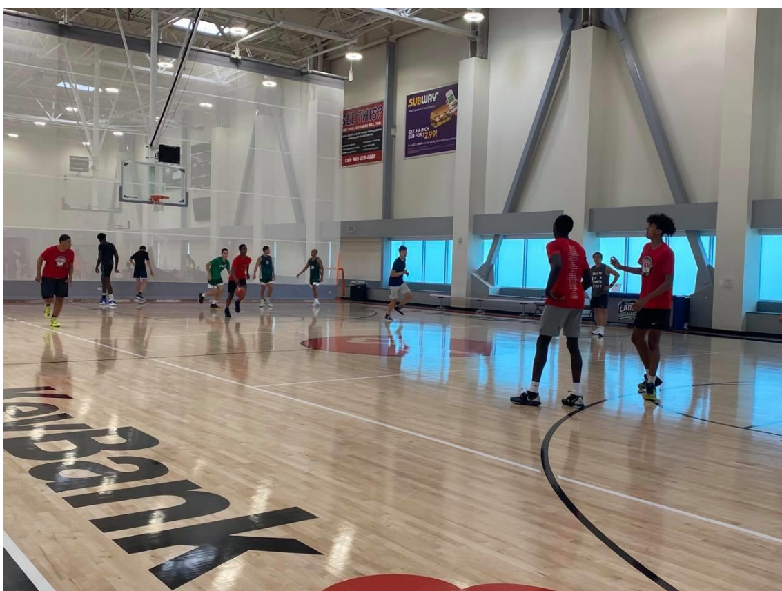
說明：與南加州明星隊一起訓練。