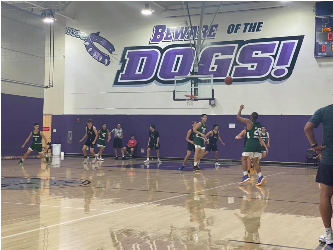
說明：與 Cypress High School 的對抗賽。