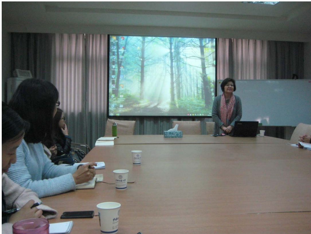
青島大學 EMBA 班 講座照片