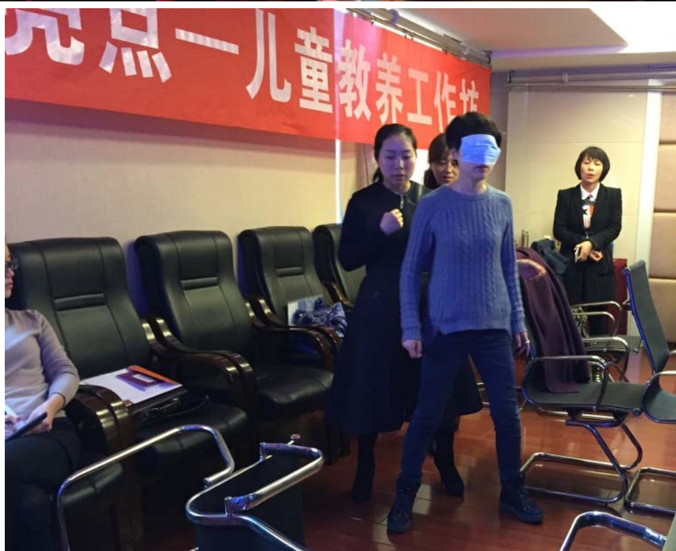
湖北省心理衛生協會學術年會：「看見孩子的亮點—兒童教養工作坊」