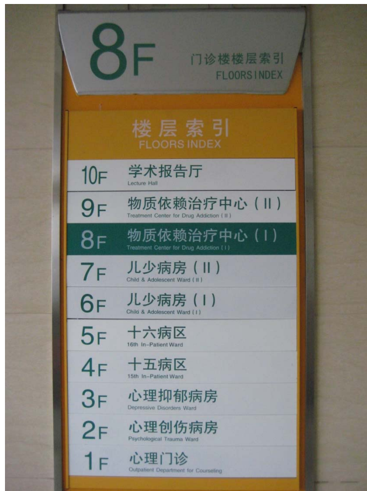
武漢市心理醫院病房 參訪照片