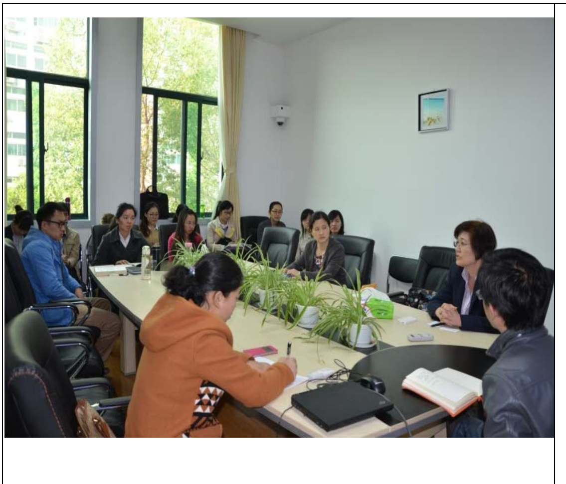
華中師範大學 座談照片