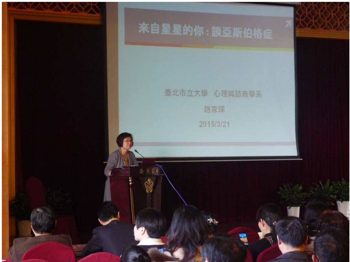
湖北省心理衛生協會學術年會專題演講：「來自星星的你：談亞斯伯格症」