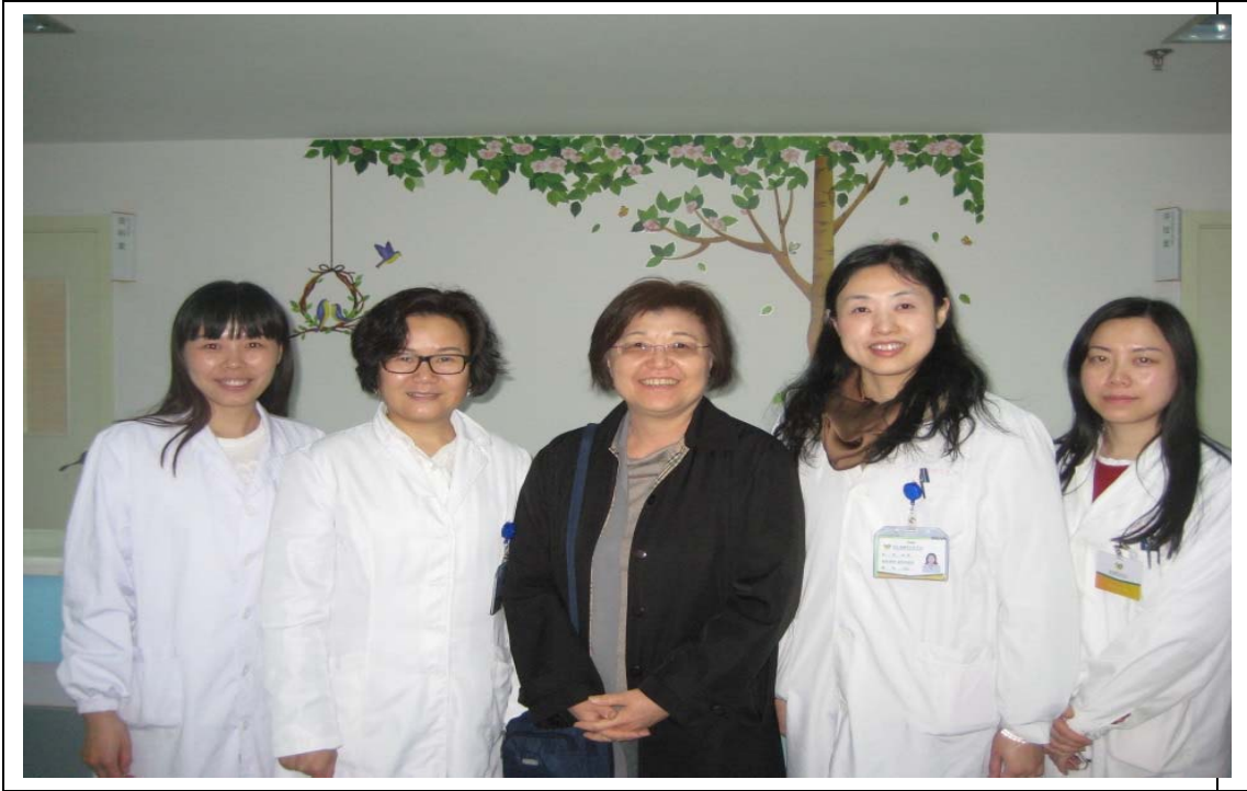
武漢市心理醫院自閉兒早療中心 參訪照片