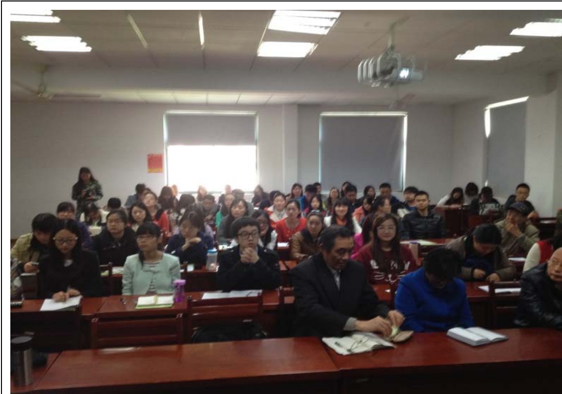
中國地質大學 演講照片