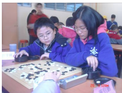
男女混雙組戰況激烈