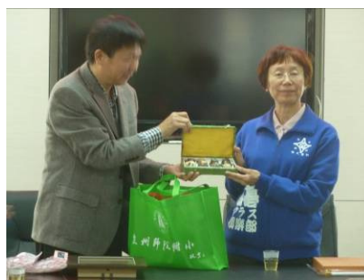
雙方校長互贈紀念品