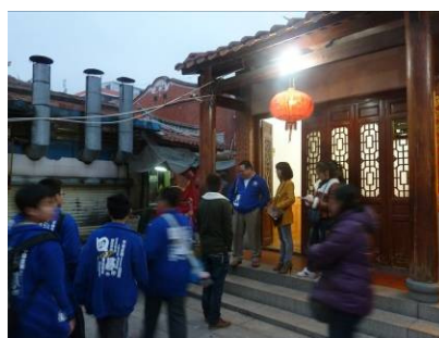
進行各項參訪活動