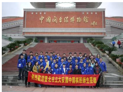
進行各項參訪活動

本次活動，除參與相關交流與比賽外，學生們也利用機會，飽覽中國大陸閩南地區建築與文化特色，諸如閩台緣博物館、錦繡莊民間藝術園、開元寺、清源山、老君岩等，讓學生們對於閩南文化與臺灣傳統文化有了深刻的學習與認識、