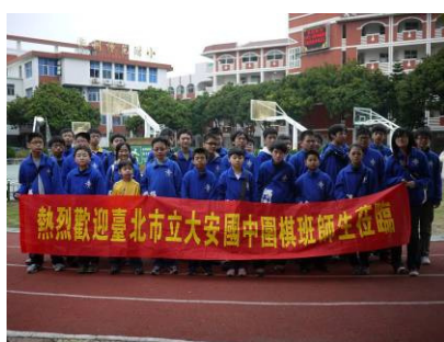
泉州師院附屬小學參訪

本校師生一行 52 人於 2 月 24 日下午，應邀至泉州市師院附屬小學參訪，該校歡迎儀式上雙方校長除互贈錦牌與特色紀念品外，更盼未來能有進一布之交流活動。隨後本校 32 名學生與該校 32 名學生進行兩輪交流友誼賽，讓雙方學生達到彼此交流之目的。歡迎晚宴前兩校學生更自發性的展開籃球交流活動，更增進學生們彼此情感交流。