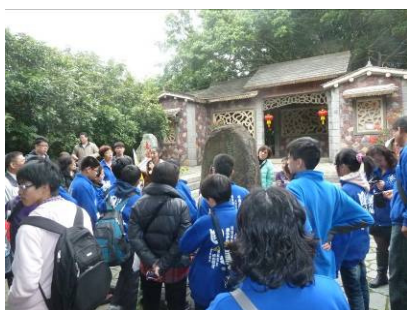
進行各項參訪活動