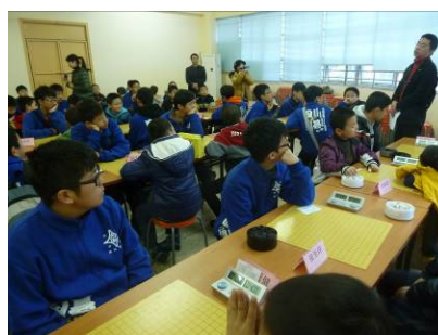
第一屆閩臺青少年業餘圍棋公開賽