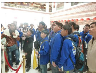
進行各項參訪活動