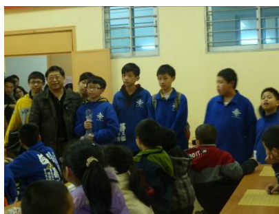
本校勇得男子團體組第二名