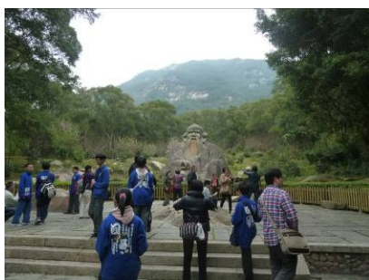
進行各項參訪活動