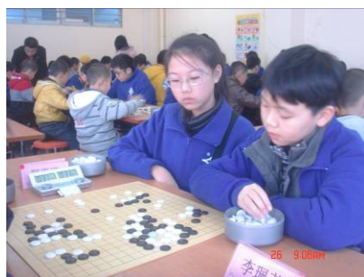
男女混雙組戰況激烈