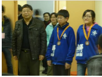
本校榮獲各組優異成績