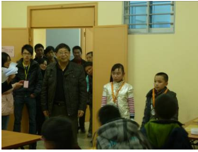
大陸學生榮獲各組優異成績