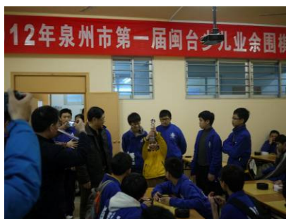
本校勇得男子團體組第一名