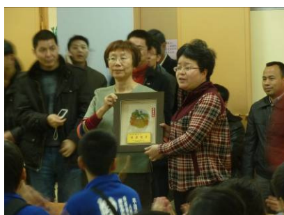
本校與主辦單位互贈紀念錦牌