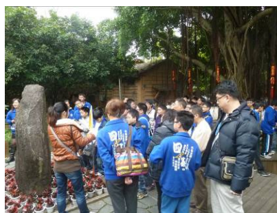
進行各項參訪活動