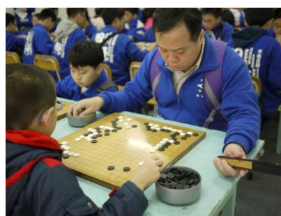
鄭主任指導附小學生