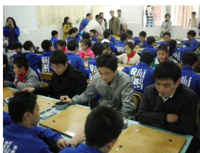
泉州師院附屬小學參訪