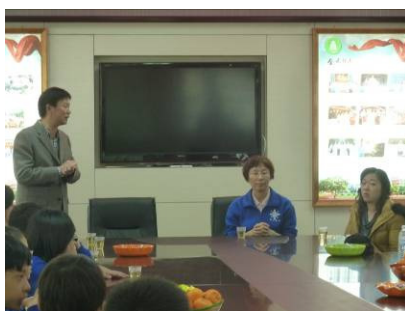
泉州師院附屬小學參訪