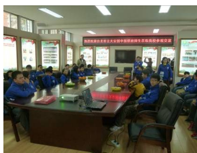
泉州師院附屬小學參訪