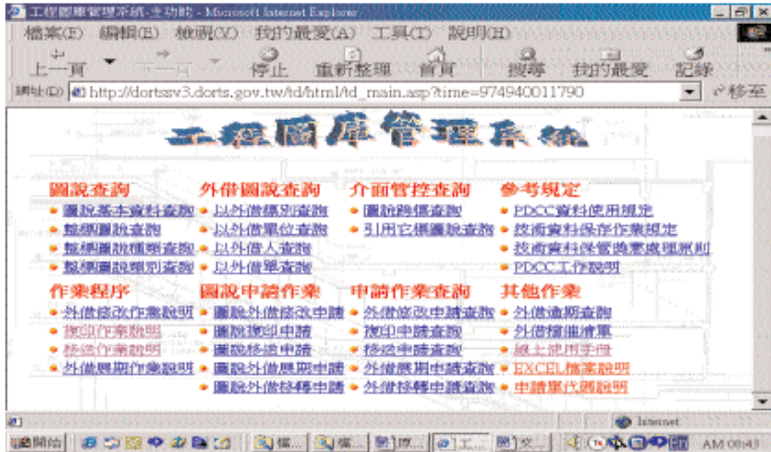
圖一 工程圖庫管理系統