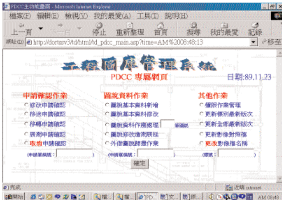
圖四 工程圖庫管理系統—PDCC專用模組

此模組為PDCC工程圖說管理之主要作業，包括圖說基本資料之增加、刪除、修改之功能外，另提供了計畫文件管理中心對各申請單位之申請作業確認處理作業（詳如圖四），其各項主要功能如下：